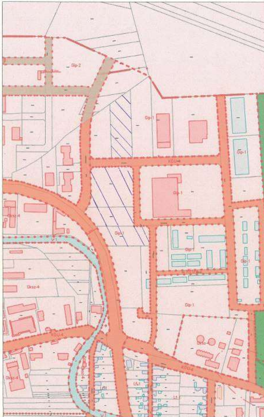
2018.7.25, Szekszárd, M = 1:4000