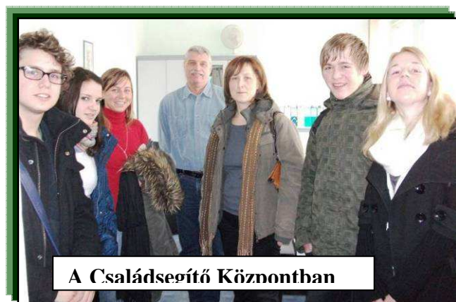
A Családsegítő Köznonthan