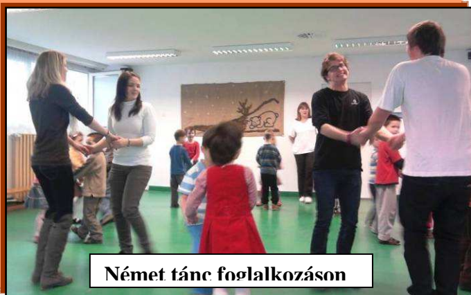
Német tánc foglalkozáson