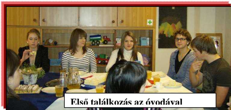
Első találkozás az óvodával