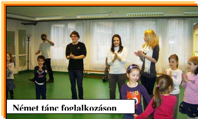
Német tánc foglalkozáson