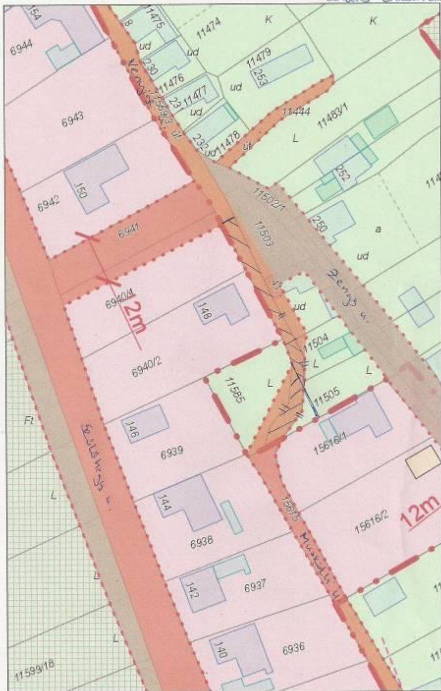
2014.5.27, Szekszárd, M = 1:750