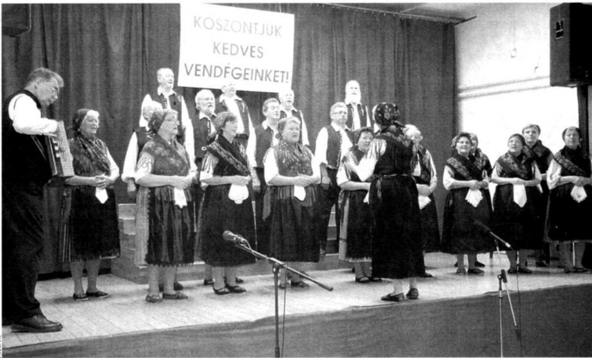
A szekszárdi Mondschein kórus népviseletét is értékelte a szakmai zsűri. A közönség a dalok végét meg sem várva tapsolt

NÉMET DALOK A legjobbak közül is kiemelkedett a Mondschein kórus