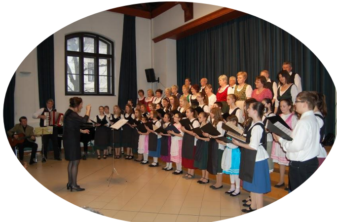
Tavaszcímű műsor a Szekszárdi Babits Mihály Általános Iskolában (3.)