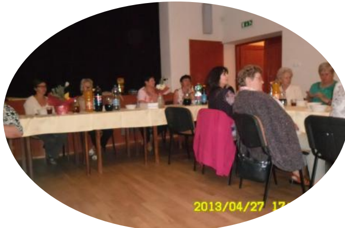
Német Nemzetiségi Kórustalálkozó Mözs (4.)

Május ban a Szekszárdi Német Nemzetiségi Klubbal közösen meghirdettünk egy találkozót azok számára, akik szerettek volna német népdalokat tanulni, német népszokásokkal ismerkedni, recepteket cserélni. Vendégeink voltak: Mözsi Német Nemzetiségi Kórus, Kakasdi Német Nemzetiségi Kórus, Óbányai Német Nemzetiségi Klub. (5.) Mindhárom kórus műsorral készült. Remek alkalom nyílt arra is, hogy az idősebbektől mi is tudjunk dalt gyűjteni.