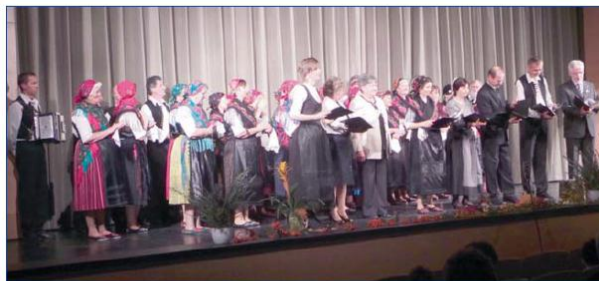
Die ehemaligen Dirigenten überraschten Chor und Publikum mit einem gemeinsam gesungenen Brahms-Lied