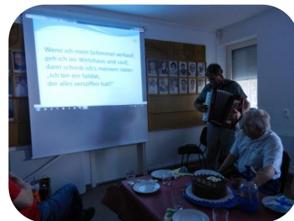
A kedvenc dal.