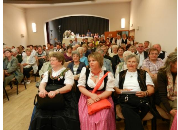
A közönség és a zsűri