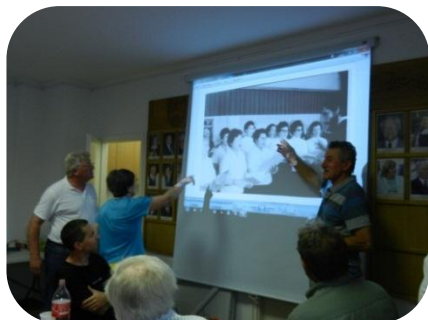
Az első szereplés 1978-ban. „Névsorolvasás”