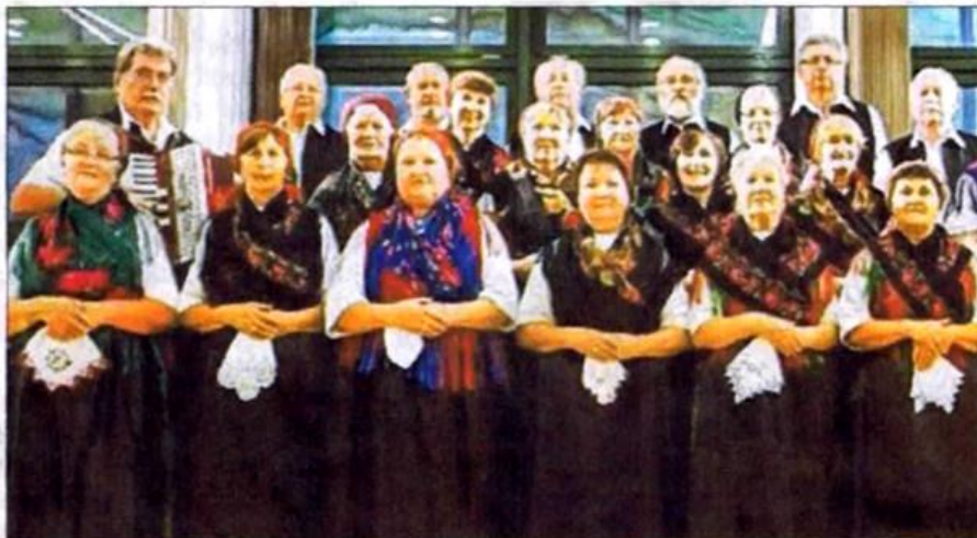
In traditioneller Tracht präsentierten sich die Mitwirkenden bei den Jubiläumsfeierlichkeiten des ungarischen Mondscheinchores.