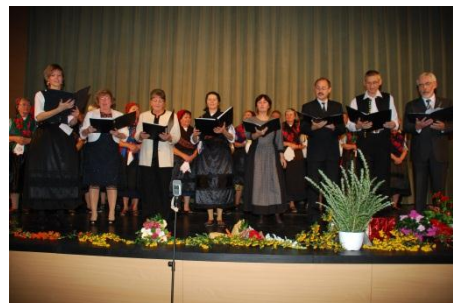
Egykori karnagyok köszöntője.