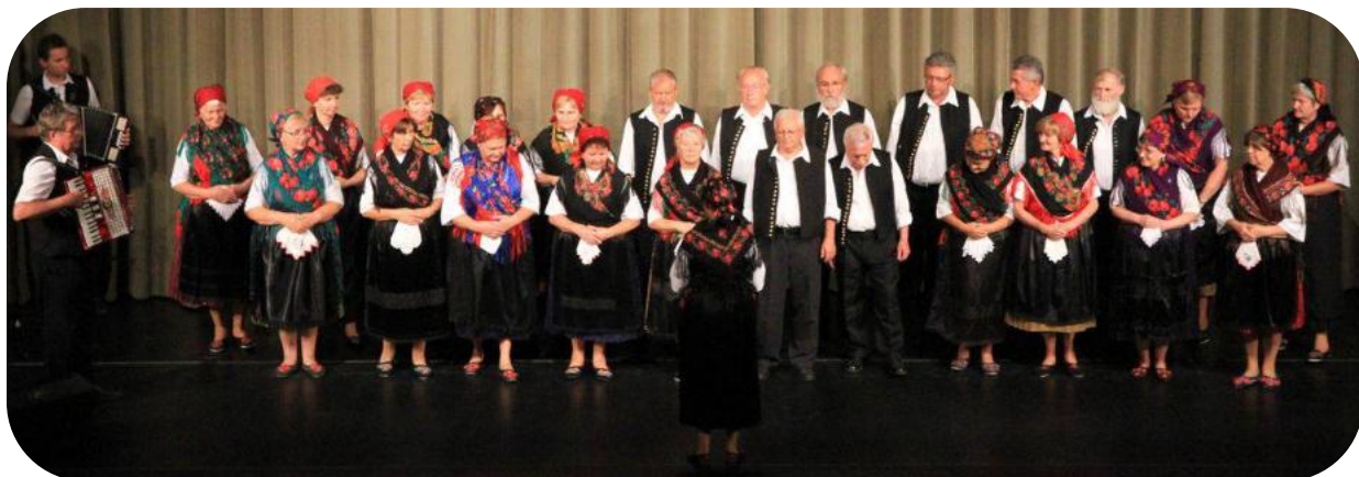
Babits Mihály Kulturális Központ avató-megnyitó műsora. (7.)

Augusztusra a is érkezett fellépésre való felkérés. videó