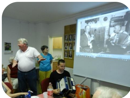
Ugyanaz a harmonika a nagypapa (vetítőképernyőn) és az unoka kezében