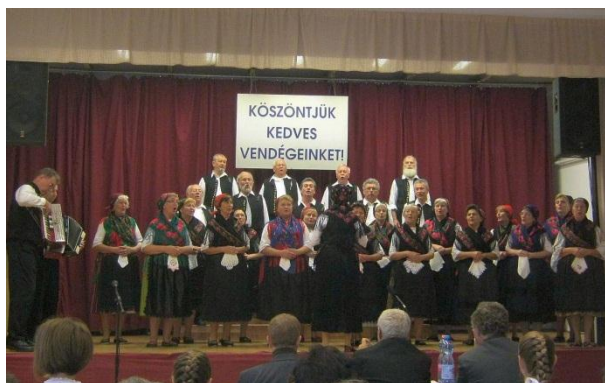
Tatabánya, népzenei minősítő