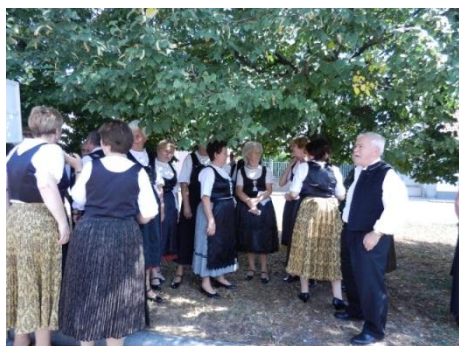
Készülődés a felvonulásra. A felvonuláson énekeltünk is. (9.)