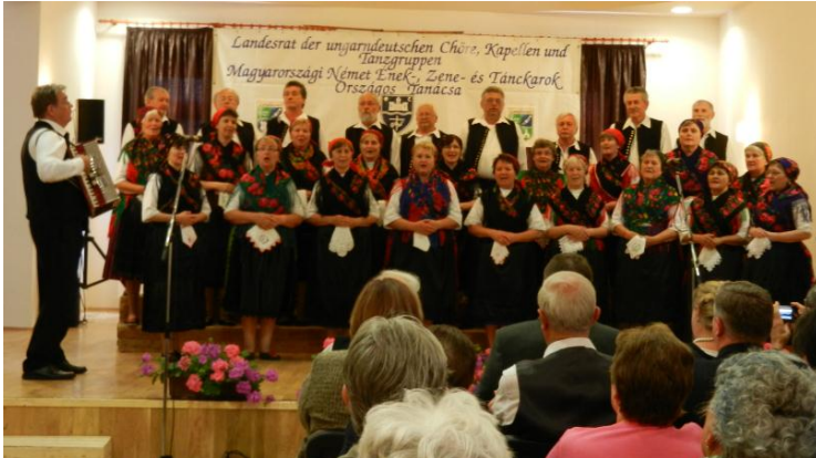
Német Nemzetiségi Kórusok Minősítője (Landesrat), Mözs (6.)

Június hónapban minősítőn vettünk részt, ahol arany fokozatot értünk el.