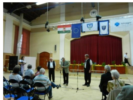
A bejelentés: harmonikásunk kítüntetést kap.