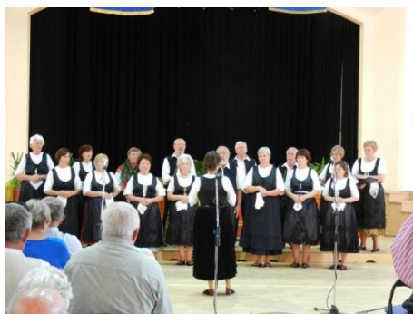
A kórustalálkozó. (10.)