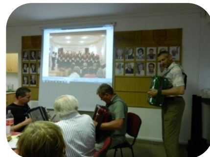
Három harmonikás adta meg a hangulatot.