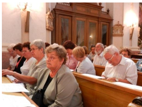
Köreműködés a német misén. (8.)