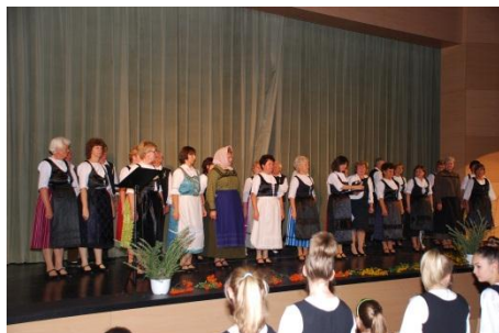
Mindenki a saját faluja viseletében.