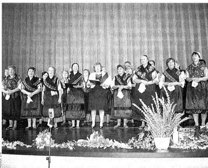
A Mondschein Kórus a jubileumi hangversenyen az Agóra Színházteremben

rendezvényein. Szoros kapcsolatot ápolnak a többi magyarországi német nemzetiségi kórusal a megyén kívül is. Számos külföldi kapcsolatuk van. Már többször elnyerték az arany fokozatot a minősítő hangversenyeken. Megkapták a Szekszárdi Németiségért nívódíjat, a 2010-ben megrendezett minősítésen kitüntetéses arany fokozatot értek el. Nemzetközi ezüst minősítést kapott a kórus a XIII. Budapesti Nemzetközi Kórusversenyen 2011-ben. Nemrégiben tartották meg nagy sikerrel, a kassai, zombai és tolnai kórusok részvételével jubileumi hangversenyüket a Babits kulturális központ színháztermében. ■ I. I.