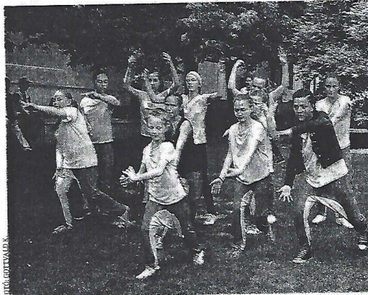
A bátaszéki Best Street Team is bemutatkozott a Nyáryitó bulin

SZEKSZÁRD Ugyan nem a szokásos helyen, de a szokásos hevülettel köszöntötték a nyarat a fiatalok Szekszárdon. A Polip iroda hagyományos rendezvényét ezúttal a Béla király téren tartotta több szervezet együttműködésével, melyek az úgynevezett „Mini civilláda” elnevezésű programban mutatkoztak be. Így miközben az Új Nemzedék Kontaktpont Iroda tagjai egy agyturkáló gép segítségével, illetve komolyan is segítettek a pályaorientációban, az érdeklődő a színpadi produkciókat és a fiatalok kerékpáros ügyességi mutatványait is figyelemmel kísérbette. A rendezvény délután kettőtől estig tartott. ■ B. K.