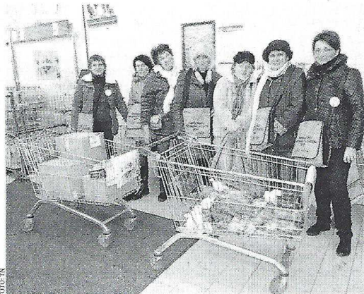
A Pennynél szépen gyűltek az adományok az önkéntesek közreműködésével

SZEKSZÁRD Jól sikerült a Magyar Élelmiszerbank Egyesület hétvégi szekszárdi adománygyűjtő akciója. Az egyesület szervezésében a Gyöngyosor Alapítvány és önkéntesei 1281 kiló élelmiszert gyűjtöttek a Béri Balogh Ádám utcai Penny Marketnél és az Arany János utcai Tesco Szupermarketnél, 273 kilogrammal többet, mint tavaly. A Gyöngyosor Alapítvány önkéntesei között voltak finn, spanyol, német és angol nemzetiségű cserediákok is, a Polip Egyesület jóvoltából. Az akcióban a Baka István Általános Iskola diákjainak, időseknek, betegeknek és krízishelyzetben lévőknek gyűjtöttek. ■ I. I.