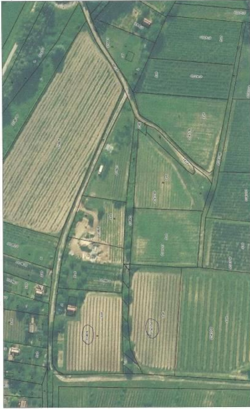
2016.10.20, Szekszárd, M = 1:1500