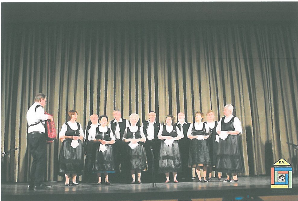
Szekszárd, 2017. 02. 18. Gyermeksvábbál, Szekszárdi Dienes Valéria Általános Iskola Grundschule