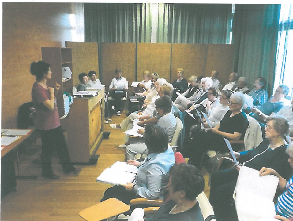
Szekszárd, 2017. 05. 11. Közösségek Hete, nyílt próba