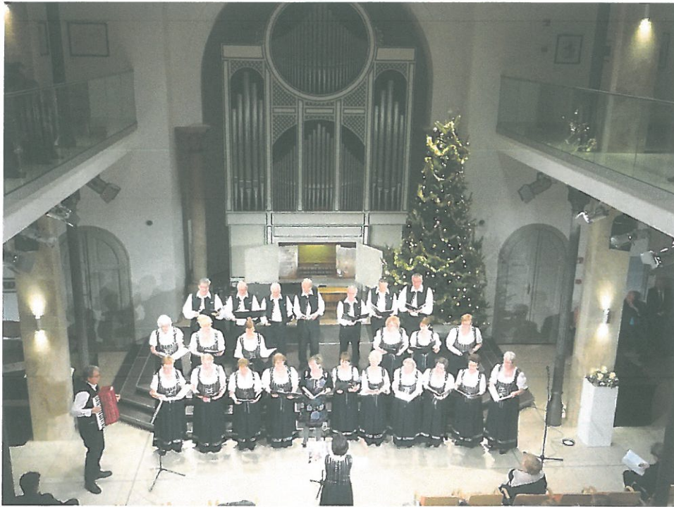
Szekszárd, 2017. 12. 17. Énekeljünk vígörmel!

„Mondschein” Szekszárdi Német Nemzetiségi Kórus Egyesület 7100 Szekszárd, Hrabovszky utca 10. Tel.:30/ 58-68-223 (délután) www.mondscheinchor.hu