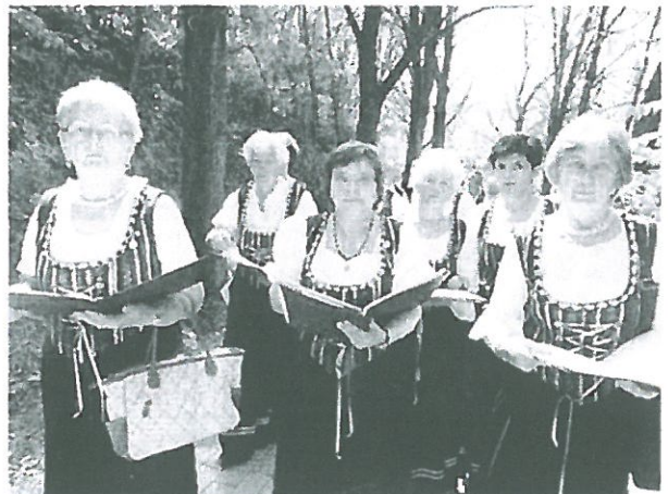
A Mondschein nemrég Baranyában, Máriagyúdon lépett fel