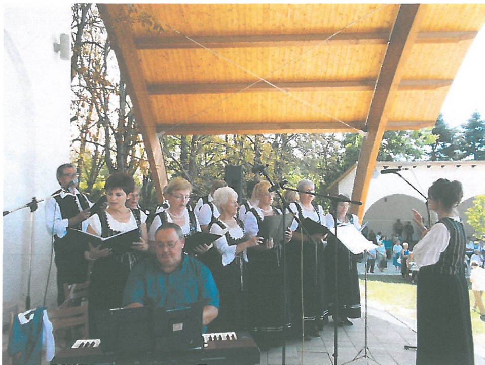
Máriagyúd, 2017. 09. 10. Magyarországi Németek főbúcsúja, Szentmise és körmenet, élő rádióközvetítés