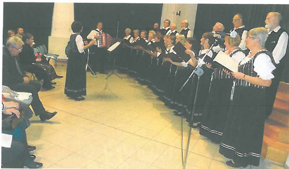
Szekszárd, 2017. 12. 08. Német Nemzetiségi Gálaműsor