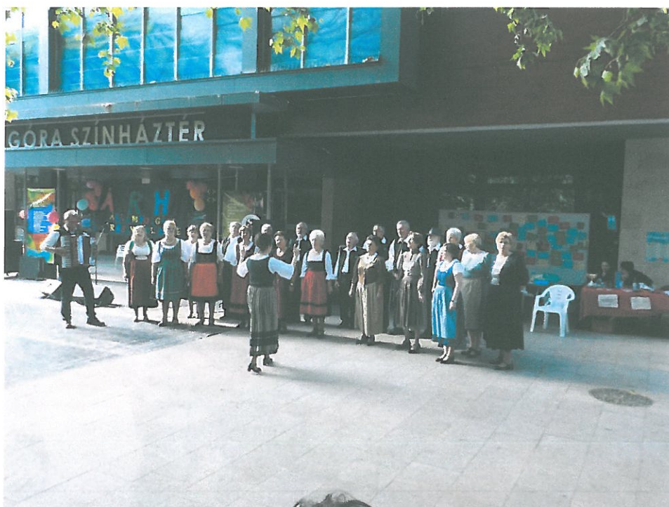
Szekszárd, 2017. 05. 25. Állampolgári Részvétel Hete, díjátadó