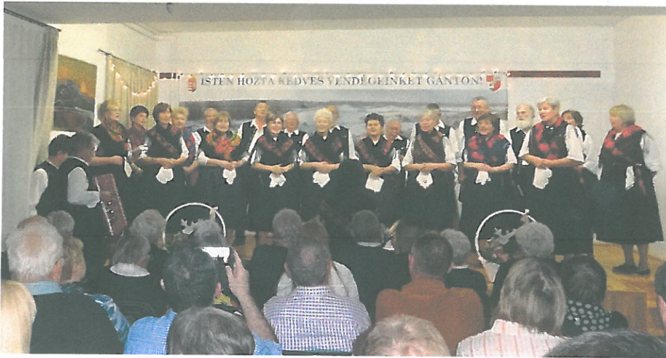
Gánt, 2017. 11. 18. Német Nemzetiségi Dalostalálkozó