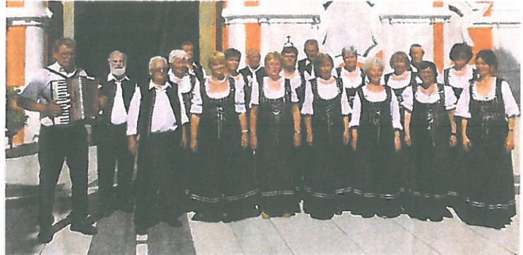
A Mondschein kórus a máriagyúdi katolikus templomnál