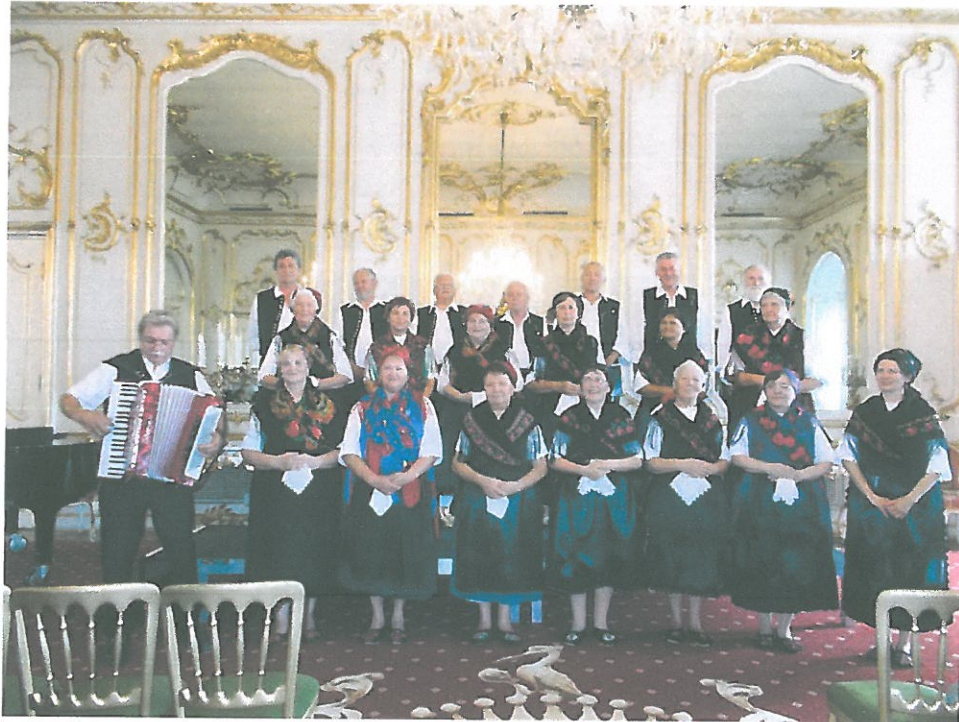
Keszthely, 2017. 07. 23. Helikon Kastélymúzeum, tükörterem