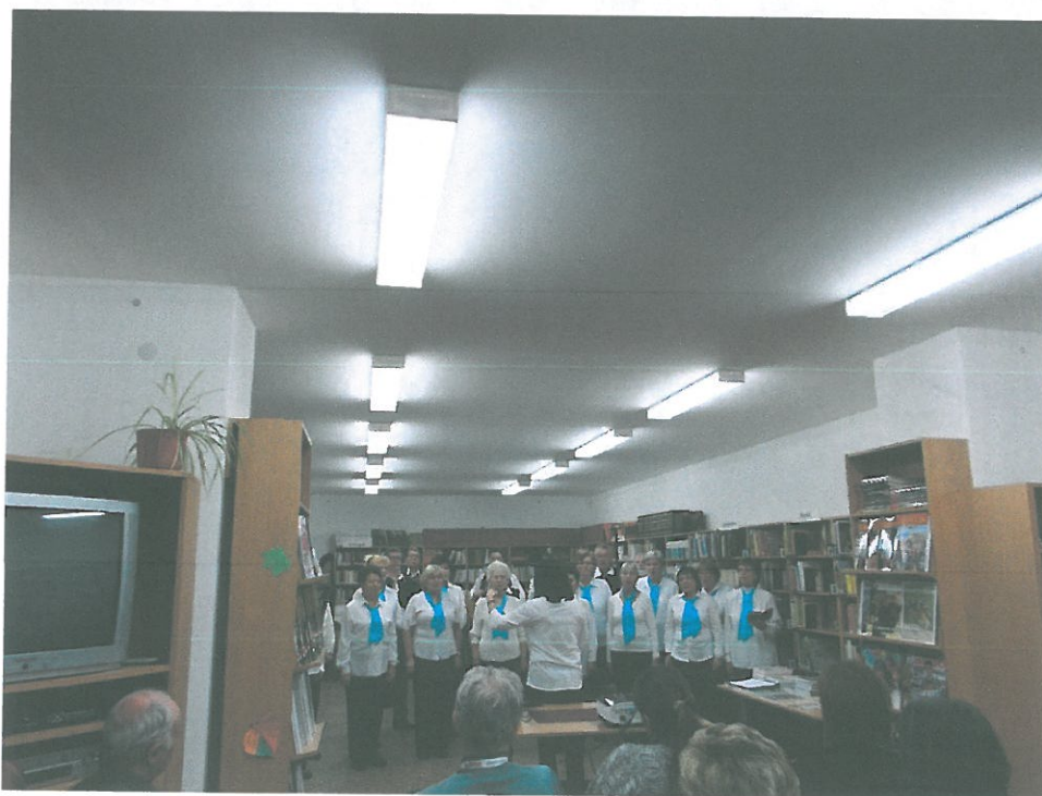
Tevel, 2017. 01. 22.

Magyarok a Szovjetúnió táborában, templomi hangverseny és kiállításmegnyitó