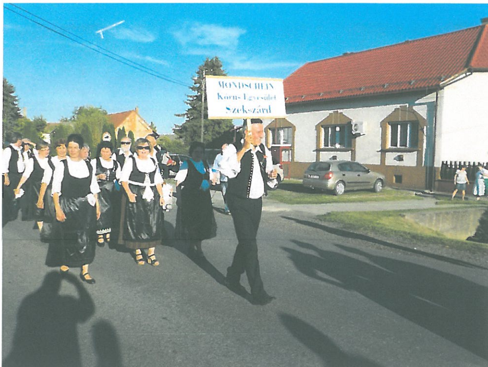
Hajós, 2017. 07. 29. Népviselő Napja, felvonulás