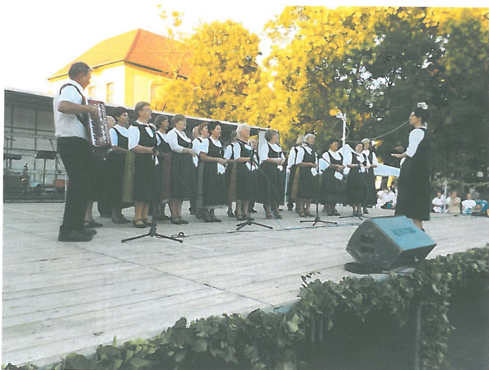
Hajós, 2017. 07. 29. Népviselő Napja