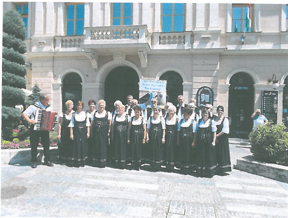
Keszthely, 2017. 07. 24. Goldmark Károly Művelődési Központ, sétálókoncert