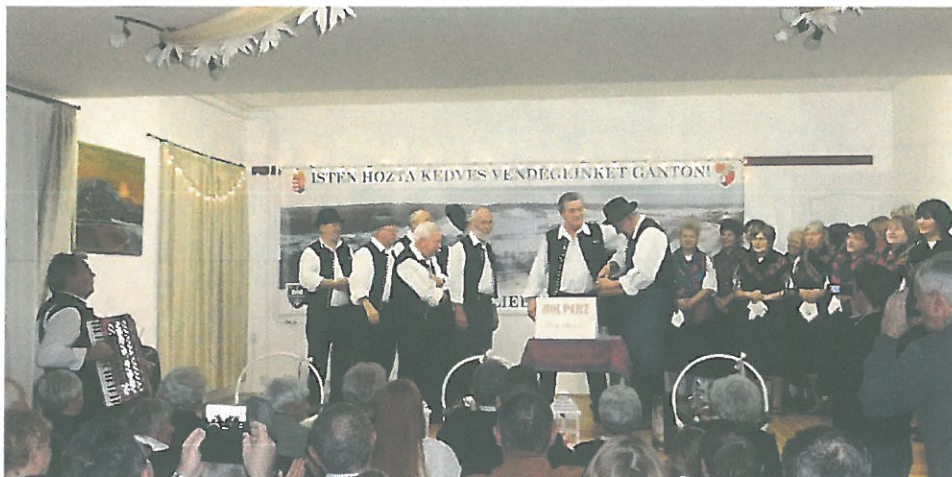
Gánt, 2017. 11. 18. Német Nemzetiségi Dalostalálkozó