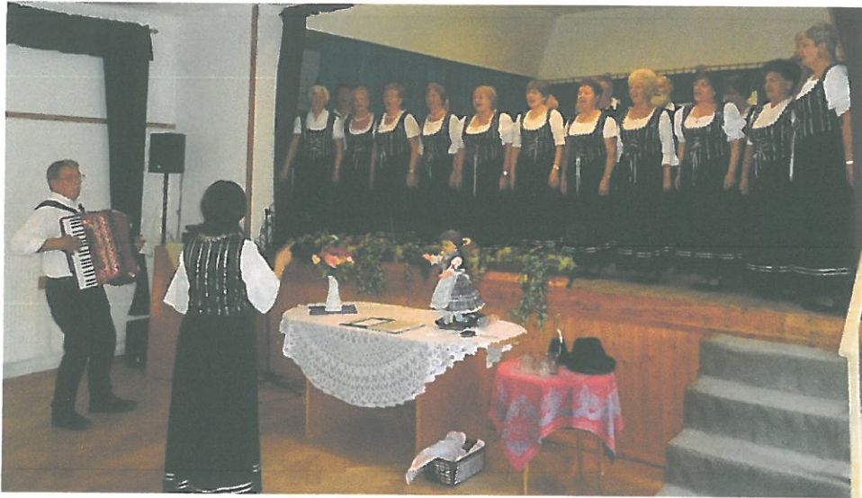
Diósberény, 2017. 10. 21. X. Jubileumi Német Nemzetiségi Nap