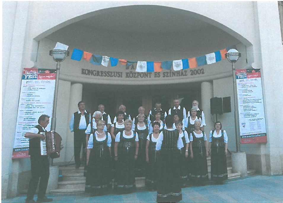
Keszthely, 2017. 07. 24. Balaton Múzeum, Kongresszusi Központ és Színház, szabadtéri színpad