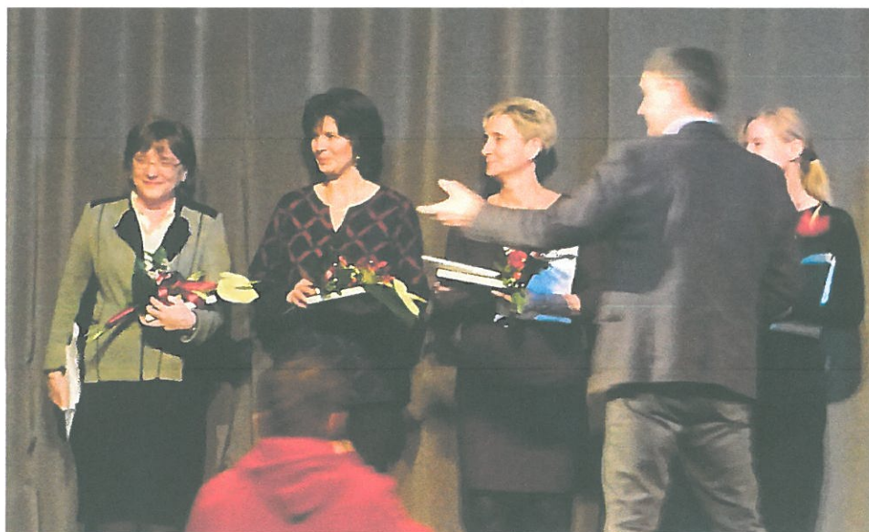
Szekszárd, 2017. 12. 07. „Szekszárd Büszkesége 2017” díjátadó ünnepség