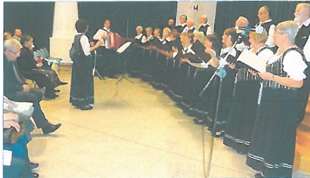
Mondschein-Chor ist „Stolz von Sepsárd 2017“

„Mondschein“ Deutscher Nationalitätenchor erhielt Auszeichnung von der Stadt Sepsárd