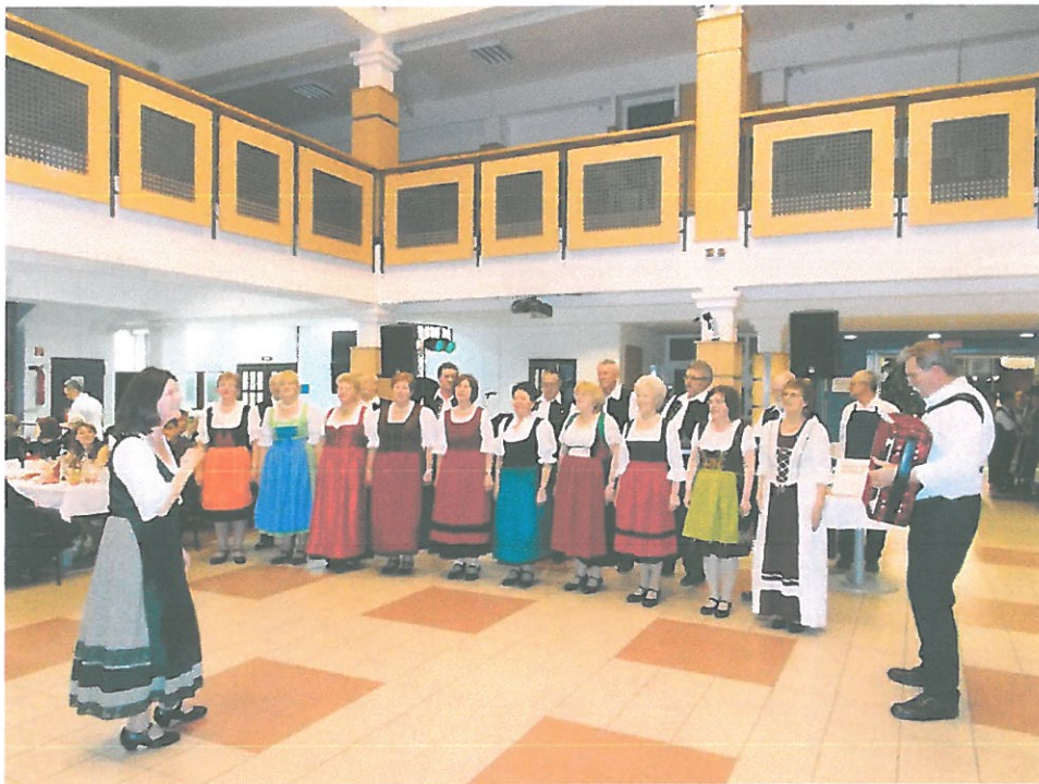
Szekszárd, 2017. 02. 11. Svábbál