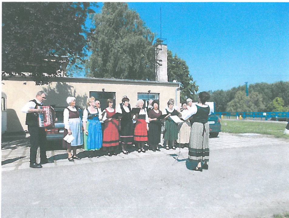
Szekszárd, 2017. 05. 14. 1. Nepomuki emléknap