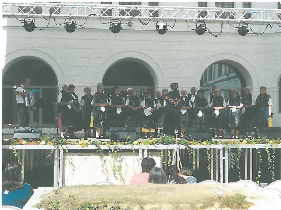
Szekszárd, 2017. 09. 16. 5. Jubileumi Szüreti Német Nemzetiségi Kórustalálkozó