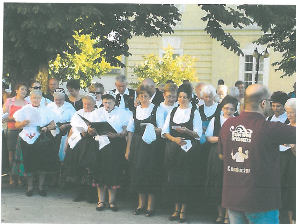
Hajós, 2017. 07. 29. Népviselő Napja, éneklés a Mária-kegyszobor előtt