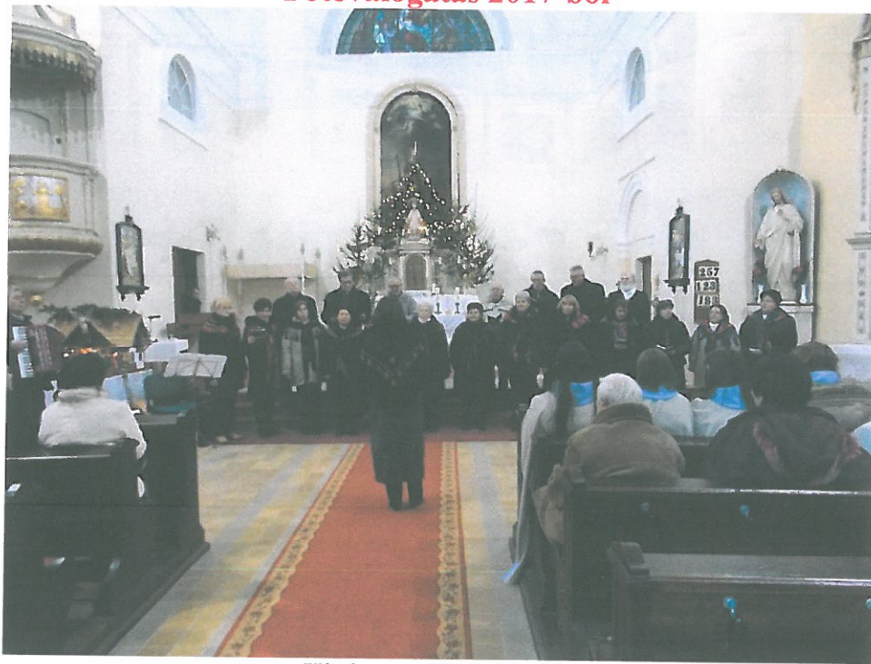
Kisdorog, 2017. 01. 21.

Magyarok a Szovjetúnió táborában, templomi hangverseny és kiállításmegnyitó