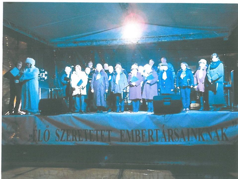
Szekszárd, 2017. 12. 14. Élő szeretetet embertársainknak!