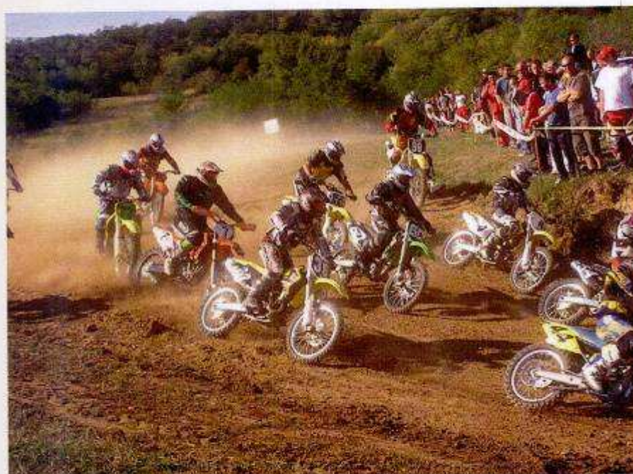
Országos meghívásos verseny 2006 Szekszárd-Szőlőhegy