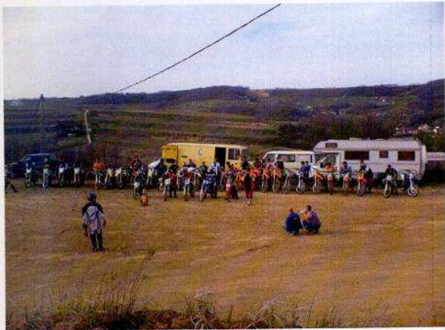
Egy tavaszi edzés Szekszárd-Szőlőhegyen 2006-ban