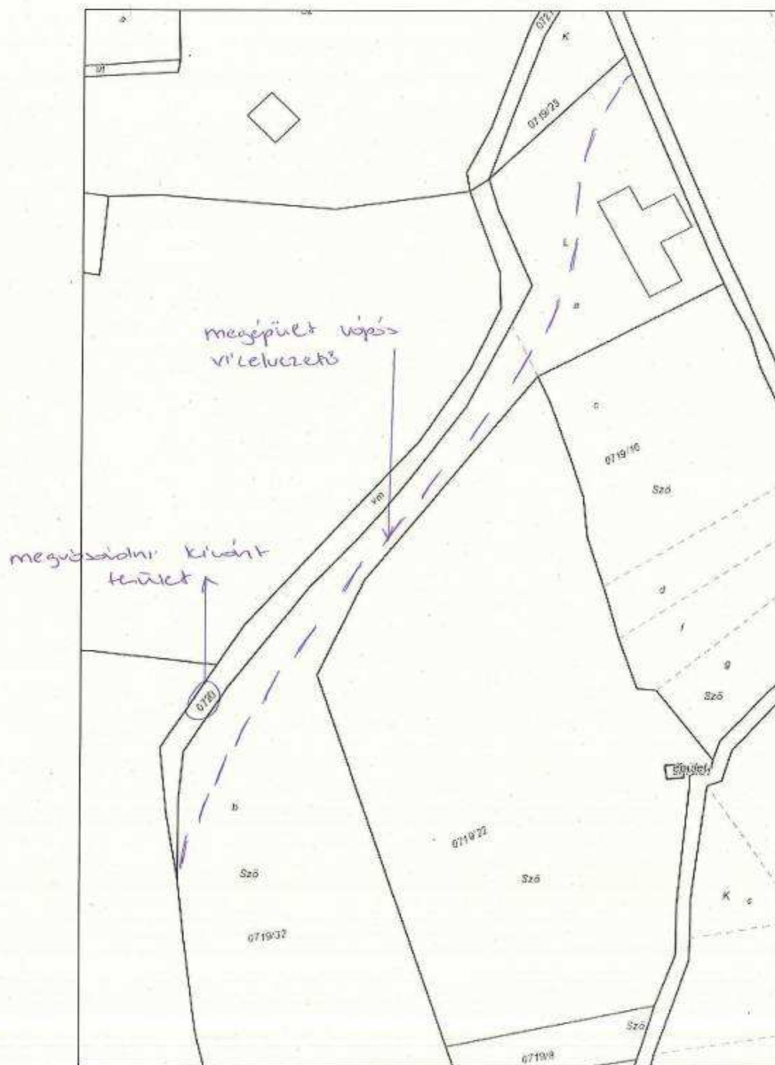
2013.8.30, Szekszárd, M = 1:1200