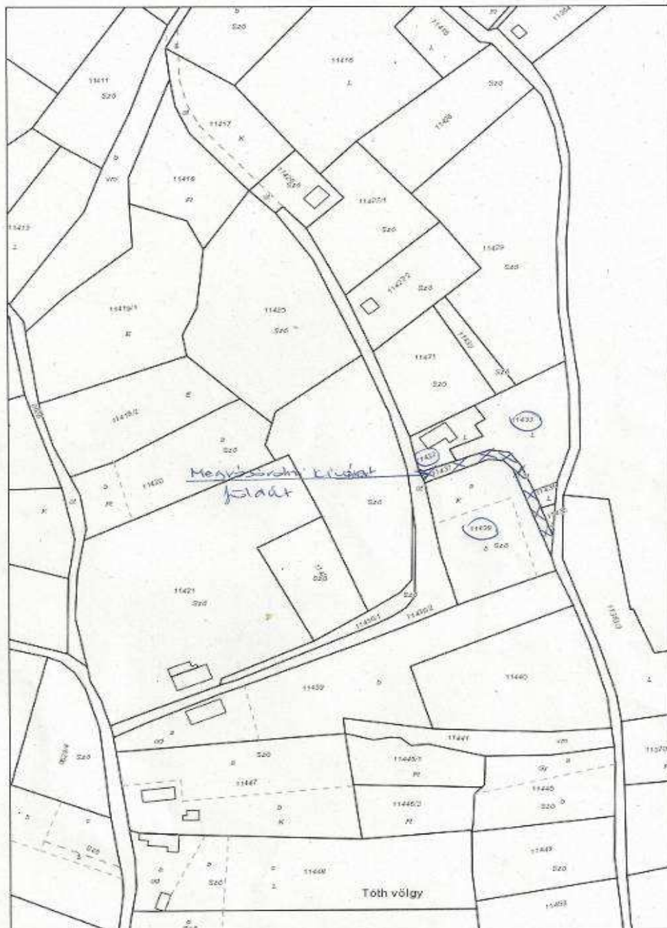
2013.10.9. Szekszárd, M = 1:1500