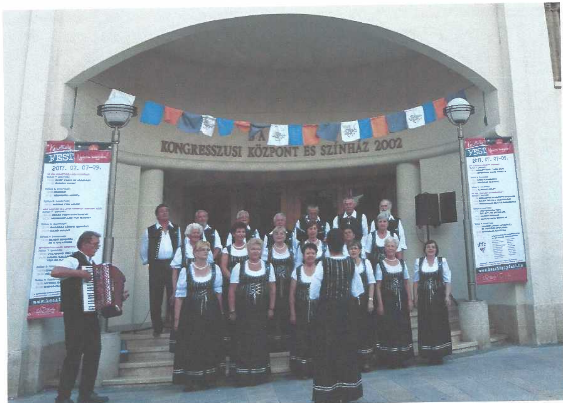
Keszthely, 2017. 07. 24. Balaton Múzeum, Kongresszusi Központ és Színház, szabadtéri színpad