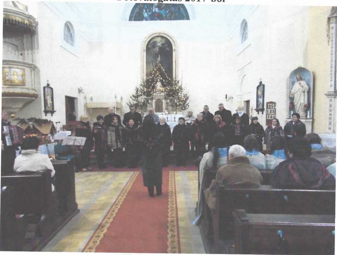
Kisdorog, 2017. 01. 21. Magyarok a Szovjetúnió táborában, templomi hangverseny és kiállításmegnyitó