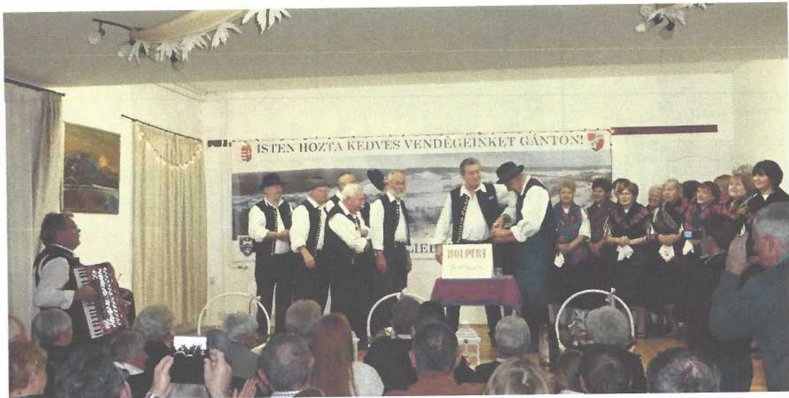
Gánt, 2017. 11. 18. Német Nemzetiségi Dalostalálkozó