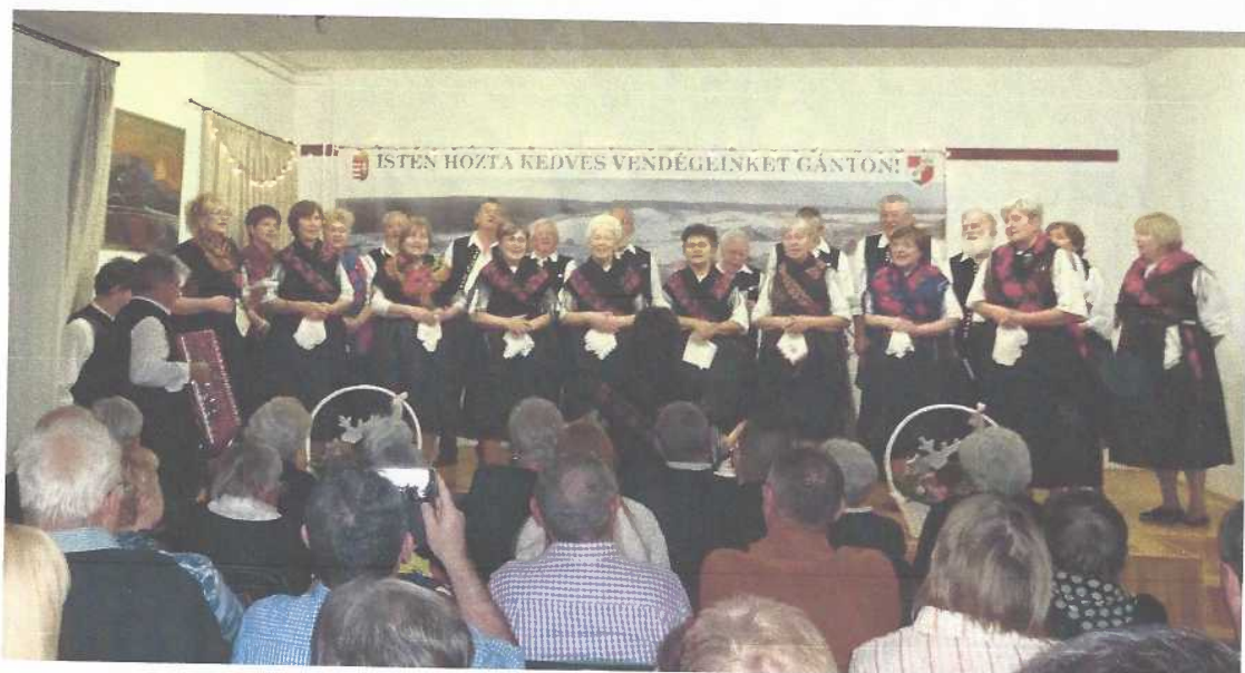
Gánt, 2017. 11. 18. Német Nemzetiségi Dalostalálkozó