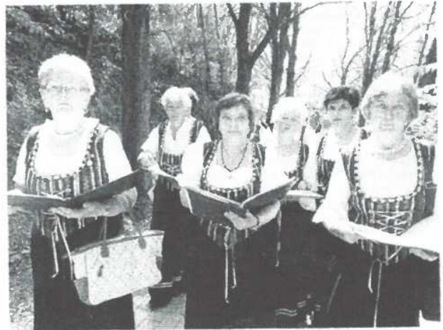
A Mondschein nemrég Baranyában, Máriagyúdon lépett fel