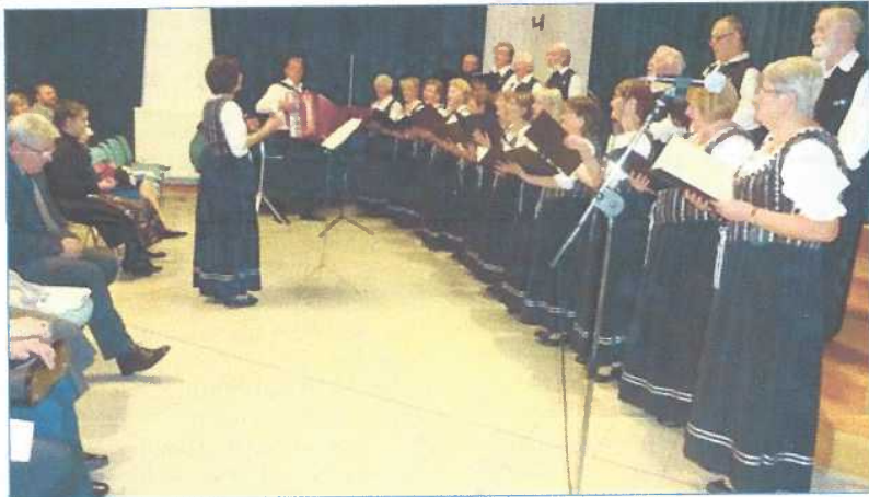
Mondschein-Chor ist „Stolz von Sepsard 2017“

„Mondschein“ Deutscher Nationalitätenchor erhielt Auszeichnung von der Stadt Sepsard