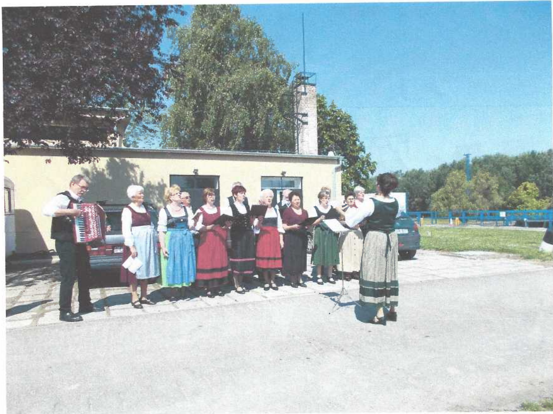
Szekszárd, 2017. 05. 14. 1. Nepomuki emléknep