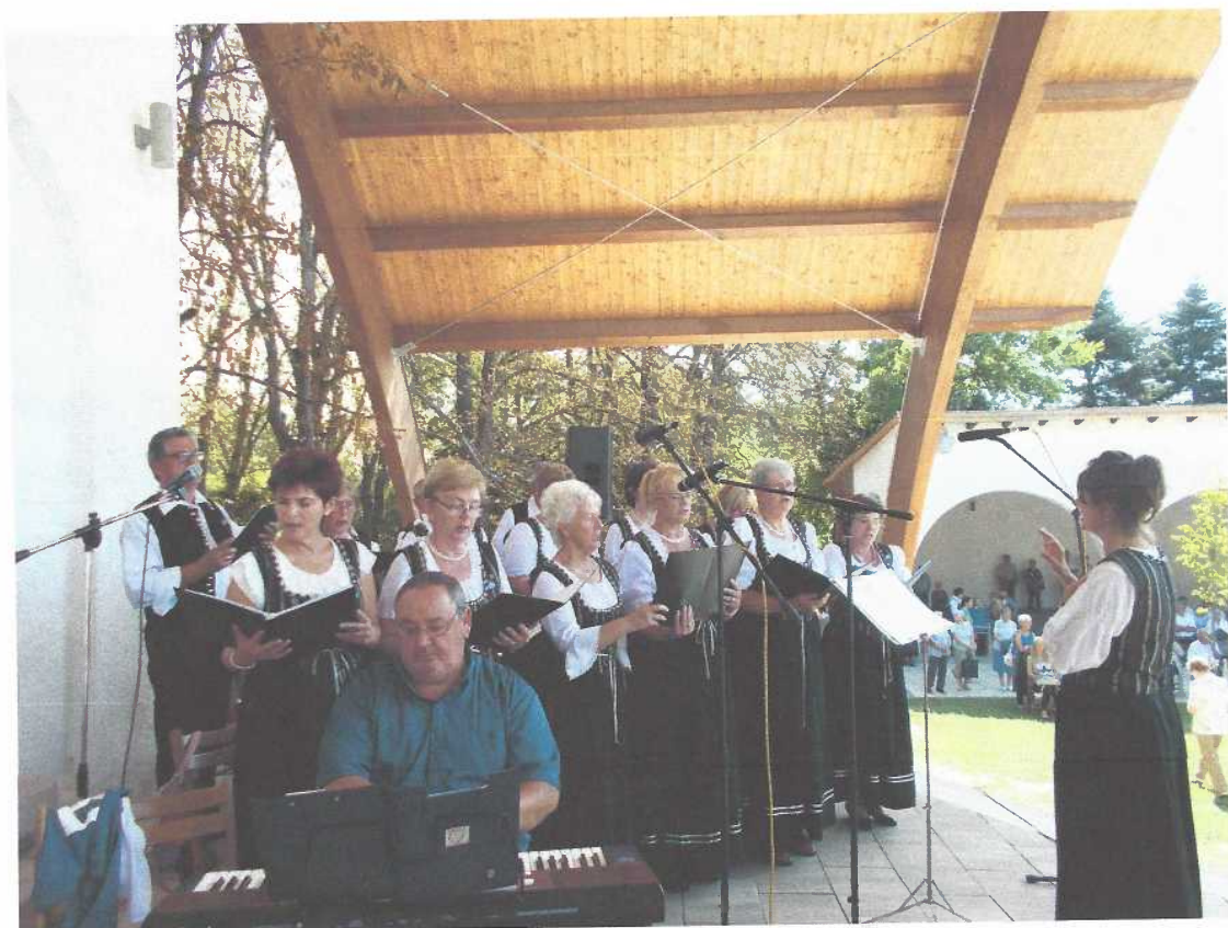
Máriagyúd, 2017. 09. 10. Magyarországi Németek főbúcsúja, Szentmise és körmenet, élő rádióközvetítés