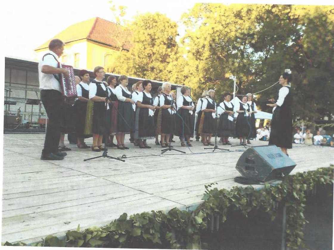
Hajós, 2017. 07. 29. Népviselet Napja