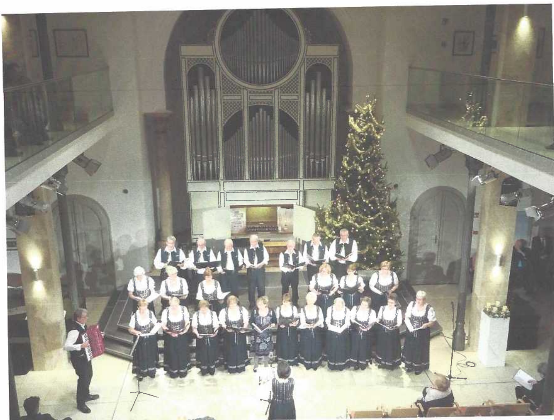
Szekszárd, 2017. 12. 17. Énekeljünk vígörömmel!