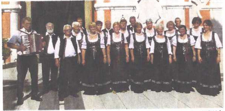
A Mondschein kórus a máriagyúdi katolikus templomnál