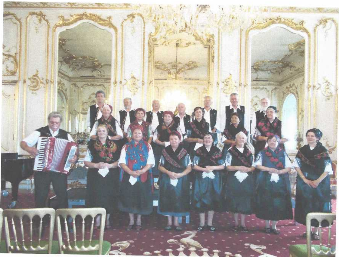
Keszthely, 2017. 07. 23. Helikon Kastélymúzeum, tükörterem