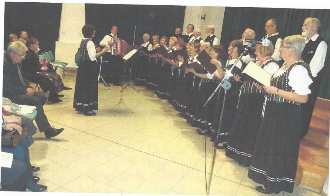
Szekszárd, 2017. 12. 08. Német Nemzetiségi Gálaműsor