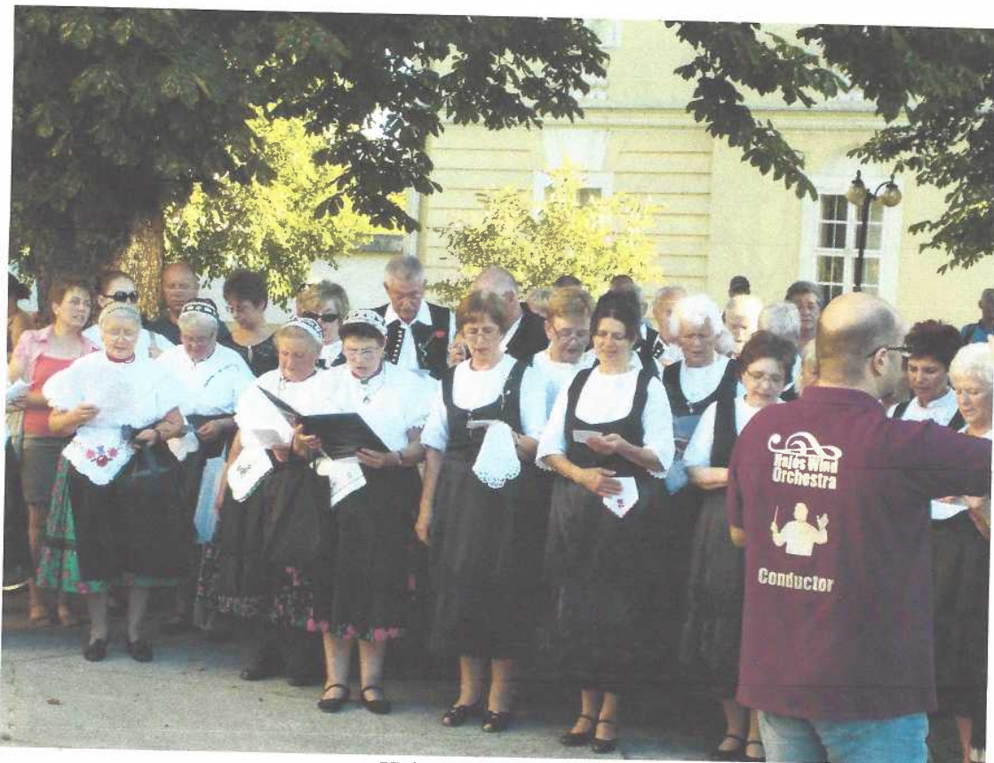
Hajós, 2017. 07. 29. Népviselet Napja, éneklés a Mária-kegyszobor előtt