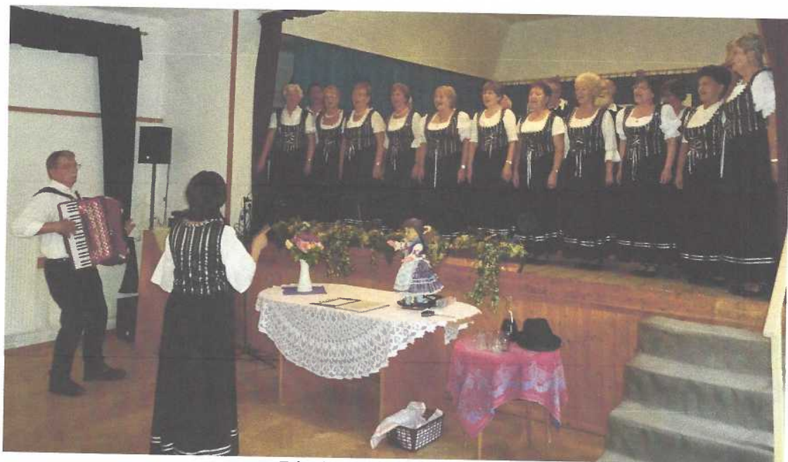
Diósberény, 2017. 10. 21. X. Jubileumi Német Nemzetiségi Nap