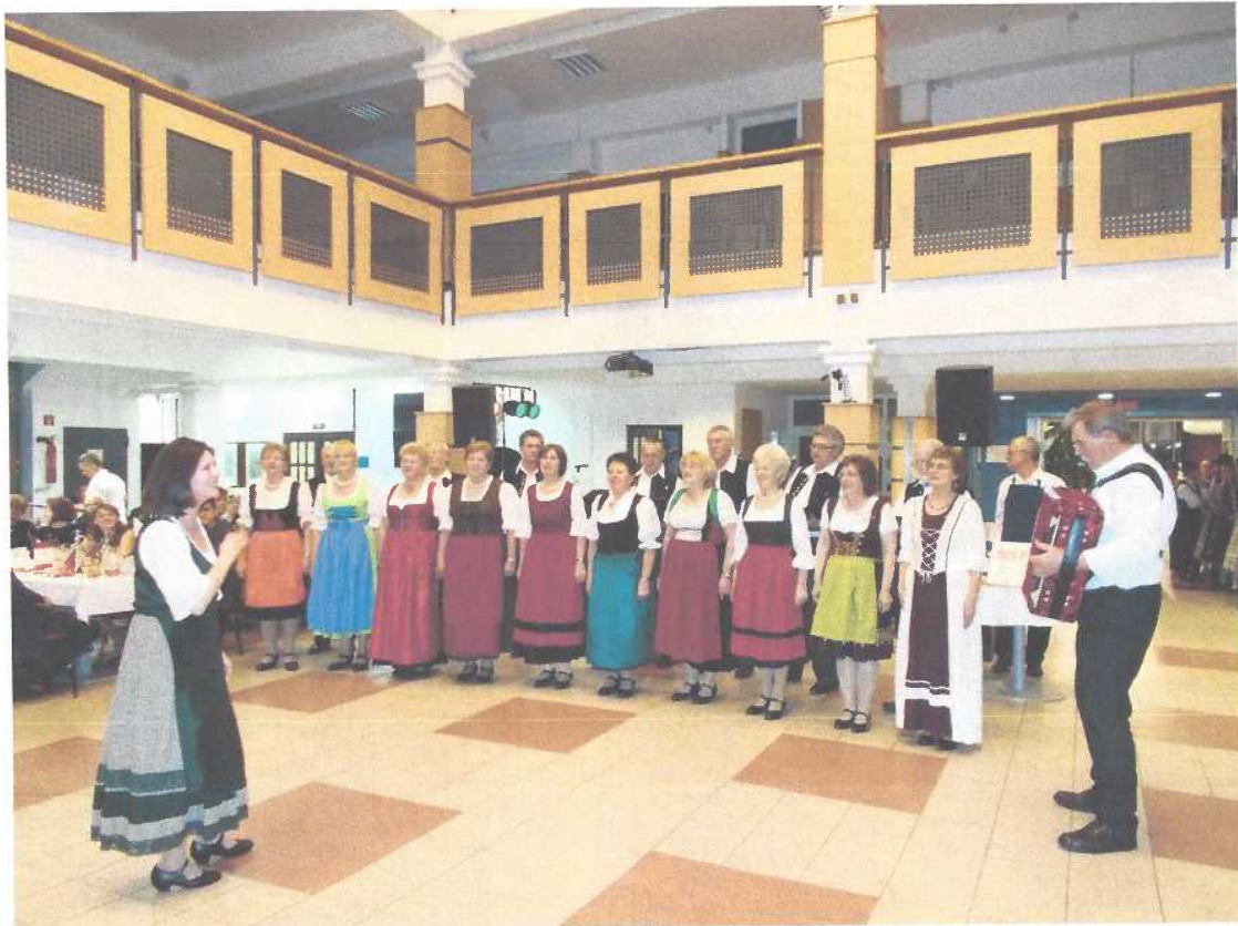
Szekszárd, 2017. 02. 11. Svábbál