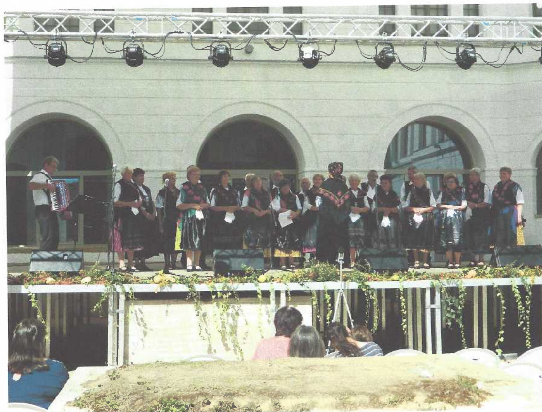
Szekszárd, 2017. 09. 16. 5. Jubileumi Szüreti Német Nemzetiségi Kórustalálkozó