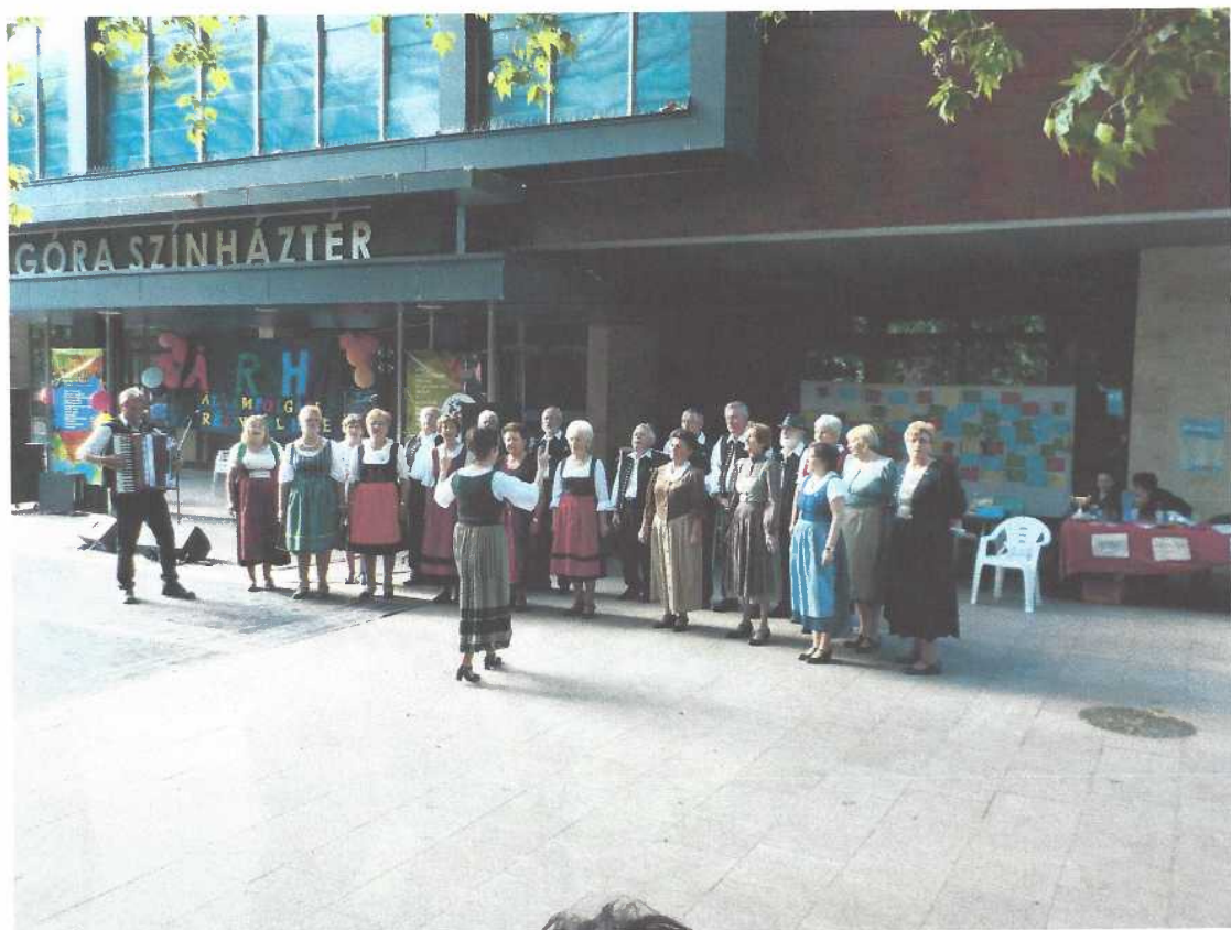
Szekszárd, 2017. 05. 25. Állampolgári Részvétel Hete, díjátadó