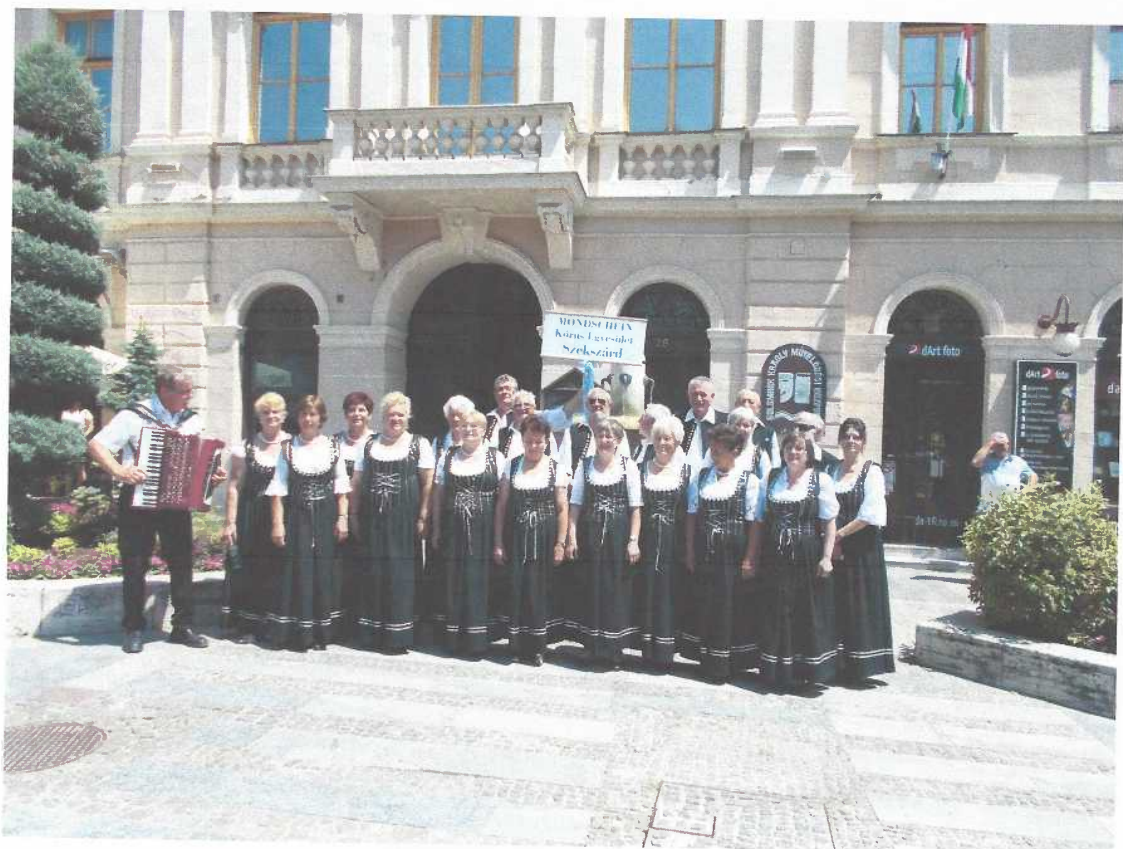
Keszthely, 2017. 07. 24. Goldmark Károly Művelődési Központ, sétálókoncert