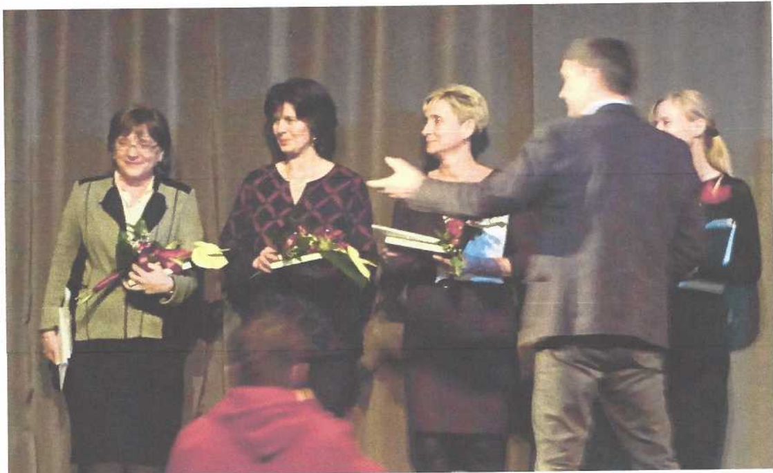
Szekszárd, 2017. 12. 07. „Szekszárd Búszkesége 2017” díjátadó ünnepség