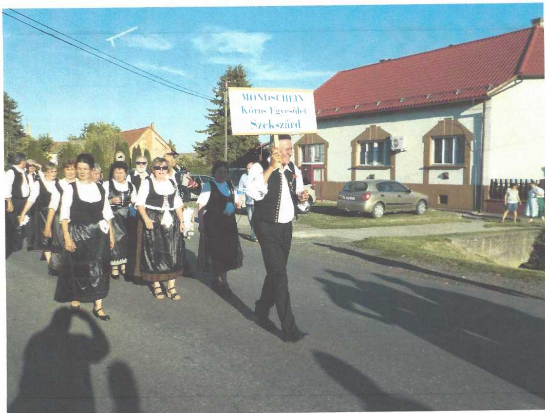
Hajós, 2017. 07. 29. Népviselő Napja, felvonulás