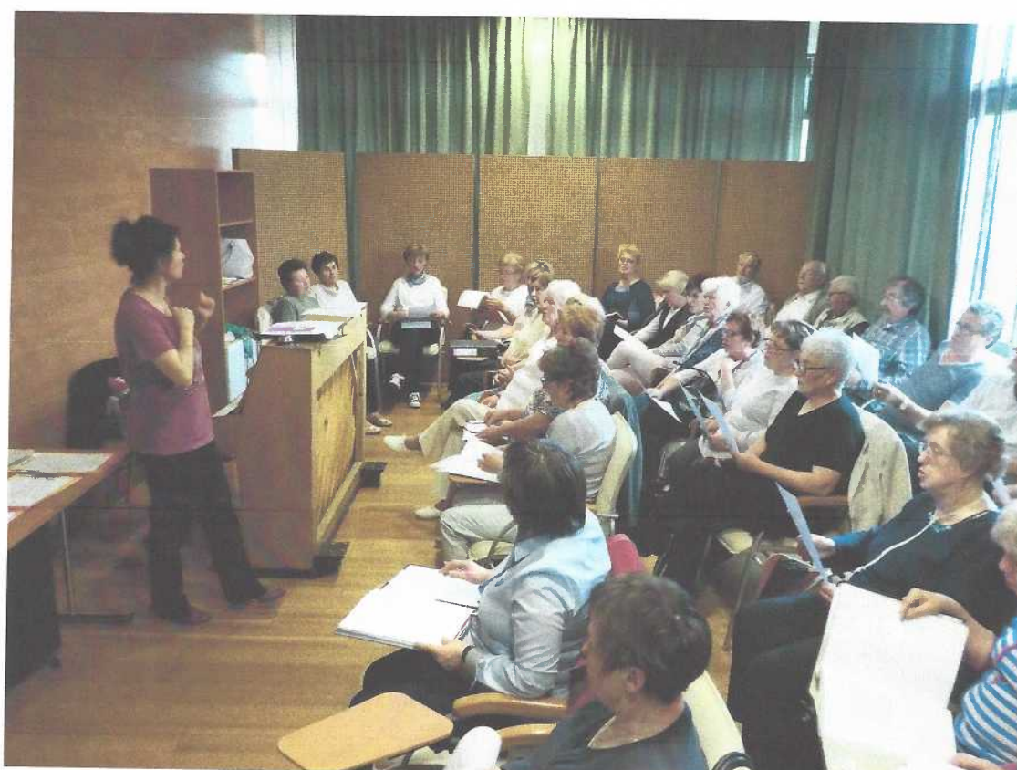
Szekszárd, 2017. 05. 11. Közösségek Hete, nyílt próba