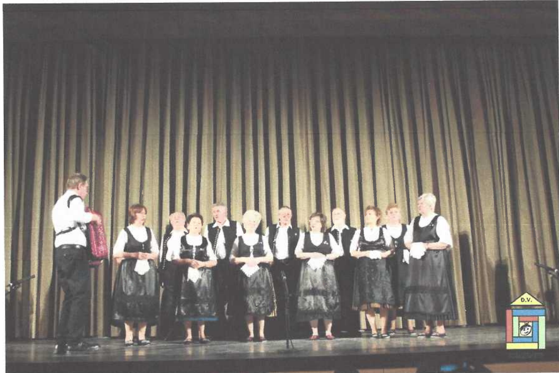
Szekszárd, 2017. 02. 18. Gyermeksvábbál, Szekszárdi Dienes Valéria Általános Iskola Grundschule