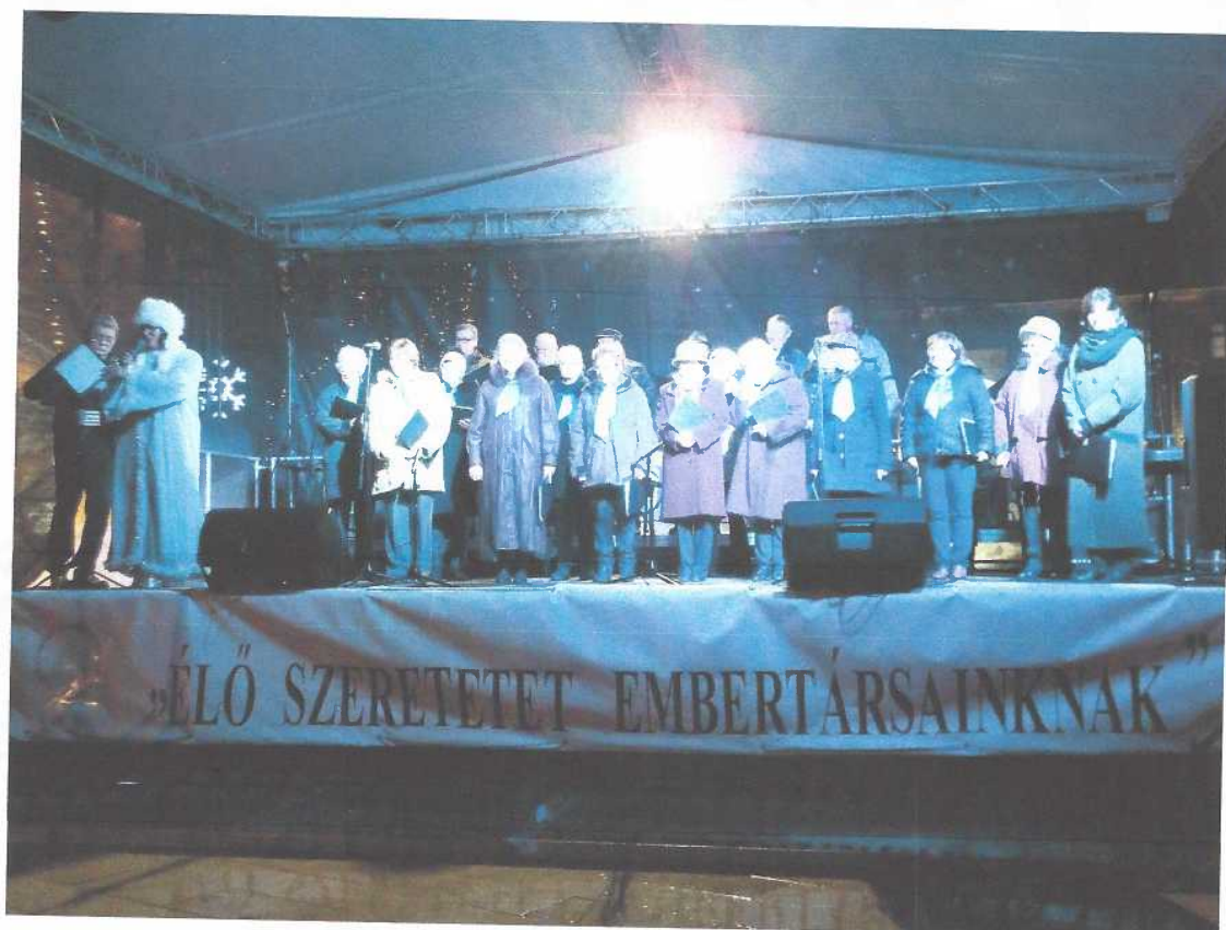
Szekszárd, 2017. 12. 14. Élő szeretetet embertársainknak!