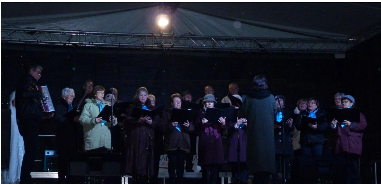
A „Mondschen” Német Nemzetiség Kórus Egyesület német adventi és karácsonyi dalokkal melegítette fel a közönség szívét