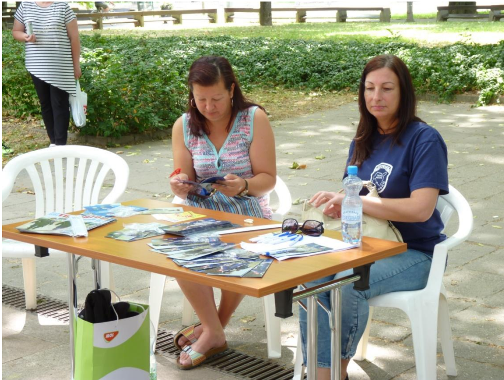
Határ Vadász toborzók az Önkéntesek Napján