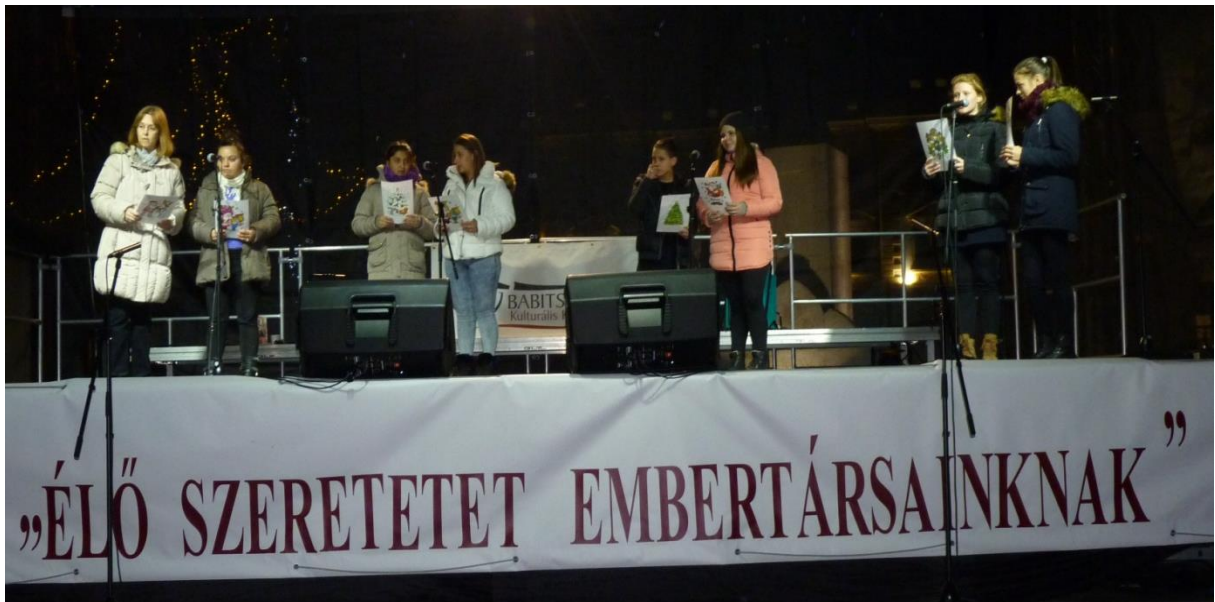
A Polip Tanoda adventi műsort ad elő