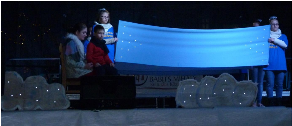
A Keresztény Nevelésért Alapítvány látványos, meghatározó műsora