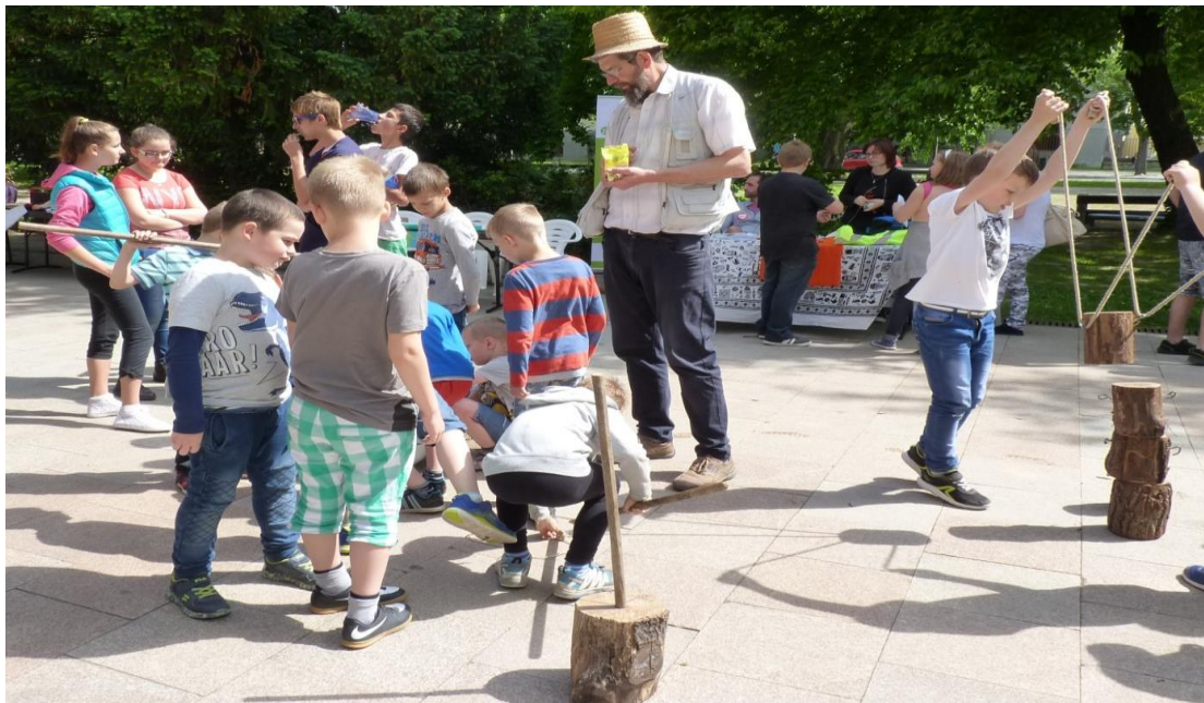
A Szent József Katolikus Általános Iskola diákjai idén is sikeresen aktivizálták játékaikkal a szekszárdiakat