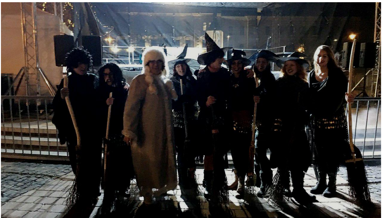
A boszorkányok, akik megmozgatták a közönséget is