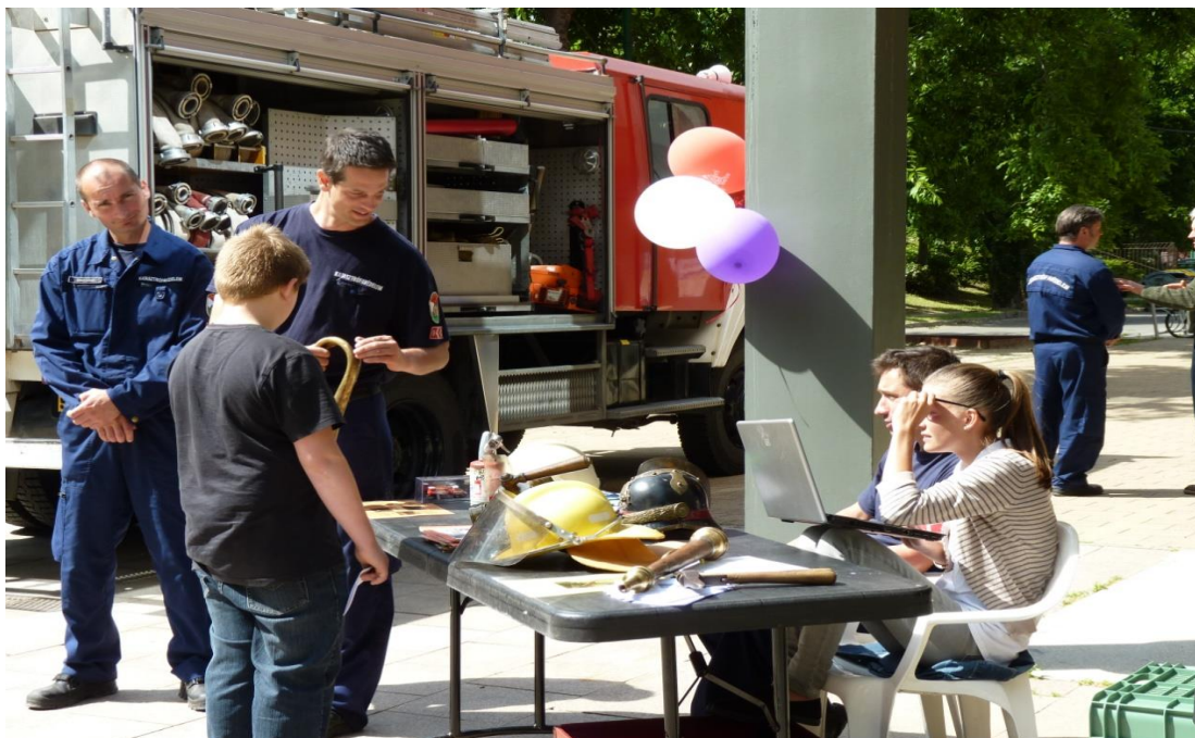
A tűzoltó parancsnokság szerbemutatója