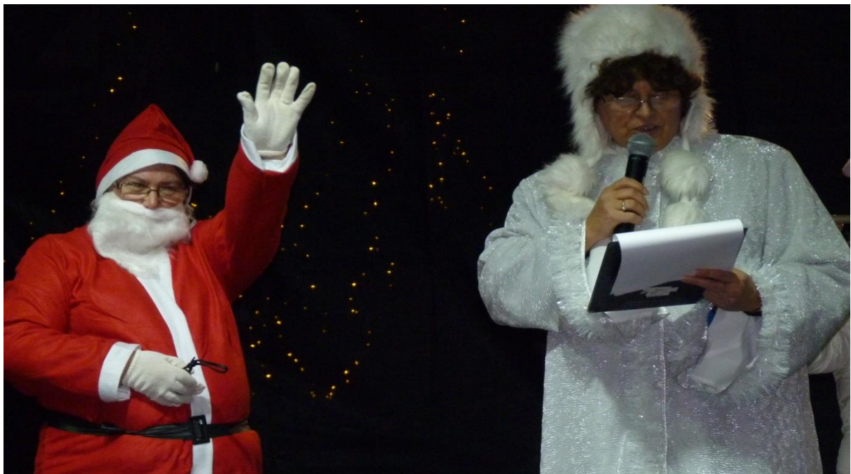
Télanzó és a Mikulás indítják a műsort