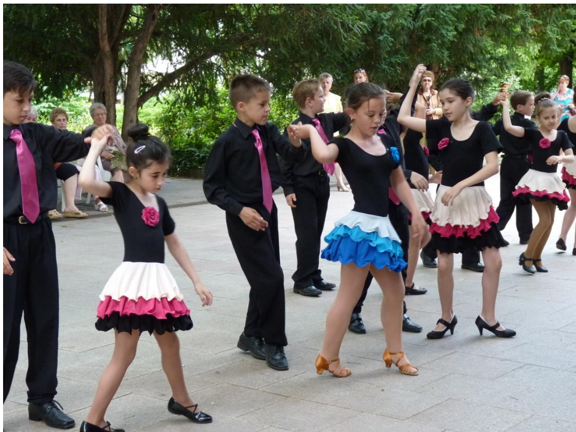
A Gemenc TáncSport Egyesület ifjú táncosai