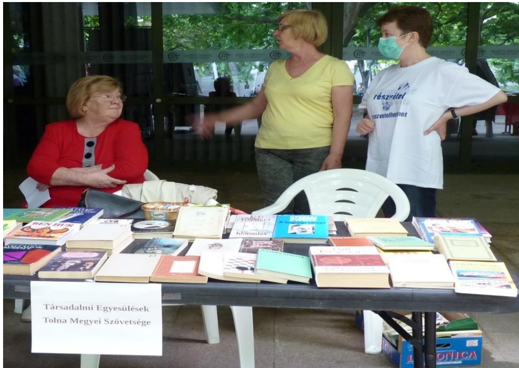
A megnyitó előtti várakozás