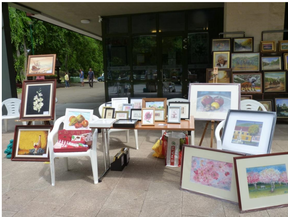
Kitelepült a Bárka Művészeti Szalon is az alkotásaival