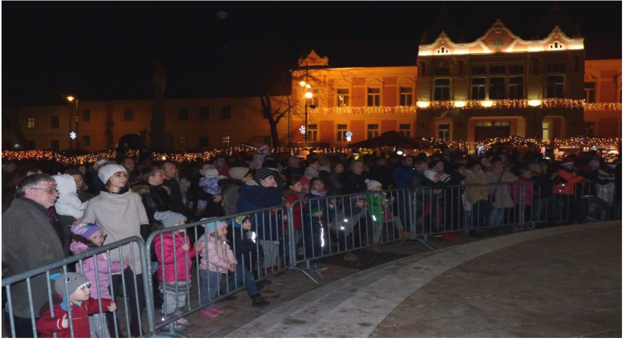
A hálás közönség