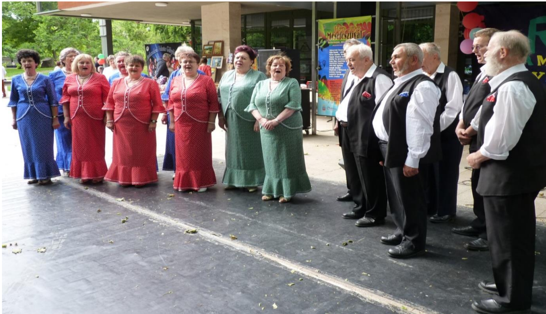
A Szekszárdi Magyaróta Klub lelkes-szíves csapata