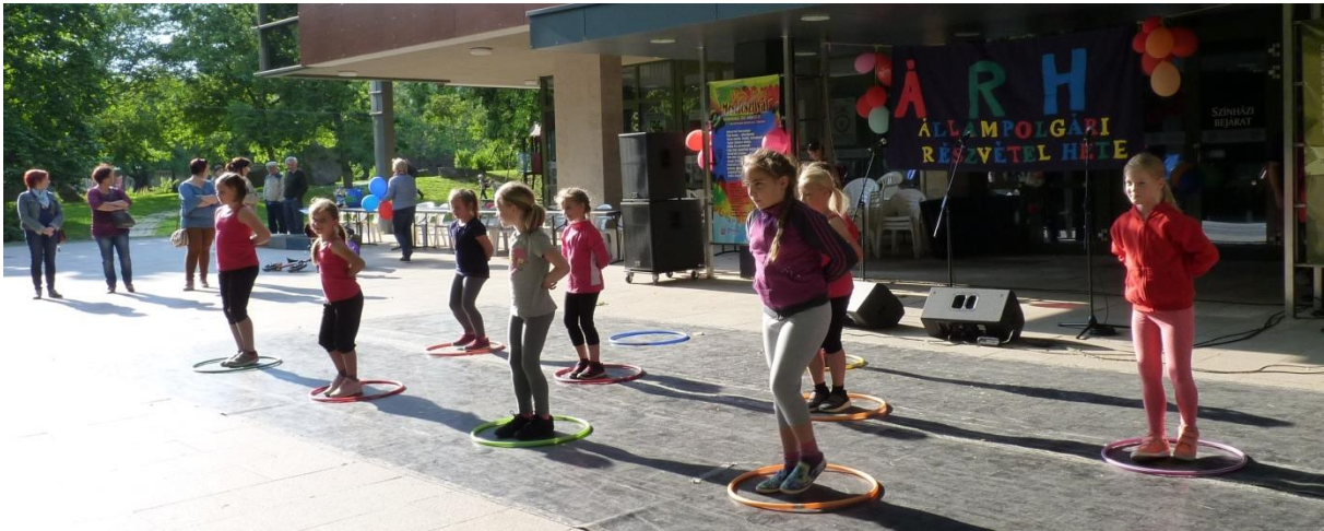
A Szekszárdi Mozgás Művészeti Stúdió (MMS) fellépése