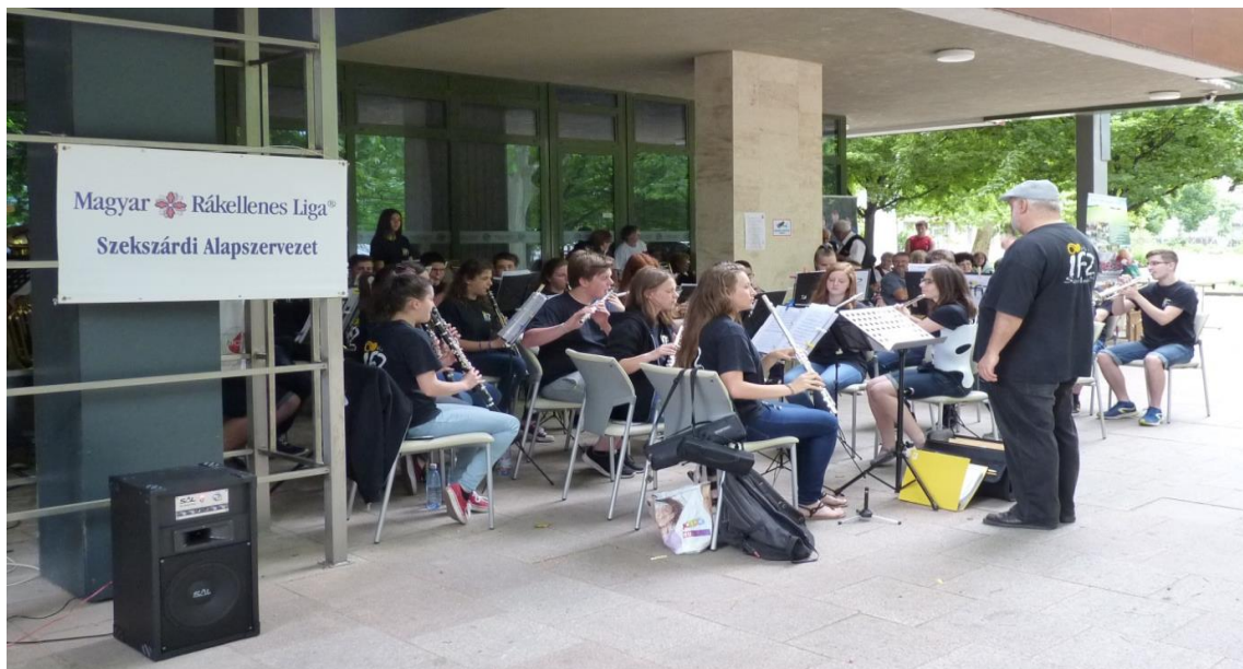
A közösségi kategória Szomjú-díjasa az Ifjúsági Fúvószenekar Szekszárd