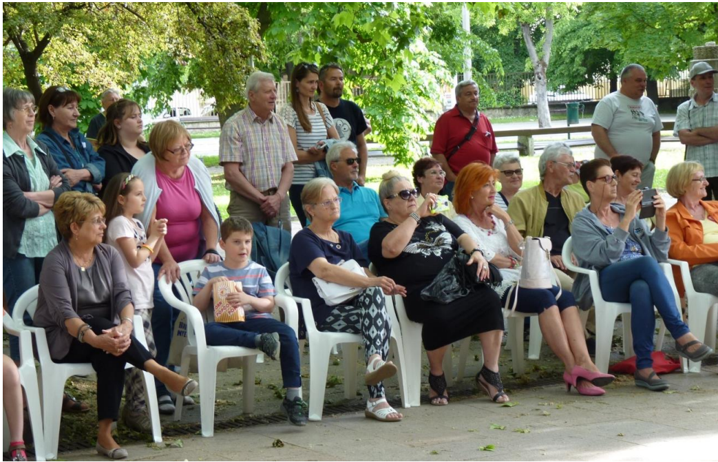
Az érdeklődő közönség