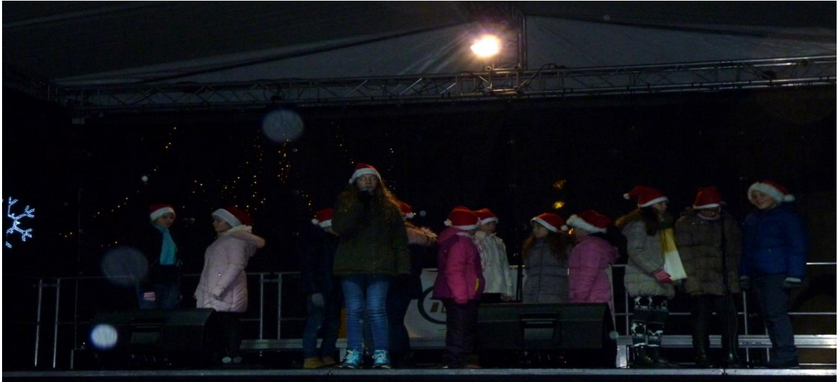
Színpadon a Tücsök Zenés Színpad utánpótlás csoportja