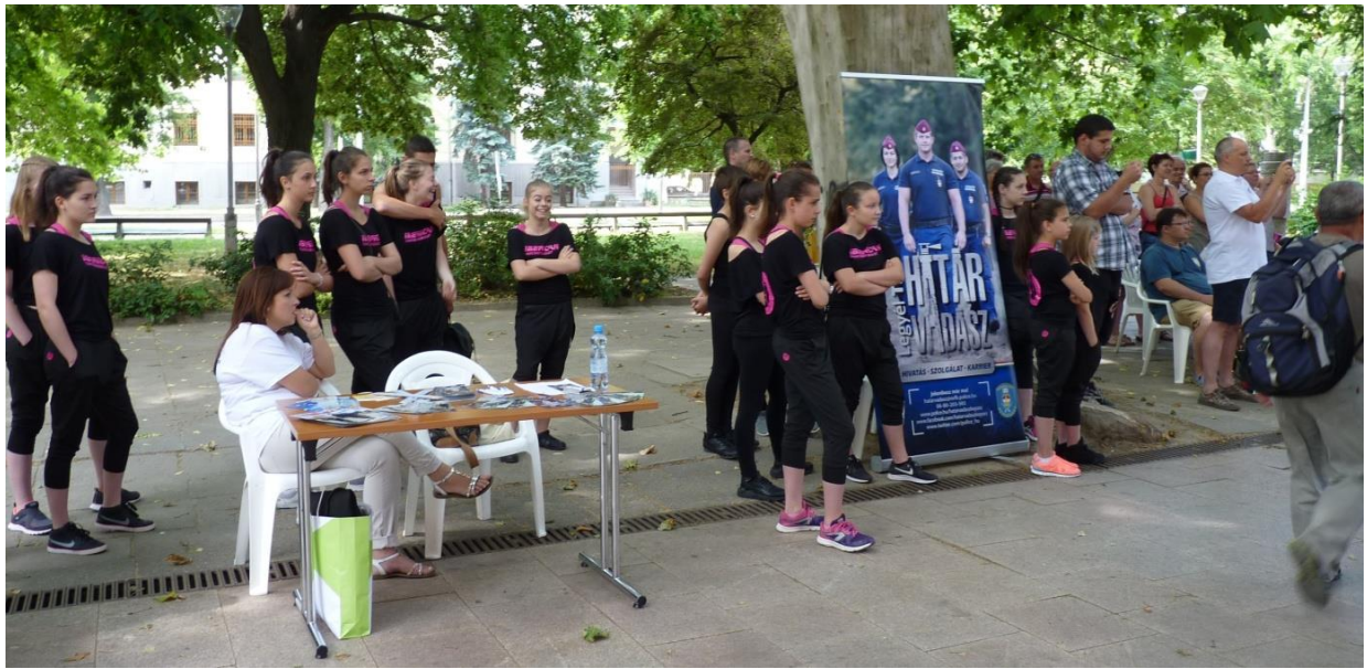
A megnyitó közönsége