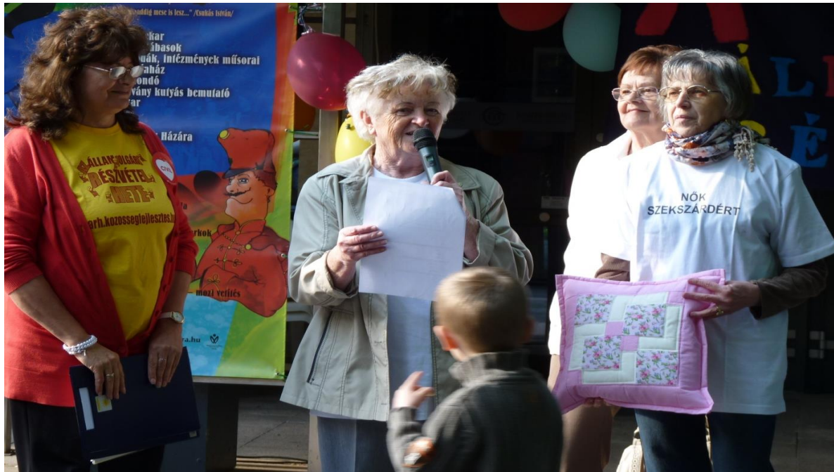
A Nők Szekszárdért Egyesület különdíjjal készült a kérdőíveiket kitöltőknek