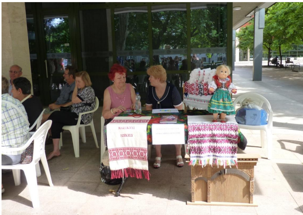
A kitelepült önkéntesek délidőben