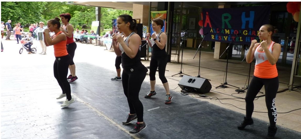
A FITT- Mix nem hagyja lankadni a figyelmet