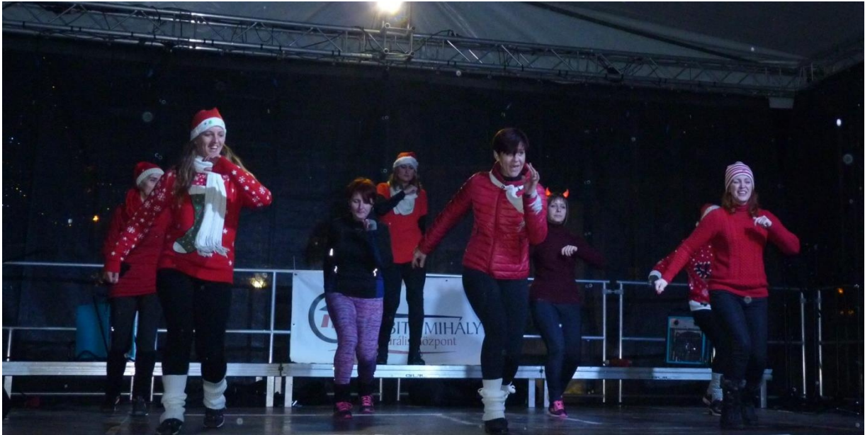
FITT Zumba karácsony