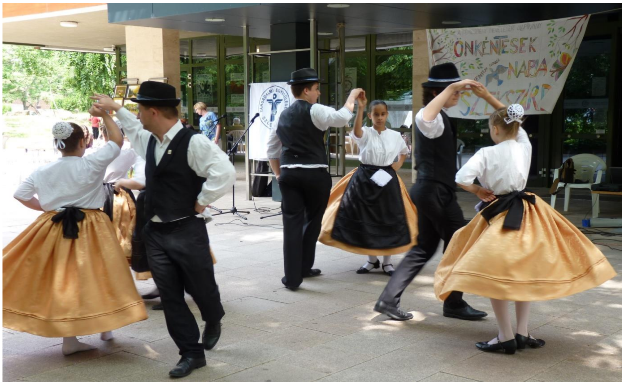
Az „Ifjúszív” Magyarországi Német Nemzetiségi Táncegyüttes ropja a táncot