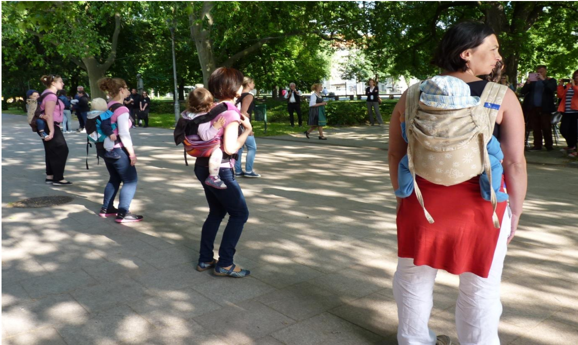
A FITT Fitnessz Hordozós Babás Tornájával a csecsemők is jelen voltak az ÁRH-n