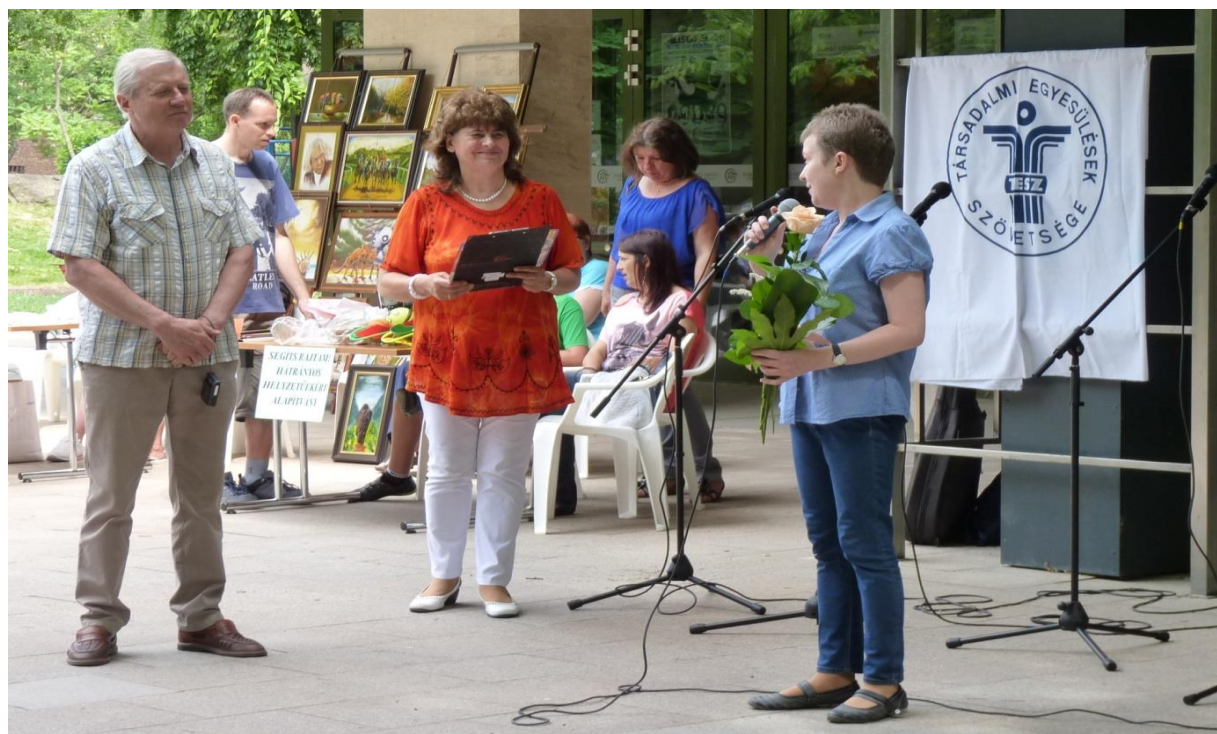
A szervezők megnyitója