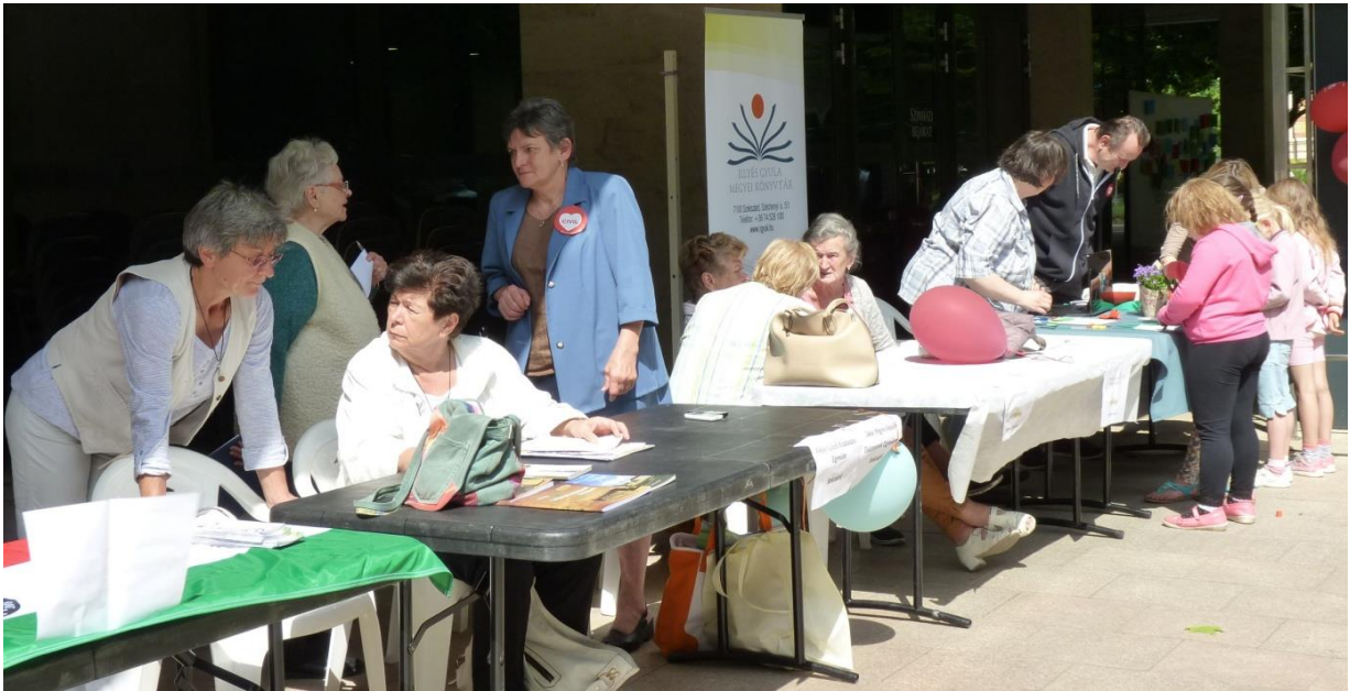
A kitelepült civil szervezetek az érdeklődők szolgálatában