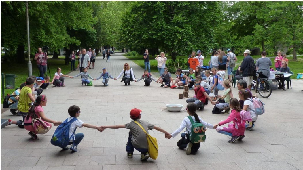
A napközisek is bekapcsolódtak az ÁRH programokba