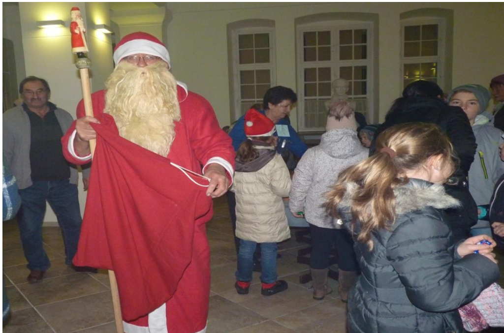
A melegedőben nagy a készülődés