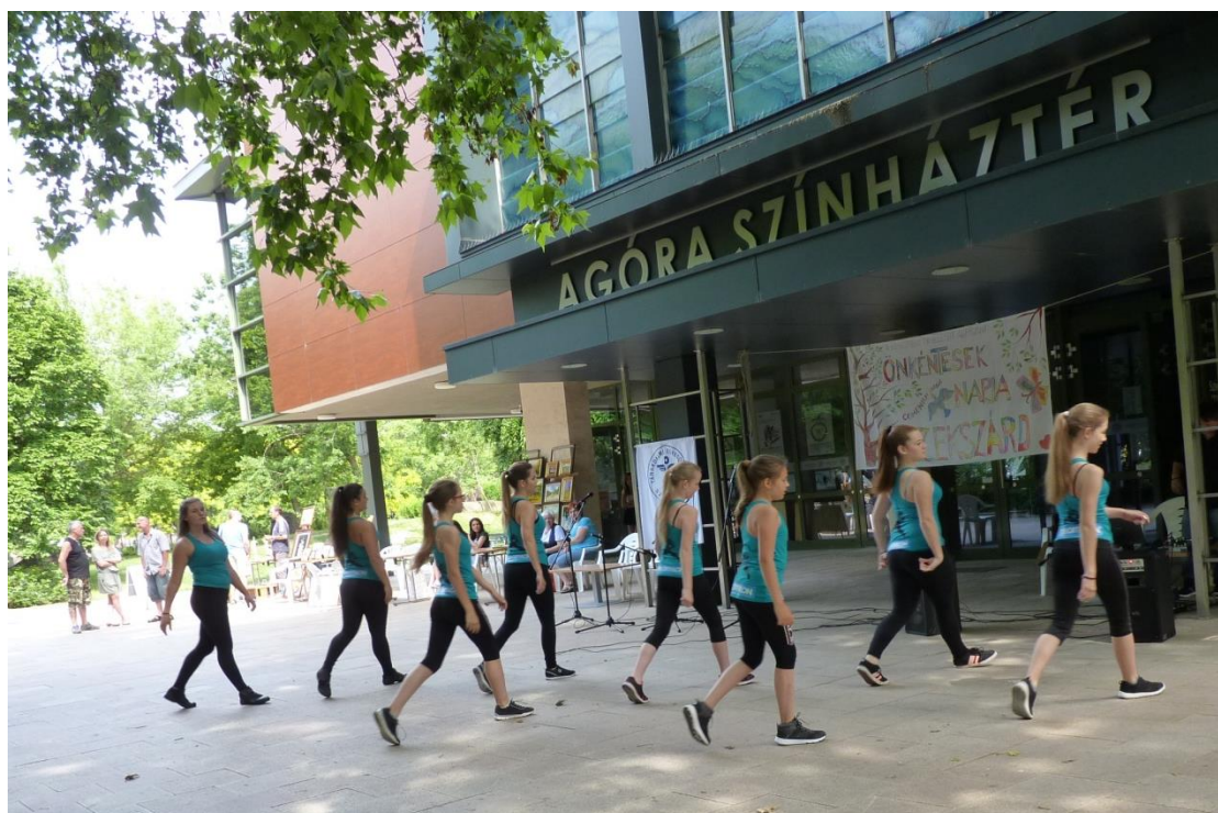
A Mozduljunk Együtt Szekszárdért Egyesület napindító tánca