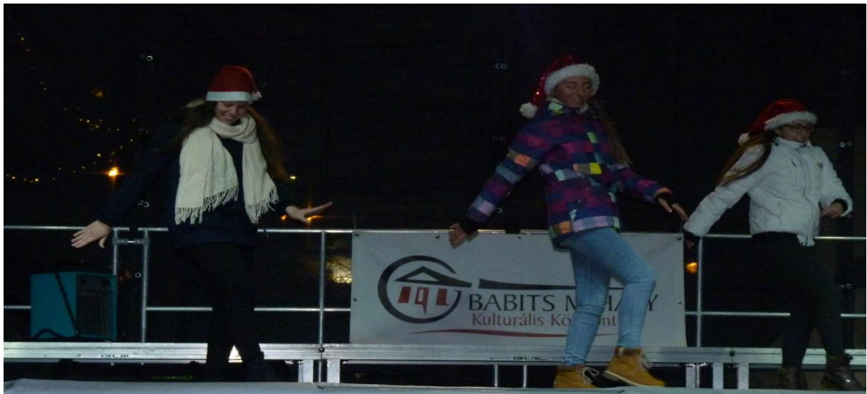
Táncos karácsonyváró a Szekszárdi Mozgásművészeti Stúdióval