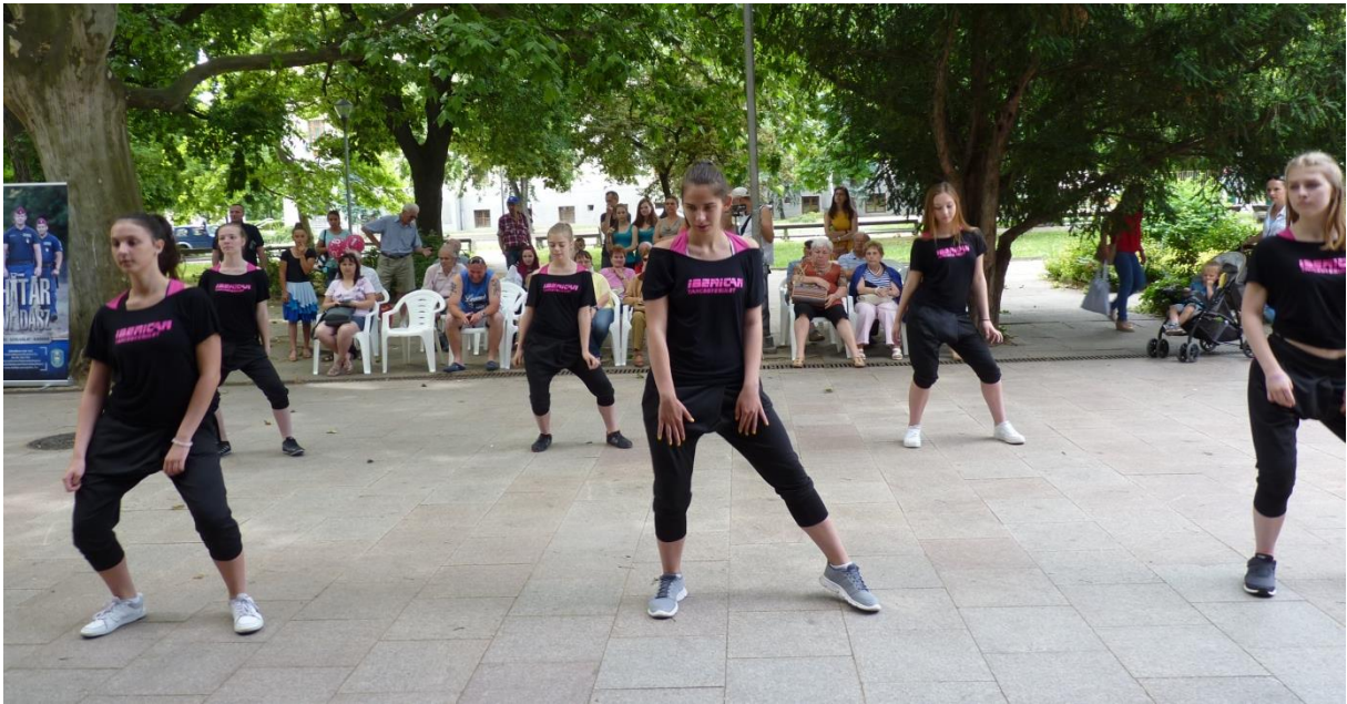
Az Iberican Táncgyesület bemutatója