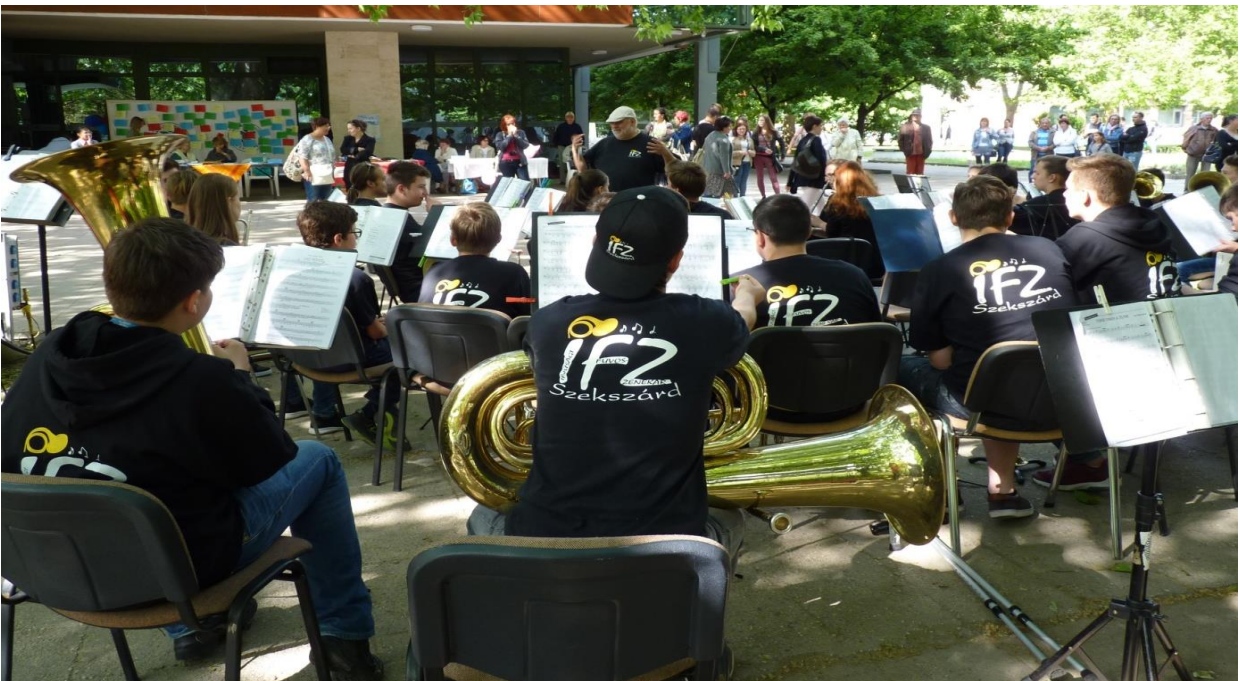
Az Ifjúsági Fúvószenekar közkedvelt térzenéjével toborozza a vélemény nyilvánítókat