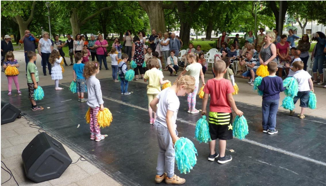
Az óvodások is aktivizálták a felnőtteket