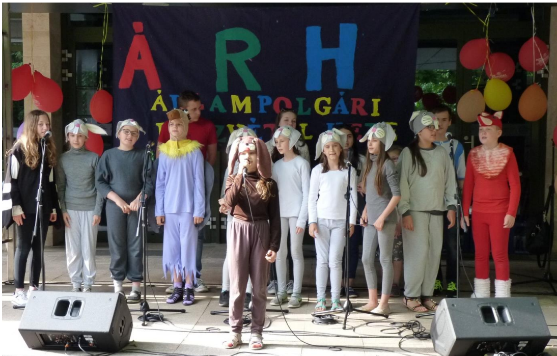
Énekel a Tücsök Zenés Színpad utánpótlás csoportja