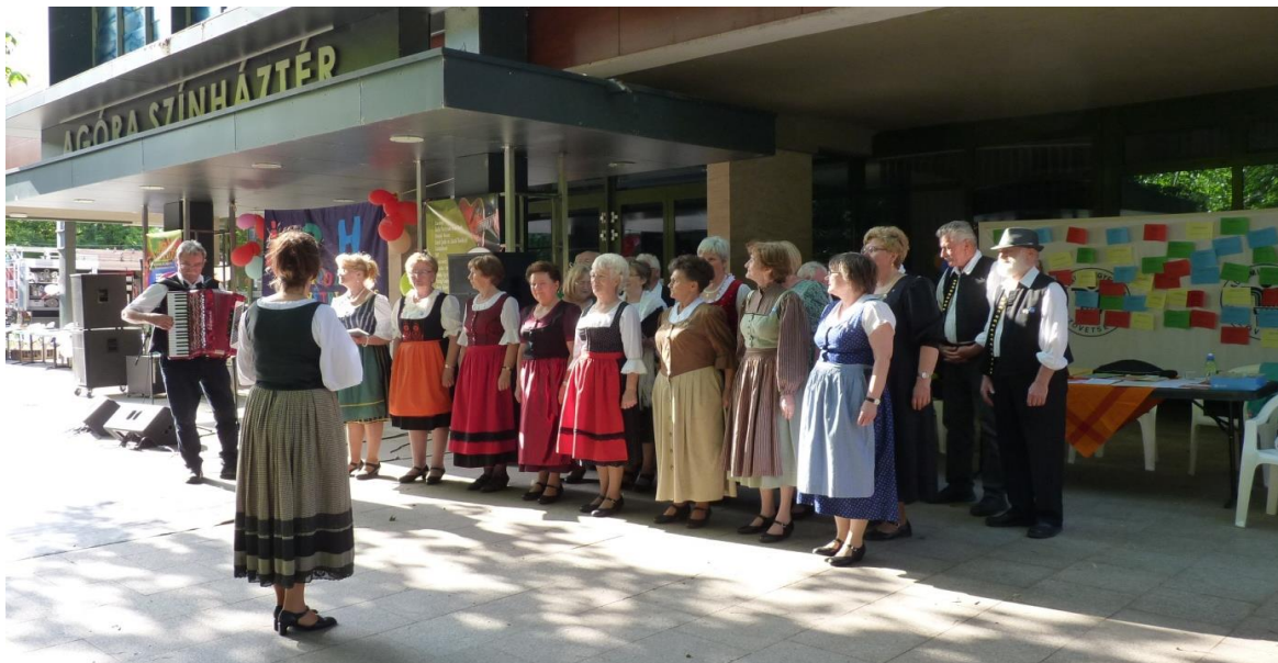
A „Mondschein” Szekszárdi Német Nemzetiségi Kórus Egyesület műsorának is köszönhető a színes cetlik gyarapodása