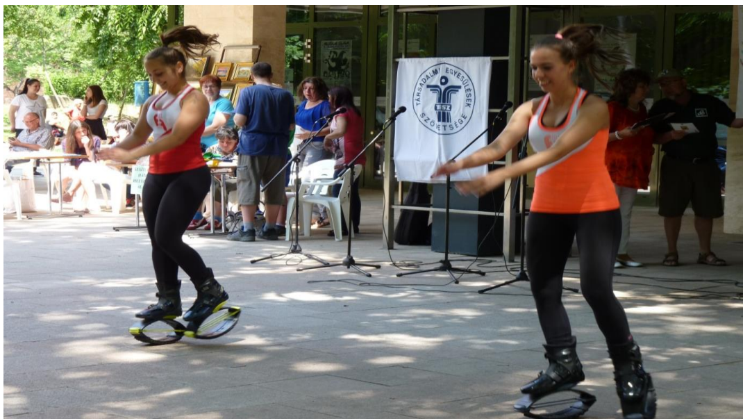
A Kangoo-s lányok a figyelem középpontjában