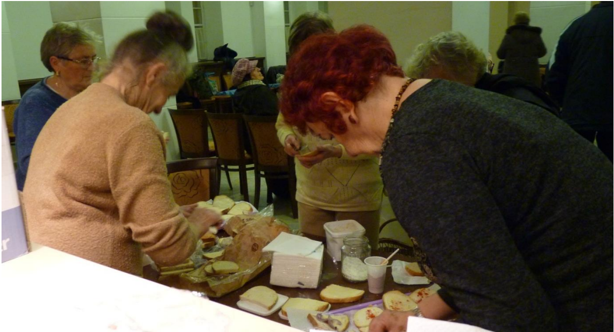
A lelkes önkéntesek gondoskodnak a fellépőkről