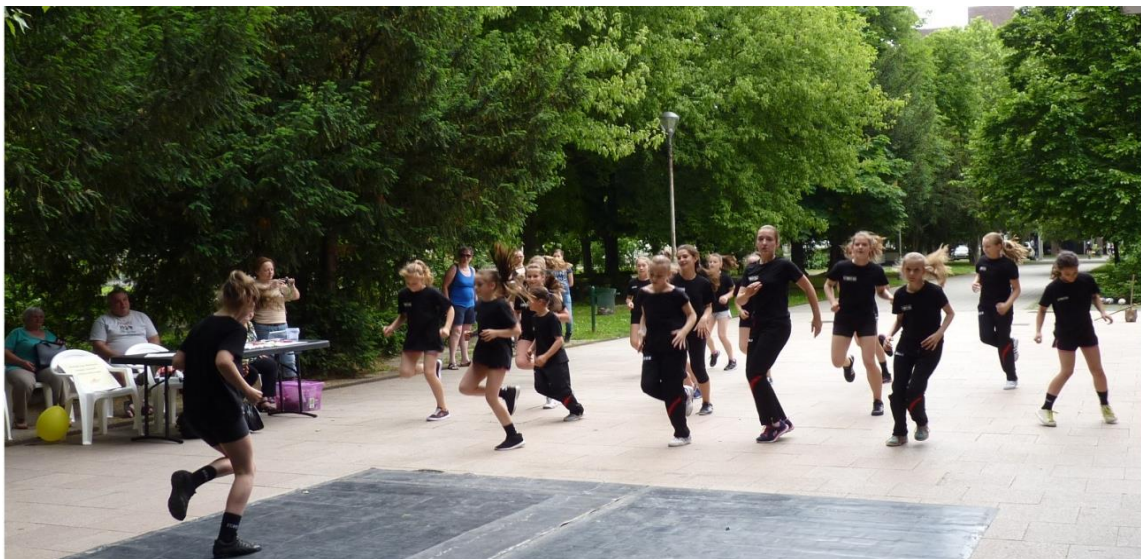
Indulóban az ÁRH a Fekete Gólyákkal