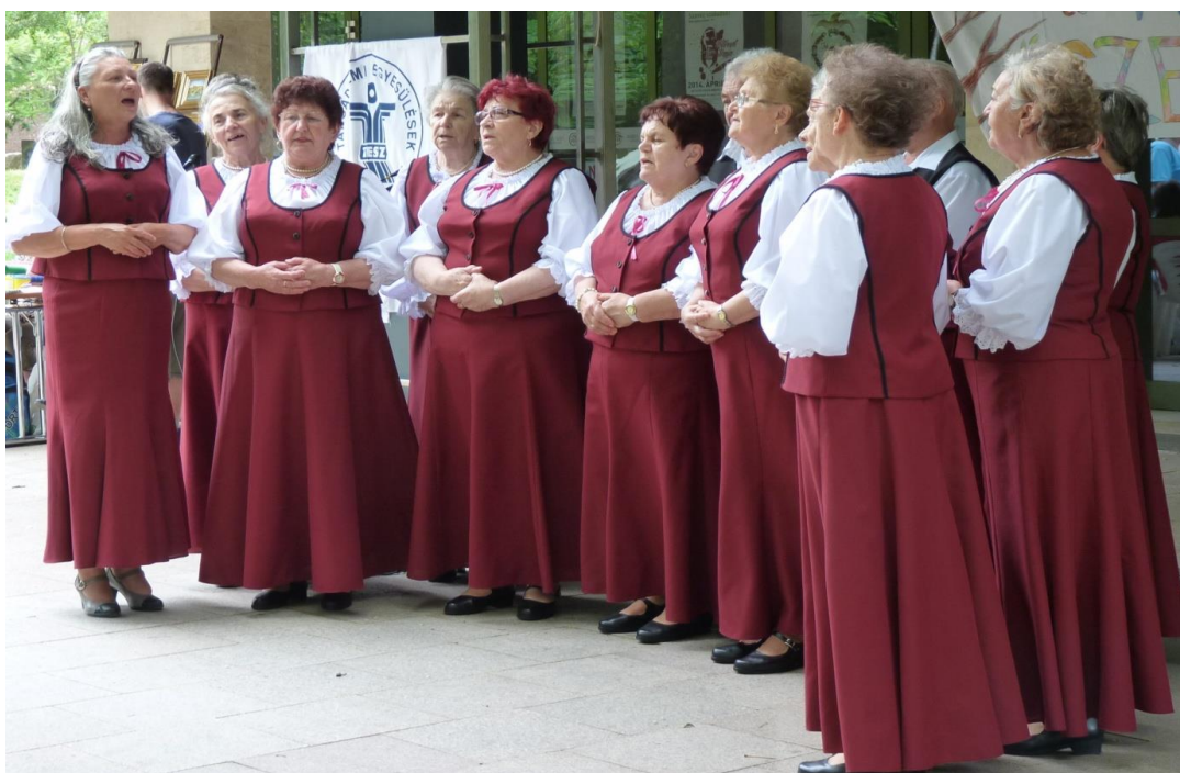
A Bukovinai Székelyek Szekszárdi Egyesületének „Maroknyi Székely Népdalköre”