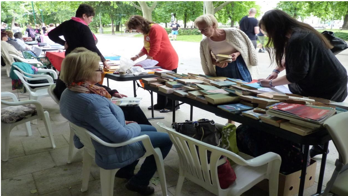
Zajlik a könyv csere-bere