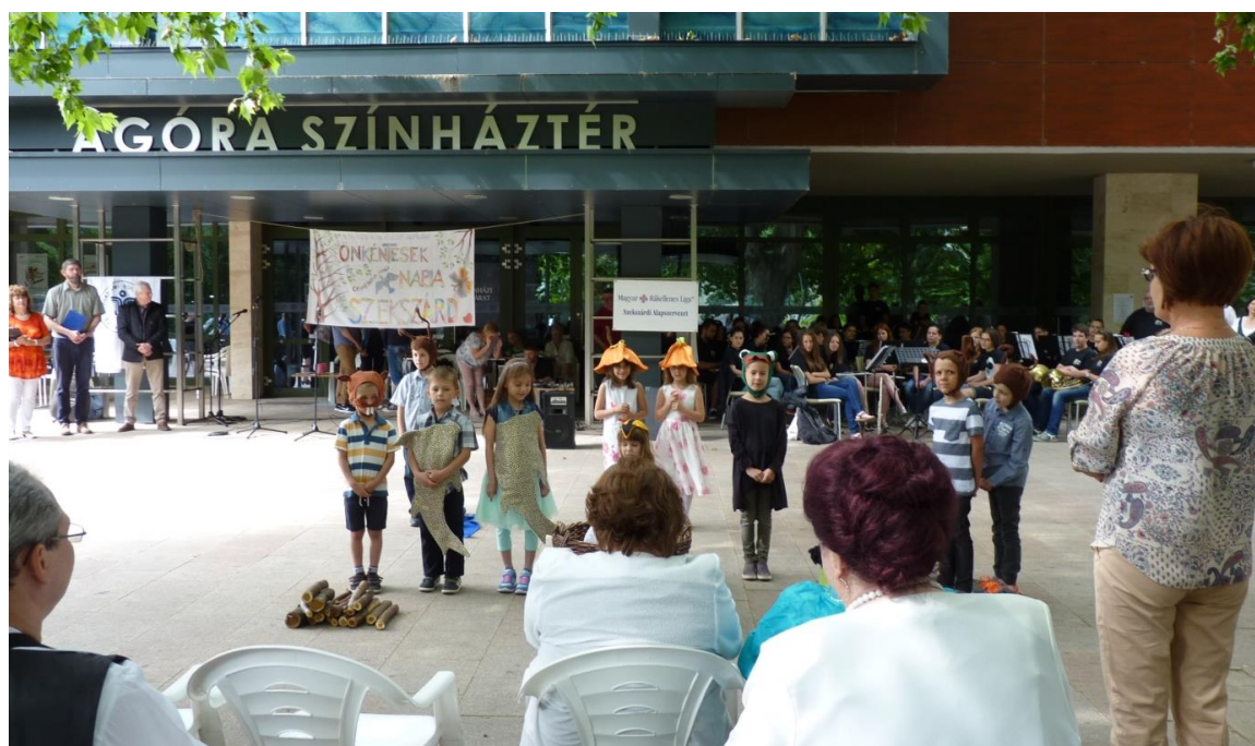
A Szekszárdi 2. számú óvoda Kadarka utcai nagycsoportja köszönti a kitüntetetteket