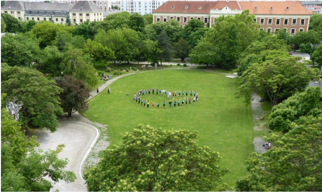
Az ÁRH szív Szekszárdon a Prométheusz parkban