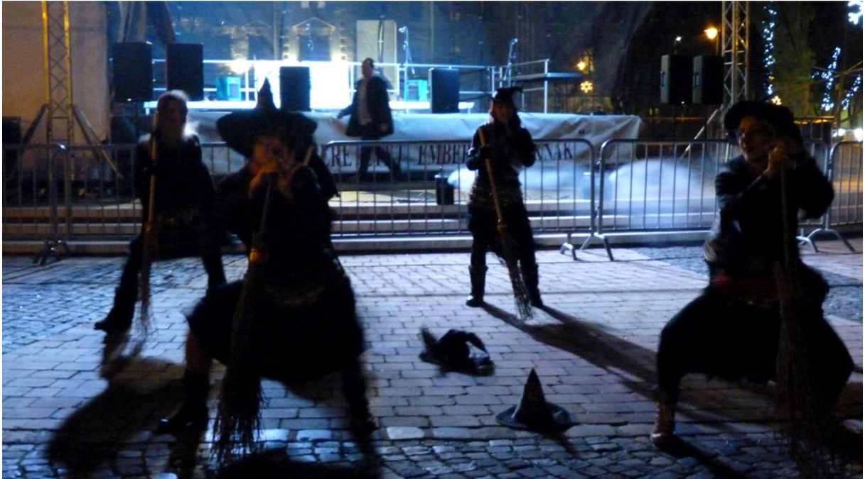
Az Iberican Táncgyűlés boszorkánytánca a Luca napon