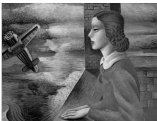
Leány és vasmadár – 1935