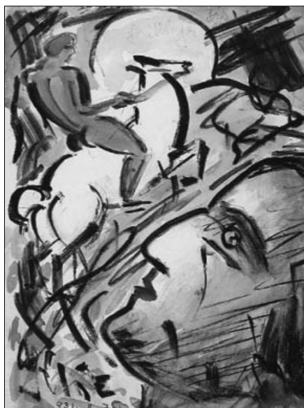
Önarckép lovassal – 1931