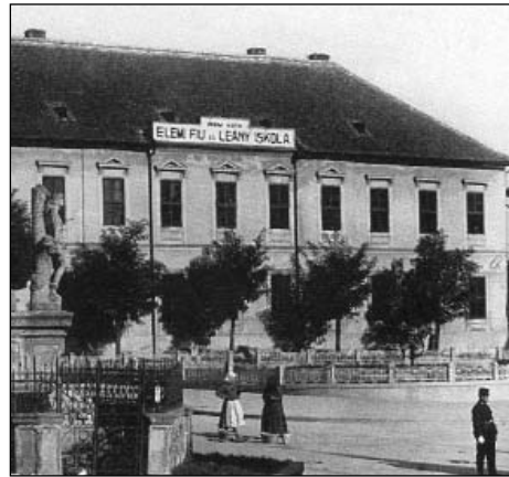
A Béla téri iskola frissen tatarozva – néhány évtized múlva

A hol tanulmányinak, hol alapítványinak nevezett uradalom elődje még akkor jött létre, amikor Mária Terézia 1777-ben – kárpótlás nélkül – egy sereg más apátságával együtt a szekszárdi javadalmait is elvette, és a Magyar Királyi Egyetemi Tanulmányi Alapítványi Uradalomba olvasztotta. Ez volt hívatott a Nagyszombatból Pest-Budára költöztetett egyetem fenntartásának biztosítására.