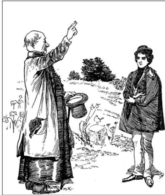
Lelkiatyai intelem (Mühlbeck Károly rajza)

Nem csoda, ha egyik tanáráról annak elhunytakor azt írta: „Szent