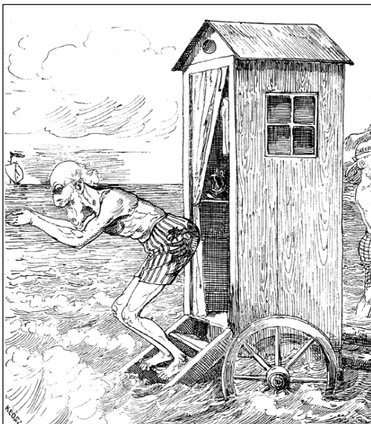
A miniszterelnök (Tisza Kálmán) fürdözik (Jankó János rajza)

us 7-én az akkori lottó, a kis lutri megszüntetését ellenzőket bírálta. „Azzal érvelnek a lutri mellett, hogy eltörlésével sokat vesztené az állam. Gyönyörűséges elv! Menjenek miatta tönkre ezren és ezren az állam polgárai, csak maga az ál-