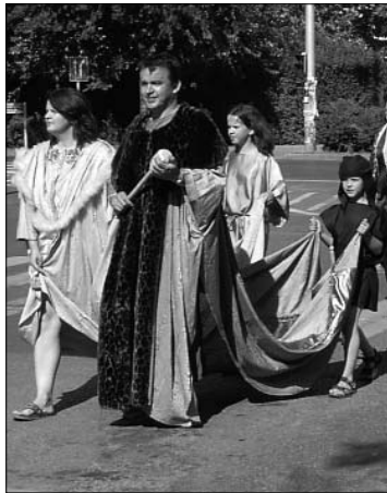
A polgármester és családja a jelmezes felvonuláson és civilben