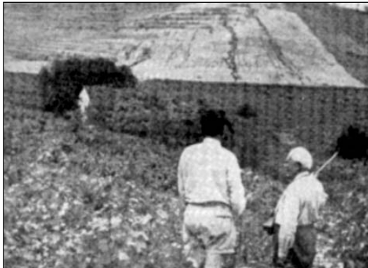
Erőzői 1961-ben a Görögszó-dűlőben

érezte hitelesnek, teljesnek erről az időszakról. Azt is aligha képzelte, hogy egykor majd itt szerzett nyelvtudása jelenti kenyerét a földrajzitanítás mellett.