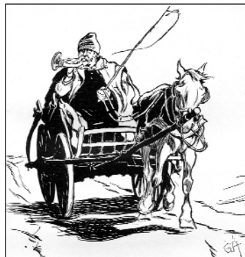
Az agárdi postakürt (Garay Ákos rajza Bodnár kötetéből)

Ekkor még hirdeti az ígét az 1947 októberében Cleveland-ben el-