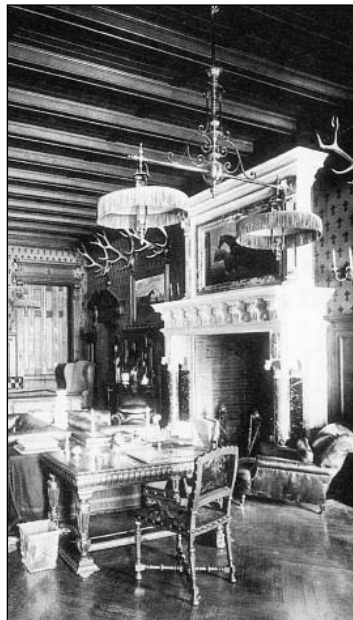
... és megvalósulása egy főúri szalonban

az alsó sétateret, ahol artézi kutat fúratnának, mely nemcsak a fürdőt látná el a szükséges vízzel, hanem egészséges ivóvizet is szolgáltatna a lakosságnak. Kijelentik, hogy az összes berendezésbe általuk befektetett tőkének 6%-on felüli tiszta jövedelmében a községet részesítik.” Ha mégis a villany mellett döntene Szekszárd, a régi petróleumlámpákra szánt összegért ajánlanak