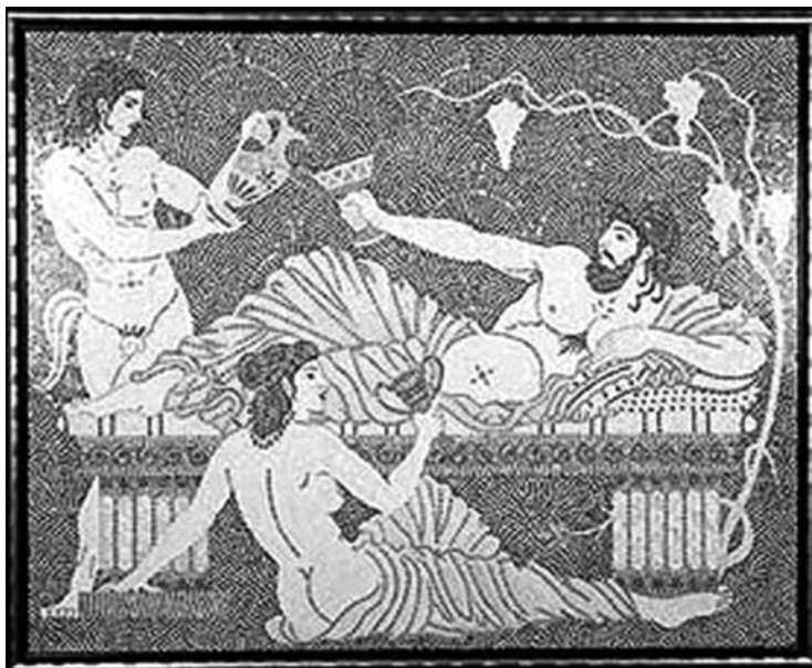
Kedélyes borozgatás az antik korban