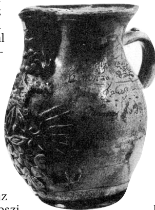
Boroskancsó (19. sz.)

Aki érzékenyen olvas a sorok között, az bizony észreveheti a szelíd iróniát, egyúttal Juhász Gyula magánvéleményét az alkoholizmus jelenségéről - minderre utal az idézet utolsó tagmondatának „azért” szava. De mégis mi a helyzet azzal az állítással, hogy az ital a költői ihletet szolgálja? „A szent örület, az ihletettség dionüszoszi állapota valóban mutat külső analógiákat