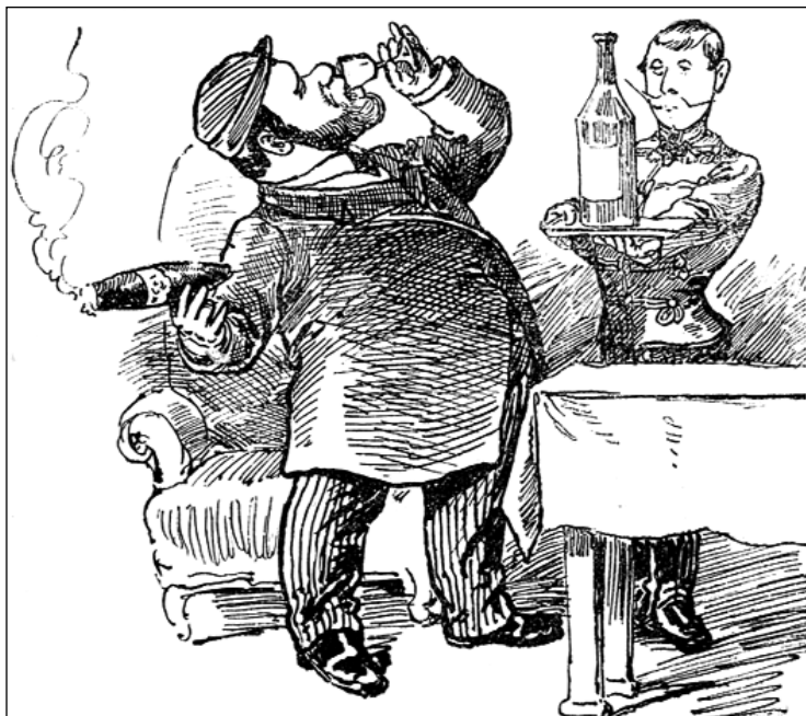
Nemcsak a szivar ártalmas... (Jankó János rajza)

„Érthető, ha ily emberek balga rajongásukkal, korlátolt hiúságuk-