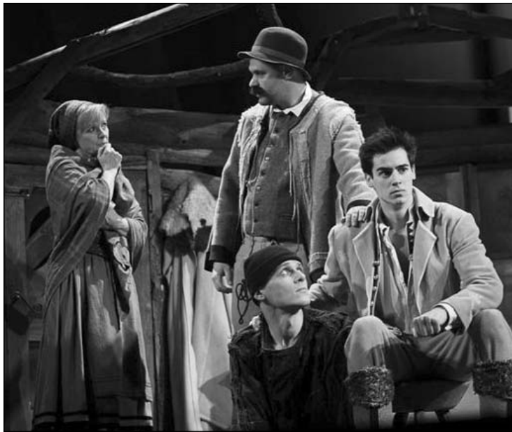
A budapesti Magyar Színház március óta játssza az Ábel színpadi változatát