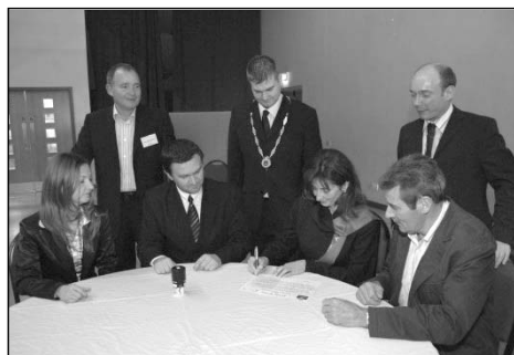
Az ünnepélyes aláírás pillanatai

A Belfasttól 30 km-re fekvő, mintegy 12 ezer lakosú észak-ír város polgármestere, Edward Rea még a Sziüreti Napok alkalmával tett látogatása során hívta meg a szekszárdi városvezetést egy downpatricki „kirándulásra”. Az apropót a testvérvárosok közötti ifjúsági kapcsolatok konferenciája szolgáltatta, melyen többek között német, olasz, litván, angol és ír partnertelepülések képviselői, illetve iskolás gyerekek osztoztak meg egymással a cserediák-program tapasztalatait.