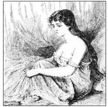
Bánatos menyecske (Jankó János rajza)

Még ugyanebből a számból az is kiderült, akadt olyan, akit első fokon otthon büntettek. „Egy kardos menyecskét azzal vert meg a végzet, hogy férje nagyon szerette a bort. Nap, nap után részegen tért haza, asszonyán jó sort vert, ha szemére hányta dorbézolását. Végre a véletlen megváltotta szenvedéseitől: a részeges ember egy sötét éjszakán lebukott a hídról és megfulladt. Az asszony nem volt bánatos