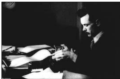
A Szép szó szerkesztőjeként – 1936

Kortársak, bajtársak, eszmetársak voltunk, s mégis, szinte egyetlen szántságzándékkal, mennyi kínzó ellentétet vetett közénk a sors; a legszörnyűbbet, melyről még beszélni sem tudok, épp az utolsó esztendőben. Szenvedtünk egymást miatt s mégis barátok voltunk. De mit jelentett ez, mi értelme volt ennek? Most majd teljes egészében átérezhetem, most, hogy ő már semmit sem érezhet belőle. Minden halál vád az élők ellen, akik még bírják az életet.