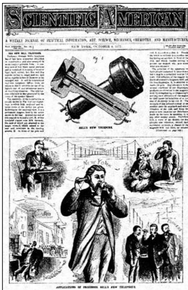
A telefon bemutatása (Az Amerikai Tudomány című folyóirat 1877. október 6-i címlapján)

Ha ma már csak mosolygunk is a félkilós készüléken, annak ekkor felismert jelentősége beigazo-