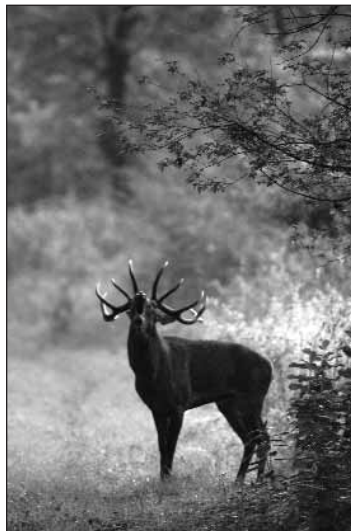
Ez a fotó nyerte a Nimród különdíját: a címe Szeptember, készítője Krizák István

Ezt támasztja alá a szekszárdi székhellyel működő Ge-