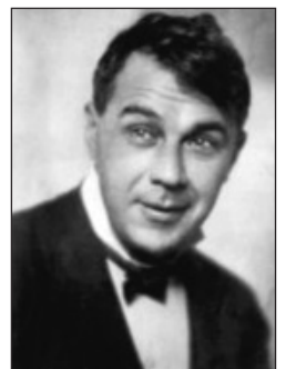
Fiatalon, kezdő íróként reményekkel telve

Mosolyogva idézi fel kezdő írói korszakának szarvashibáját: túlságosan is naiv hitét az emberekben; szélsőségesen bízott abban, hogy kifejezőerejével és szuggesztivitásával sokakra fog majd hatni. Mint írja: „Egyre szerényebb leszek. Amikor kezdtem, azt képzeltem, hogy olvasóim mindjárt szőröstől-bőröstől megértenek engem, oly tökéletesen, mint ahogy én érzem azt, ami vagyok, mint ahogy állandóan és egyetemesen érzem egyedülvaló mivoltomat, sorsomat, egyéniségemet, a fejem búbjától a lábam ujjáig. (...) Ma már beérem azzal, ha észreveszik egy-egy újdonságomat, egy-egy sokszor mellékes, esetleges képességemet, mely szellemi és lelki életemben csak annyi és oly fontos, mint körömömön egy fehér vonalka, mint fejemben egy hajsza.”