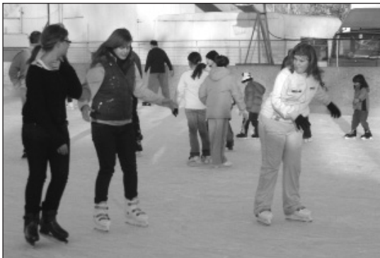
Kicsik és nagyok egyaránt élvezik a téli sportlehetőséget

rint a délelőtt az óvodáké és az általános iskoláké, akik élnek is az ajándékba kapott lehetőséggel. Szervezett keretek között hétköznaponként átlagosan 100-120 gyermek látogatja a pályát, ismerkedik a sporttal. Még vidékről is bejárnak korizni, ott jártunkkor éppen palfai