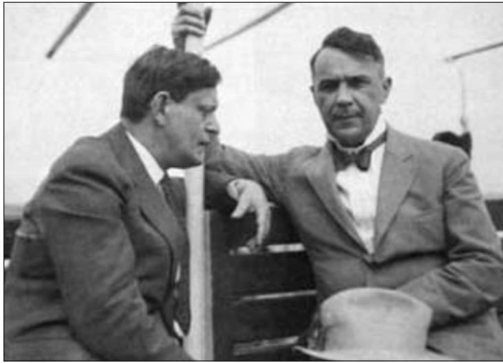
Kosztolányi és Karinthy, amint együtt gondolkodnak, együtt lélegeznek

Legelőször is némi magyarázat: köztudomású, hogy Kosztolányi zöld színű tintával írt. Ez önmagában szimpla tény, az már azonban meghökkentő, hogy e címet még akkor ötölte ki barátja mulattatására Karinthy, mikor az még élt. Mindössze egy nappal halála előtt, a János-kórházban. Így emlékszik az író: „Tudtam, hogy vége van. És hazafelé menet beszélgettem vele a döcögő kocsi mélyén, ahogy lelkiünk legmeghittebb testvéreivel szoktunk, nagy távolságokból is, izgalmas és szenvedélyes pillanatokban. (...) –Hát a nekrológommal mi lesz? Írnod kell, szerencsétlen, és én kárörömmel figyellek majd a sír páholyából, ahogy erőlködsz... no híres, mi lesz a nekrológ címe? »Hát kérlek... valami nagyon meghatározható kell... hm, várj csak... mit