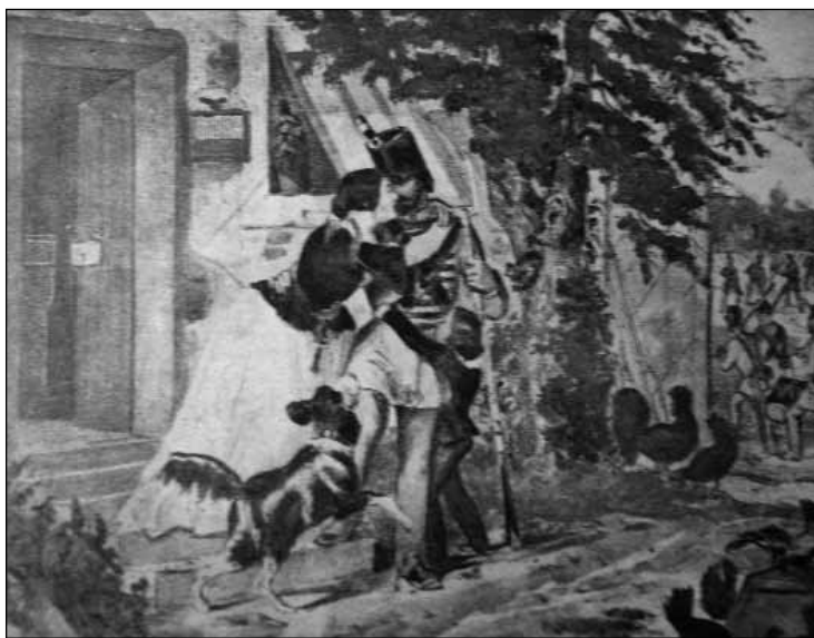
A búcsúzó nemzetőr (egykorú könyvomat)