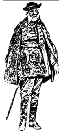
Garay Antal időskori képe