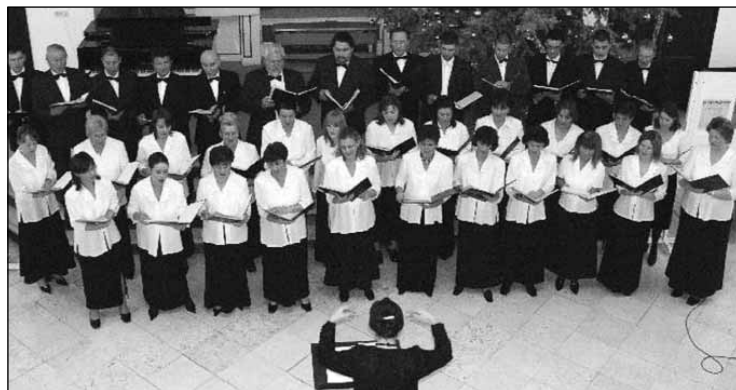
A szekszárdi Gárdonyi Zoltán kórus lehet az új program egyik nyertese

KÁBEL-TV és INTERNET együtt már 3990 Ft-tól!!!*