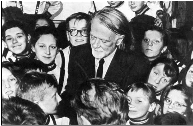
Mindannyian tisztának születünk. Kodály Zoltán erre emlékeztetett.

„A magyartól például sokkal inkább különbözik a germán nyelvek hangrendszerre, mint román nyelveké, ezért nehezebbek számunkra. Egy olasz, francia, ha akarja, megtanulhatja tökéletesen a magyar kiejtést. De már német és angol születésű ember magyar beszédén holtig érezni az idegen ízt.” Ma már talán nehezen tudnánk rá példát mutatni, ám a zenetudós Kodály környezetében nem egy magas beosztású, művelt ember adta föl könnyedén a helyes magyar kiejtéssel való beszédet egy külföldi kedvéért. Minálunk, ugye, egynemely tanárember sem szólal már helyesen anyanyelvén, helyette tanórán mesél rasszista vicceket, hogy mást ne említsünk. Így fogalmaz Kodály: „Két vagy több eltérő hangrendszerű nyelv tudása oly feszült figyelmet, folytonos éberséget kíván, hogy nem csoda, ha sokan belefáradnak e Scylla és Charybdis közt való hanyórázásba, és feláldozzák magyar kiejtésüket