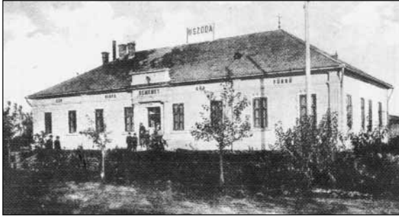
A szomszéd gőzfürdő, amely a legjobban örülhetett...

ömlik (még éjjel is) és meleg. – Hiba – mondta nagy áhítattal –, csak az ördög fortélyá ez is... Bizonyosan a pokolból jön: azért meleg, aztán meg bűdös is...”