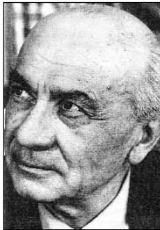
Illyés Gyula utolsó fényképe

Egyik alig idézett költeményében, a Verses levél Zilahy Lajoshoz címűben ott találjuk a legmagyarabb jelképek és büszkeségek között. „Hogy is vagyunk hát egymással, mi, magyarok? / Tizenhárom-tizennégy millió – ennyi, szerintem, / ha nem tizenöt, / aki tán két rádióhír között / azzal mond népszámlálási igen-t, / hogy lábizmában érez örömet, mert / egy magyar labda megint bement; / ki-nek szinte itten hagyott, személyes barátja Háry, / és Lúdas Matyi, a sosevolt Csicsóné lányai, / a kondorosi ménes, s aki megáll, / - így tölt ki rovatot - / azt