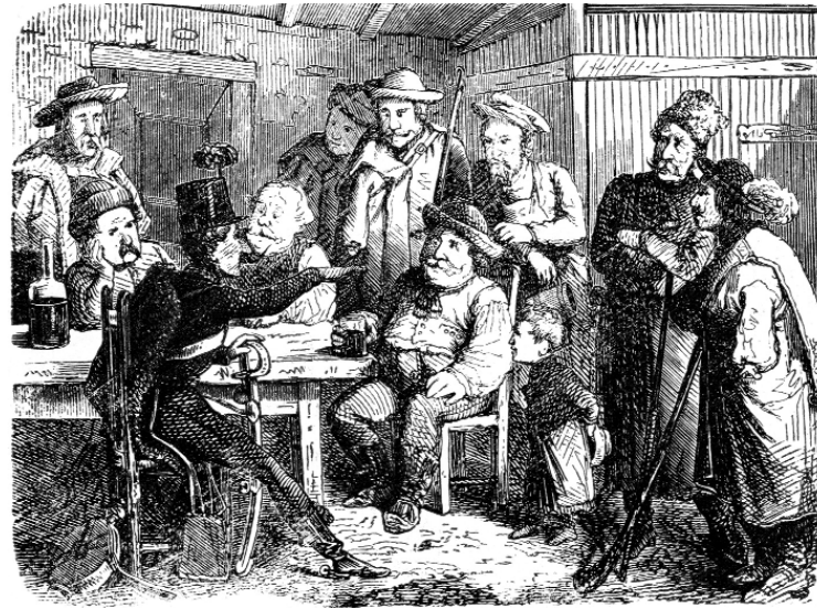
Az obsitos első ábrázolása (Jankó János metszete)

hallván a Cityben vagy Citében / vagy Szingapur vagy Tokio szívében / valaki azt mondta: jónapot!” (Az sem véletlen, ha a kötetben olvassuk a mű után: „Elhangzott 1962 karácsonyan, a Szülőföldünk amerikai magyarokhoz szóló műsorában.”)