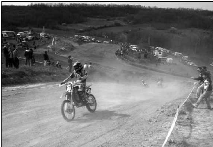
Talán az utolsó verseny a szőlőhegyi krosszpályán

ezért lehetett respektálni a Csőtőnyi-fiók egyről-kettőre, majd háromra jutását a 125 és 250-es géposztály első és másodosztályában, a Szekszárdi Vízitársulat SE színeiben. Remek kis csapat volt: fénykorukban tavasztól ősziig végig versenyezték az idényt, megfordulva az ország valamennyi pályáján, kielégítve a helyi ifjúság akkoriban