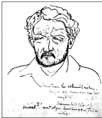
Kernstok Károly arcképe

Ezen a ponton érdemes kitérni a festő, grafikus életrajzára. Az Új Magyar Életrajzi Lexikon azt írja, legfőbb érdeme az volt, hogy felismerte a művészeti forradalom szerepét a társadalmi változások előremozdít-