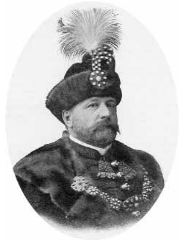
Justh Gyula díszmagyarban