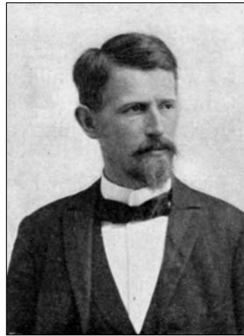
Az alkotó: Szárnovszky Ferenc

A génius kidolgozása remek. Annál nevelésesebb (csak azért reprodukáljuk, nehogy tovább terjedhessen) az a kifogás, melyet némelyek, mint a közérkölciség védői, a géniust ábrázoló hölgyalaknak öltözetlen, dekolletált volta miatt emelnek. Ez káros hatással lehet, mondák az erkölcs magas őrei, a polgári iskola ifjúságára, mely a Garay