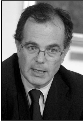
Simor pofonokra számít

– Pontosítsunk: azzal, ami hosszabb ideje zajlik. Fontosnak érzem, hogy leírjam, mit tesznek más-