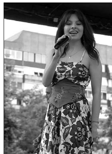
Zséda koncertjét elfújta a szél

Délután a Junior Stars együttes játszott klubhangulatú zenét. A faszor a futóké volt, de az eredményhirdetés után jött, amire a legtöbben vártak: Zséda fellépése. Egyik legszebb hangú énekesnőnk hiába kezdte meg Szekszárdon nagykoncertjeinek sorát, az időjárás nem volt kegyes hozzá, és csak öt dalt énekelhetett el. A pergősebb ritmú, gyakran játszott Motel szólalt meg először. A varázsos, törekeny, szép mozgású énekesnő lány hangját már itt sem élvezhetjük igazán, a hangosítás kívánnivalókat hagyott maga után, a szöveg érthet-