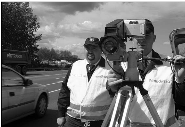
A gyorsajtókról zárt rendszerben készülnek a bizonyító erejű felvételek