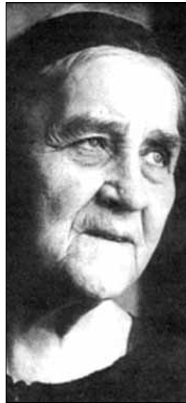
... mindvégig friss maradt

A filozófus az előző évben figyelt fel rá, amikor a tihanyi Nemzetközi Szemiotikai Kongresszus nyitó előadására hívták meg 95 évesen. A fejből, jegyzetek nélkül elmondott másfél órás Jel és mozdulat után „a hallgatóság ámult és bámult, majd odatódultak, az előadóteremtől a hosszú folyosón át, egészen a ka-