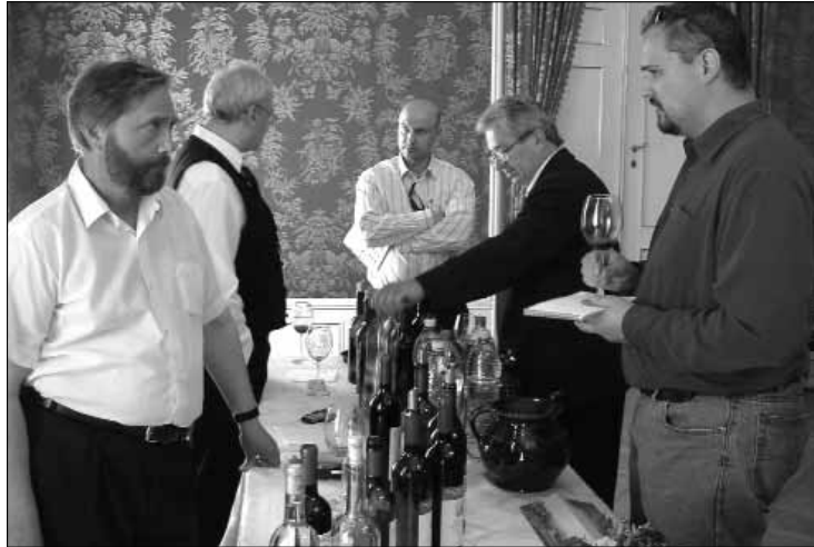
A szekszárdi borászok nagykereskedőkkel is találkozhattak

park tervével ismertetett meg a polgármester úr, néhány cégnél már is kilincselek. Szót ejtettünk arról is, hogy kellenek a várospolitikában az adókedvezmények. Én is járom az országot, s a kozármislenyi példát említtem a polgármester úrnak, hiszen az ottani kedvezmények elvitték más baranyai, vagy dél-dunántúli várostól a befektetőket.