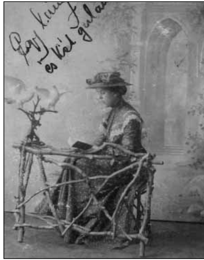
Az ifjúi tudásvágy ábrándosa...