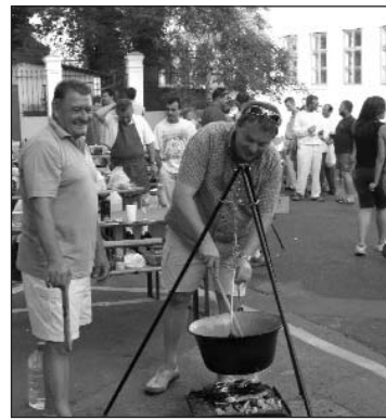
Népszerű a pörköltfőzés

Ugyancsak szombaton sátrakat, asztalokat állítanak fel az Illyés Gyula Megyei Könyvtár udvarán, s egy kerti parti jellegű „Irodalmi zsongás”-t tartanak. Idén is elsősorban a fiatal költőknek, íróknak