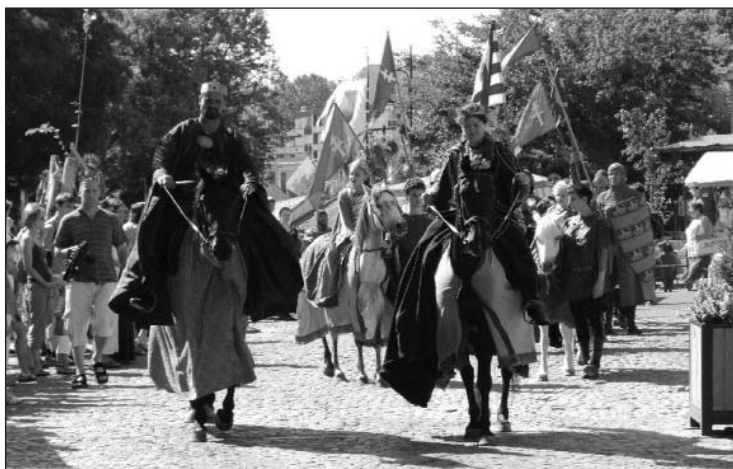
Június utolsó hétvégéjén középkori díszletekbe öltözik a belváros

A június 27-től 29-ig tartó ünnepség fénypontja a korábbi felvonulást felváltó „Ünnepi Országlás és Hódolatfogadás” lesz vasárnap 16 és 17.30 óra között. Kis Pál István költőt, írókat kérték fel egy történelmi játék megírására. Ennek előadása során a királyt köszöntik majd városunk vezetői, képviselői is, valamint több, a középkori hagyományokat őrző egyesület, és a királyi udvar vendége lehet sok-sok érdeklődő. Az előző évben háromszázan