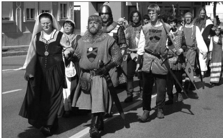
A jelmezes felvonulást „ünnepi országlás és hódolatfogadás” váltja