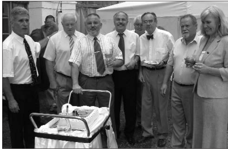
A Szekszárdi Rotary Club néhány tagja a születésnap tortával

Ilyen volt például a Bazilikában egy koncert a Sasad Klub szervezésében, és ilyen a június 29-én a Magyar Színházban „A vámpírok bálja” című darab. Ezt az előadást a miskolci rotarysok szervezik.