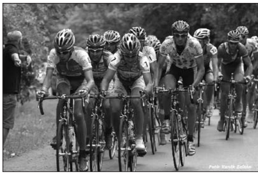
Idén Somogy megyébe kirándul a mezőny

A legszembetűnőbb változás pénteken, július 11-én lesz érzékelhető: a kerekesek ugyanis elköszönnek egy kis időre a tolnai megyeszékhelytől, és átruccannak egy másikba, a somogyiba. Idén