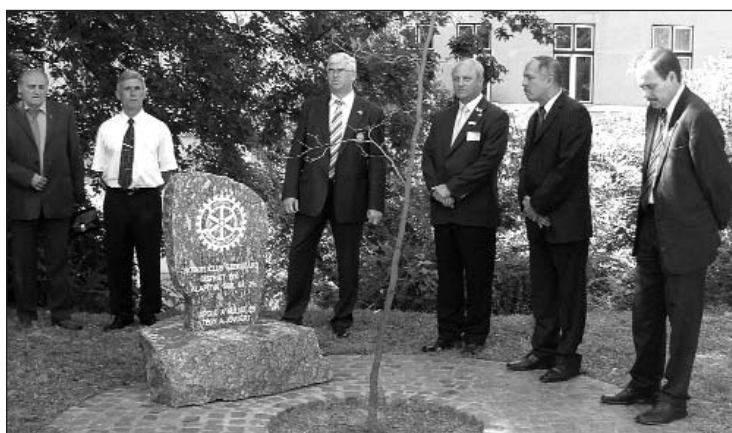
A jubileumi ünnepség a vármegyháza kertjében, a Szekszárdi Rotary Club által emelt emlékkőnél kezdődött

dó falu projekt, amelynek egyik kezdeményezője az ismert budapesti rotarysta, Bálint Gyuri bácsi, a népszerű Bálint gazda. A programban egy Heves megyei kis faluban, Tarnabodon a hajléktalanná vált embereknek kínálnak lehetőséget. Budapesten félmillió forinttal támogattuk a Ferencvárosban működő Dzsumbuj Egyesületet,