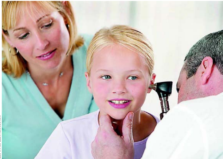
Fontos a veleszületett nagyothallás korai felismerése

– Sajnos mára szinte evidenciának számít az idős korban jelentkező nagyothallás, ami elsősorban a nyolcvan év körüli embereket érinti. Korábban is mutatkozhatnak a tünetei, de az kevésbé jellemző. Öröndetes hír viszont, hogy a mai digitális hallókészülékek már jó minőségű erősítést produkálnak, ráadásul kiszűrjük a nem kívánatos zörejeiket. Érdemes