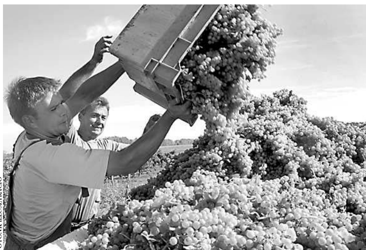
A pinceszövetkezet felvásárolná a termést

Előljáróban minden annyira „klappolt”, hogy az úgynevezett objektív tényezők „betették azt a bizonyos kaput” – emlékeztetve a korai kapitalizmus magyarországi valóságára. Az érdeklődéssel párhuzamosan a feszültség is fokozódott. Látszatra a „nemzetközi helyzet” begyűrűzése nélkül, de lehet, hogy annak is van kártékony hatása ez ügyben, merthogy a kormányzat uniós forrásokkal is számolt, amikor cirka 250-300 milliós vissza nem térítendő támogatás mézesmadzagát húzta el a szövetkező szekszárdi és környékbeli gazdák előtt. A 2007-es évet kínos csend jellemezte, merthogy az illetékesek nem írták ki a pályázatot. Ez még olyan nagy gondot nem jelentett, de az már igen, amikor az idén tavasszal napvilágot látott.