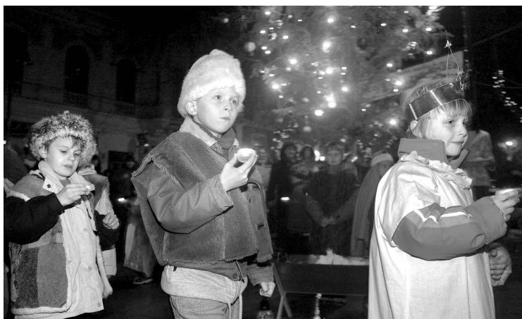
Mindennap programok várják az érdeklődőket

Garay János Általános Iskola és AMI műsora - Garay tér