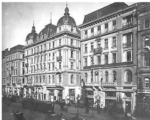
Az egykori Apolló székháza

„Egy ördögös masina révén Szekszárdnak maholnap ismét világ – vagy hát mondjuk – országos híre lesz. Belekerültünk a mozgófényképszínházba, vagyis új magyarsággal a moziba. Lapunknak egy budapesti munkatársa írja, hogy november közepe óta az Apolló, Budapest legelső mozgófényképszínháza szekszárdi vonatkozású, saját felvételű filmet szerepeltet a műsoron, címe: Szőlőtermelés Szekszárdon. A felvétel a Martin-féle szőlőben történt. Először is a hegyoldal jelenik meg a képsorozaton – a tanyával. Ezután indul meg a mozgó, kissé gyors tempóban ugyan, mert pár percnyi kapálás után már a permetezés jön, erre pedig a szedés következik, ugyanolyan rövid időre, de ez nem zavarja meg az illúziót. Gyors változás, s a puttonyosok hosszú sora jelenik meg, még egy kis alig 7-8 éves puttonyos is,