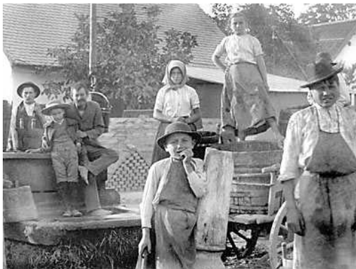
Szüretelők – az előző (1907-es) évből

De az arkifejzésük – vagy komolyság, vagy elfojtott mosoly – mutatja, tudják, mily fontos szerepet töltenek be ők most. Ebéd után táncrea perdülnek a lányok, növeli a hatást, hogy a mozi zenekara is friss csárdásba kezd, s emellett járják rezgősen. De csakhamar vége van ennek is. Eltűnnek a táncoló párok, s ismét a tanya előtt vagyunk, hol buzgó mustkóstogatás folyik. Itt ismerősre akadunk: dr. Mar-