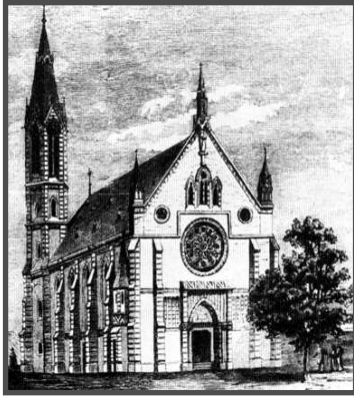
Az újvárosi templom a Vasárnapi Ujság egykorú metszetén

Nem akárhogyan. „Minthogy örökösöm Szekszárd városának öszves keresztény lakossága, nem kétlem, hogy ezen ájtatossági közérdek tekintetéből arra, hogy az építés jó anyagokból és a terv szerint készül-é, az egész közönség, különben pedig nemes hivatásuknál fogva a papi és világi előjáróság figyelemmel felügyelni fognak.”