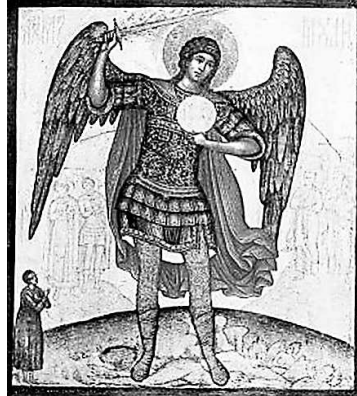
Szent Mihály ábrázolása XVI. századi ikonon