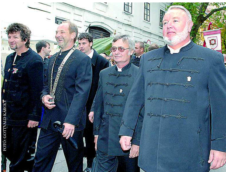
Idén egy zászló alatt vonultak a szekszárdi borászok