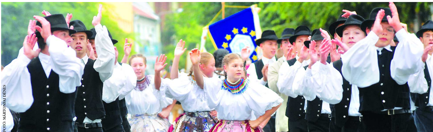
Összesen 46 csoportot tapsolt meg a közönség a szüreti napok csúcspontjának számító felvonuláson