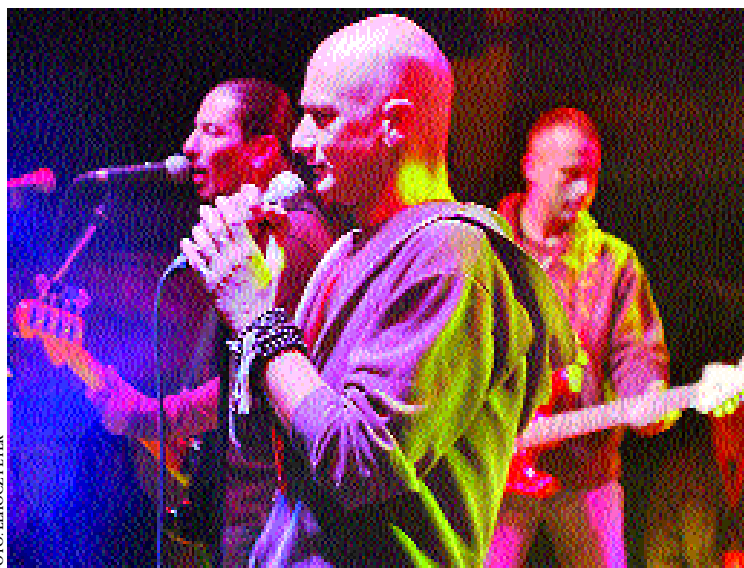
Hatalmas tömeget vonzott a Republic vasárnapi koncertje