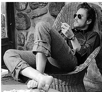
I'm not there - Bob Dylan Élteni

szept. 25-okt.1. 17-19 óra: I'm not there - Bob Dylan Élteni - színes feliratos am.-német film