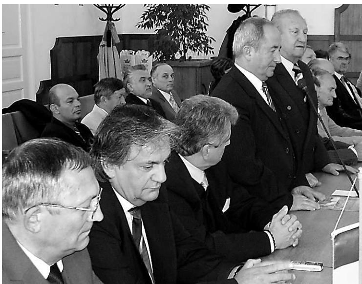
Az erdélyi Lugos és Facsád küldöttségének tagjai a fogadáson

A küldöttségek tagjai – polgármesterek, képviselők, a külkapcsolatokért felelős munkatársak – zömmel ismerősként üdvözölték egymást és a szekszárdi városvezetést. Három testvérvárosunkban azonban új polgármestert választottak a közelmúltban, így ők első alkalommal tettek hivatalos látogatást Szekszárdon. Az észak-írországi Downpatrick fiatal polgármestere, Colin McGrath, illetve a romániai Lugos (Lugoj) első embere, Francisc Boldea, aki – többek között – felesége társaságában érkezett, első alkalommal köszönhette meg delegációja nevében a szívélyes fogadtatást, és