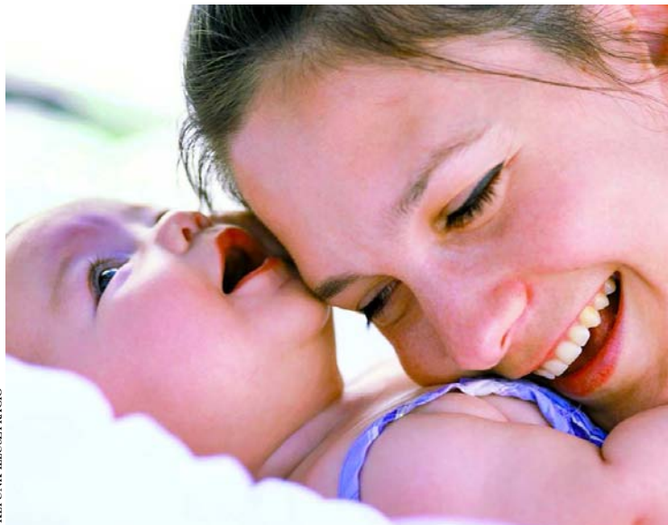
Fontos a felkészültség, hogy az anyaság valóban öröm legyen

– Előfordul, s ez teljesen természetes, hogy az a kismama, aki végigülte a második trimesztertől javasolt összes foglalkozást, s elméletben tökéletesen elsajátította például a szoptatási technikát, gyakorlatban megretten a piciny szuszogó lény törekénységétől, testi reakcióitól. Görcsössé válik az anyuka lelke-teste, állandóan a feszültség, ami meghúsi a picit szoptatását. Ezért nem lehet eléggé hangsúlyozni: az anyákat biztatni és erősíteni kell, hogy képesek legyenek nemcsak a kihordásra, de a szülésre, szoptatásra, az újszülött gondozására. A mostani jogszabályi háttér, a minisztérium szakmai protokollja szerencsére lehetővé teszi, hogy várandós programokkal álljunk a szülők mellett, megadva számukra a legújabb kutatási eredményeken, bizonyítékokon alapuló információkat.