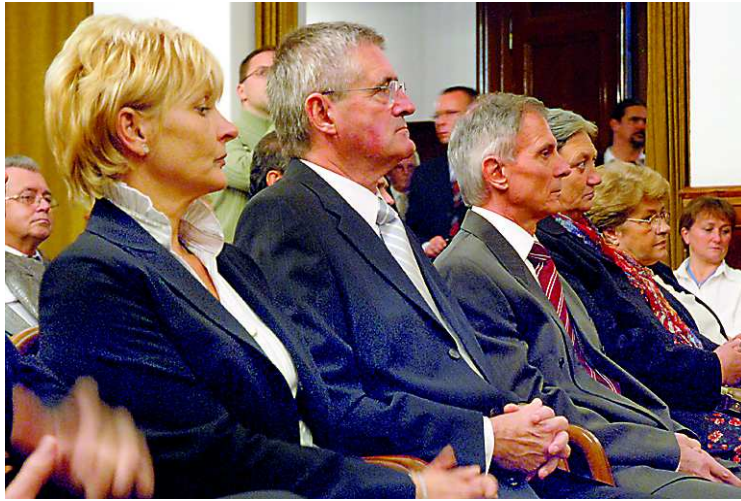
Kitüntetettek egy csoportja a megyeházabeli ünnepségen