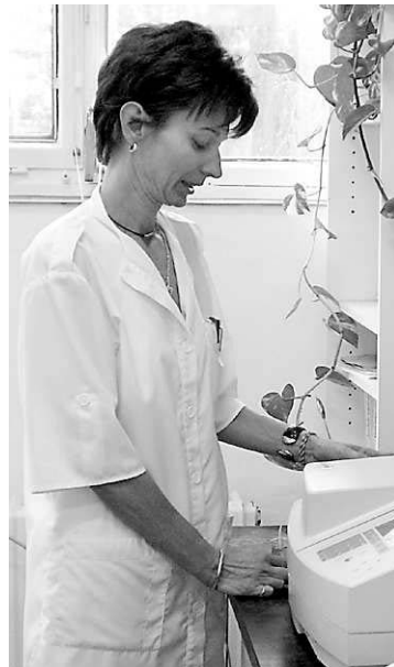
A vízmű Bogyiszlói úti laborjában magánszemélyeket is várnak

- Talán kevesen vannak tisztában azzal, milyen értékes kincs van a birtokunkban, hiszen Magyarországon nincsen vízhiány, felszíni és felszín alatti vizeink csekély mértékben szennyezettek. Ez köszönhető annak a jól képzett szakembergárdának, amely országsszerte óvja vízkészleteinket, de laborunkban mi magunk is mindent megteszünk ennek érdekében. Ezért fejlesztjük évről évre szisztematikusan a laboratóriumot, amely jelentős mennyiségi és minőségi fejlődésen ment keresztül. A kémiai vizsgálatok mellett több mint másfél évtizede bakteriológiai ellenőrzéseket is végzünk, műszer- és eszközállományunk korszerűsítése folyamatos. A laboratórium akkreditált státuszának elnyeréséhez magas szakmai követelményeket kellett teljesíteni. Tolna megyében egyedülként mi végzünk akkreditált mikrobiológiai vizsgálatokat. Az uniós csatlakozás után életbe lépett jogszabályok új és szigorúbb követelményeket támasztottak a szolgáltatókkal és a laboratóriumokkal szemben a környezet- és egészségvédelem érdekében.