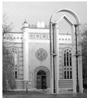
A pályázati pénzből belül megújul a Művészetek Háza

vő térkapcsolat kialakítására pályázott. A művelődési ház új funkciókkal bővül, a mozi helyén mobil konferencia- és táncterem lesz. Korszerűsítik a színházi technikát és az épület világítását. A Művészetek Házát a kor színvonalának megfelelő kiállítóteremmel alakítják át. I. I.