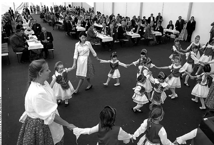
A rendezvényen bemutatkoztak a sárszentlőrinci gyerekek

- Itt nem feltétlenül, sőt egyáltalán nem nemzetközi áramlatokhoz kell kapcsolódnunk, vagy azoktól eltérnünk. Bár megjegyzem, Európa fejlettebb részén az a tendencia, hogy a parányi kistelepülések erősödnek, ahová a régiós központokból költöznek ki a családok. Nekünk mindenekelőtt azt