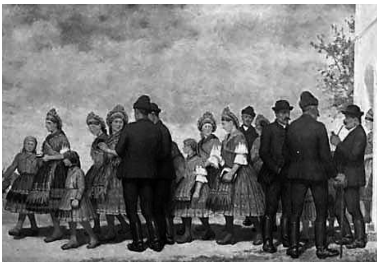
Az első időben Decsen állítják ki a Sárközi délután