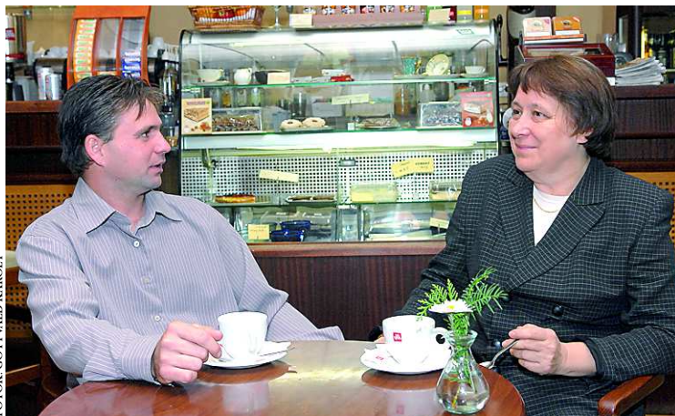
A szakemberek véleményét kérve könnyebb a nehéz pillanatokban

– Az ügyfelek érdekében, a jogszabályok betartásával kell jól, és gyorsan befejezni az ügyeket, megoldani a problémákat. Erre törekszem valóban három évtizede.