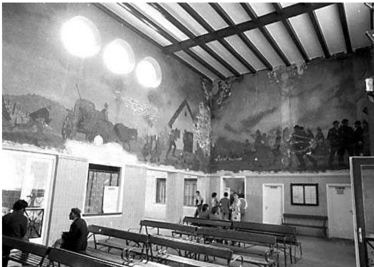
A fotó a freskó lekaparása előtt készült 1982-ben