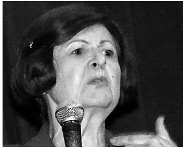
Prof. dr. Bagdy Emőke