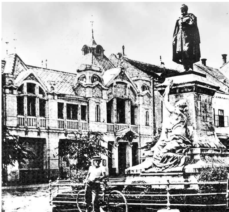
A Világ Mozgóképszínház – Garay árnyékában

tépett ruhával ment haza, s azt mondta az urának, hogy megtámadták, elvették tőle a könyvet is, pénzt is az országúton álló rablók, akik a zsákmánnyal elkerékpároztak. A csendőrség ellenben kinyomozta: az egész hazugság, amit az asszony talált ki azért, hogy a másra költött pénzért az urától ki ne kapjon. Most már az asszony maga is bevallotta: saját maga tépte össze a ruháját, és meghentergett a sárban, hogy meséje annál valószínűbb legyen. A gavallér férj mindennek dacára megbocsátott az asszonynak, és nem tett ellene feljelentést.”