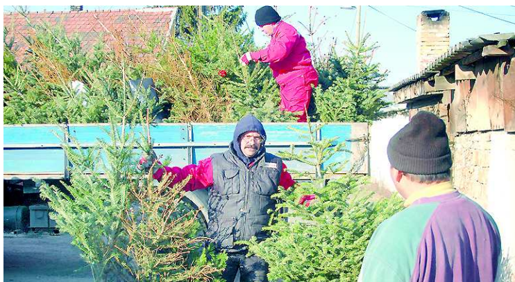
Több héten át meleget adhatnak a begyűjtött karácsonyfák