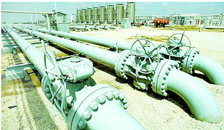
A gázcsapok elzárása nem érinti a szekszárdi távfűtést