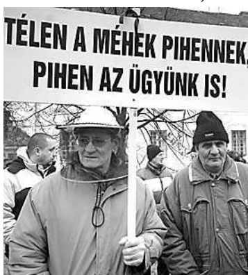
A bíróság előtt demonstráltak

21 méhész kezdeményezett bírósági eljárást. Eddig még első fokon sem született ítélet, sőt, mint azt a méhészek mondták, egy évvel ezelőtt elhunyt az eljárásban közreműködő igazságügyi szakértő, aki helyett – tudomásuk szerint – azóta sem jelölték