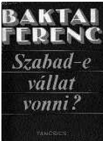
Baktai Ferenc gyűjteményes kötetének címlapja 1976-ból

Mi, szekszárdiak jelképesnek érezhetjük, hogy 1967-ben a Magyar városok című híres sorozatát szellemi szülőhelyének alapos, művészképpével kezdte. Utolsó írása, a Válasz Dallos Lacinak, Szekszárdra beteggyógyából került a Népszava karácsonyi számába . Ebben mondja: „Sok zárat letör-