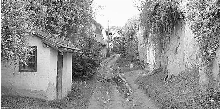
Összefogással több szekszárdi szurdikban javulhat az utak állapota

Tegyük fel: egy útszakasz bekerülési költsége tízmillió, akkor hármon kell megosztotnia az azon ingatlanlall bíró tulajdonosoknak – ha többen