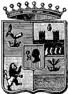
Az Apponyi-család címere

Tolnavárt, az Árpád-kori megyének nevet adó főhelyét a török előtt Csernyéd, utána Simon-tornya követte 1718-ban elhatározott, 1727-ben felépült székházával. Nyolc év múlva már fájlalták a levéltár iratait kifakító nedvességet, később az áradáskor a tömlőc vízében álló rabokról írtak. Styrum-Lymburg gróf 1777-ben még az akasztófákon bomló hullák szagára is panaszkodott... Végül 1778-ban kérte a megye, hadd jelölje ki új székhelyét.