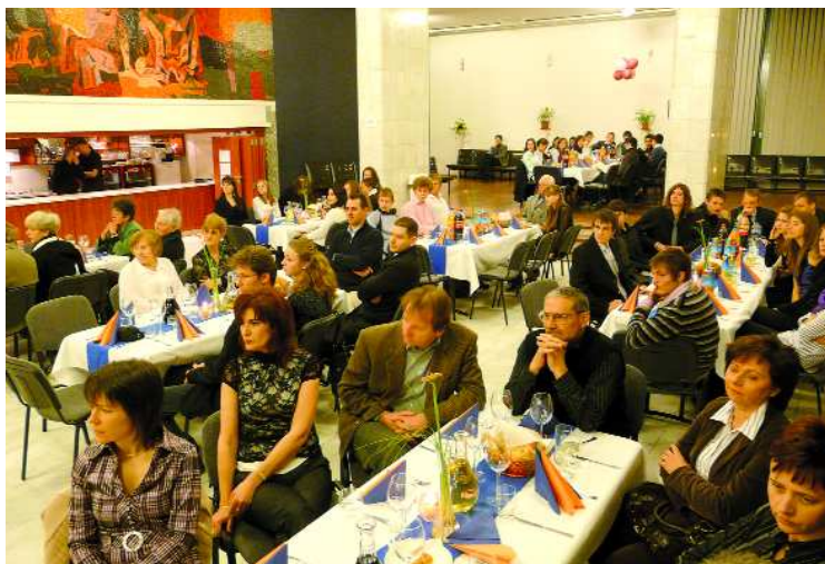
Az AC Szekszárd sportolói, edzői, az elnökség tagjai, a támogatók és a barátok a művelődési ház márványtermében gáláztak