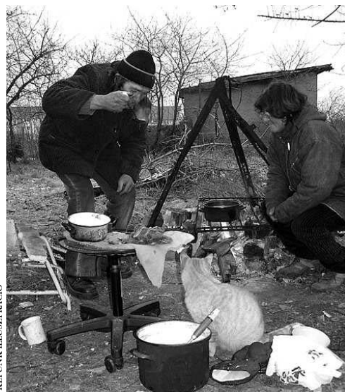
Akad, aki nem megy hajléktalanszállóra

A polgármester kiemelte, hogy november óta krízisvonalat működtetnek. A 06/30-277-26-22-es telefonszámon azoknak a bejelentéseit várják, akiknek segítségre szoruló emberekről van tudomása.