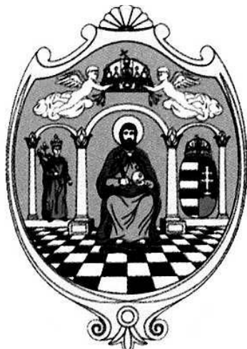
Tolna megye címere

A vetélytársul jelentkező legnépesebb és forgalmas Dunaföldvárt rossz fekvése, Gyöngköt megfelelő épületek hiánya ütötte el a lehetőségtől. A kezdetben esélytelennek látszó Szekszárd földrajzi helyzete nem jó, de a megye nagyobb fele könnyen eléri, s főútvonal halad át rajta. Népeisége meglehetősen, lakóinak csak 1/8-a református, magas az ipart űzők száma, de él itt 70-80 köznemesi család is. Igaz, csak szandzsák és apátsági székhely volt, de ez utóbbi éppen most szűnt meg, s épületeit valósággal kiárusítják. Jobbágyai csupán tizeddel adóznak, birtokaikat szabadon adhatják el. (Így jut itteni szőlője révén jobbágylistára Batthyány József hercegprímás.) A megye jövődó hivatalnokait ez is csábítja. A messze földön híres szőlő és borának jövedelme már önmagá-