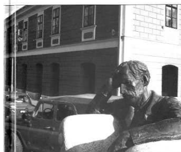
Egy teherautó platóján...