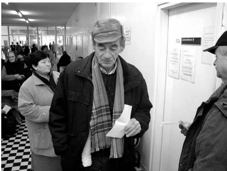
A laborvizsgálathoz is beutaló kell, no meg némi türelem...

– A beutalókról a körzeti orvos a MEP felé jelentést készít, ugyanez történik a rendelőintézetben. Ezáltal válik követhetővé a beteg. Alaki követel-