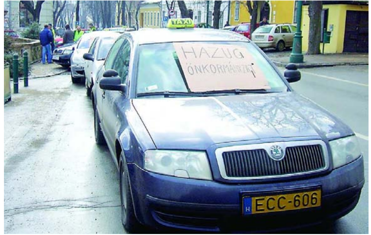
A felírat, amely „kiverte a biztosítékot”