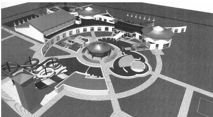
Az élmenyfürdőt már tavasszal elkezdik építeni