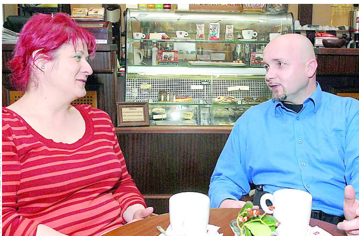
Mester és tanítványa. A shinkendo köti össze őket

– Egyetemista nagyfiam van, a természetjárás, a zene, színház, főzés a kedvenc időtöltésem. S természetesen nagy beszélgetések a jó barátokkal.