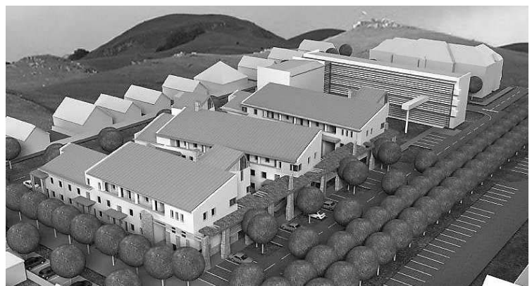
A 61 lakásos társasház a város saját beruházása lesz