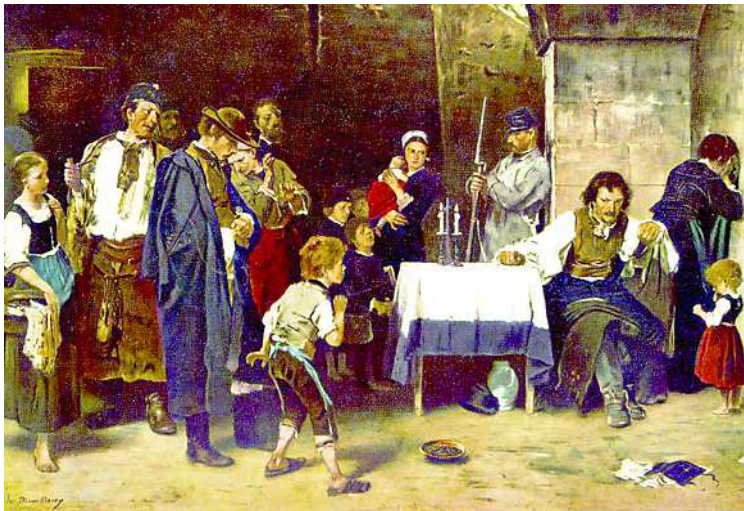
Siralomház, művészettörténetünk egyik leghíresebb kompozíciója

A magyar kultúra napján, január 22-én tartották a Babits Mihály Művelődési Ház és Művészetek Háza Munkácsy-szabadegyetem sorozatának első előadását.