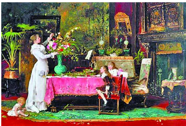
Óriási sikere volt Munkácsy 1877-től festett szalonzsánerképeinek. Az apa születésnapja Pákh Imre tulajdona, és látható Szekszárdon

Az életmű nemzeti karrierjének csúcspontján a Krisztus-trilógia áll,