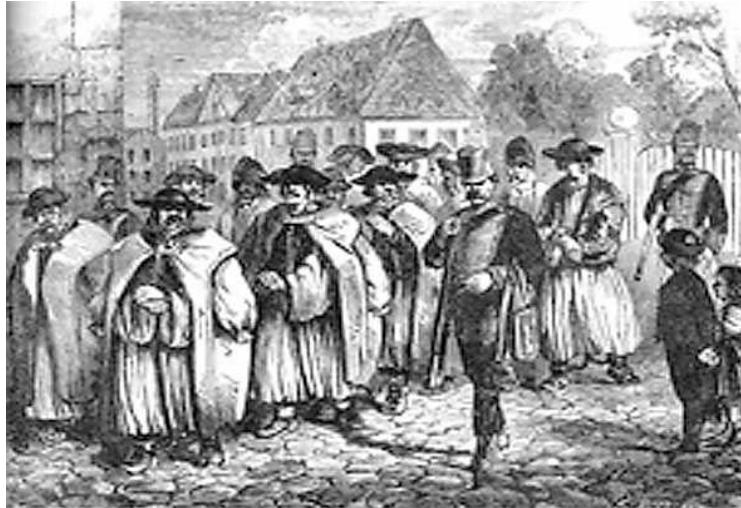
Vármegyei rabok (Lüders rajza)

közepén álló szivárványos kúthoz; nagy vedreket egyensúlyozva a füles rúddal vállalk mérlegén. Ezek a vizsgálati foglyok voltak, akiket patriarhálisan fölhasználtak ilyfajta mun-