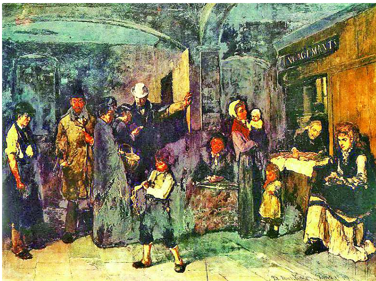
Munkácsy Mihály Zálogház című festménye az elsötétedett lakkréteg eltávolítását követően „kivilágosodott”

A vizsgálatok során kiderült, hogy a képek egy csoportján lényegesen lehet javítani. Ezek közé tartozott a Tépécsinálók , a Zálogház és a Műterem , amelyek az elsötétedett lakkréteg eltávolítása után kivilágosodtak. A többi festményt viszont jó, ha a jelenlegi állapotában sikerül megőrizni. Rengeteg röntgenfelvételt készítettek a képekről, ezek számos érdekességet mutattak. Láthatóvá vált, Munkácsy hogyan építette fel műveit. Megállapították például, hogy a művész feleségének portréján kialakult csúnya, a formákat nyomon követhetetlené tevő, krokodilpáncél-szerű felület azért jött létre, mert a „két ülésből” festett kép modellje először egy sötét mellényt viselt fehér blúzzal, másodszer egy nagyobb de-