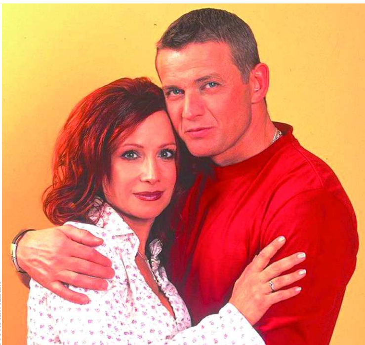
Nemcsak az életben, de a színpadon is egy párt alkotnak

– Az eredeti hajszíнем sötétbarna, majdnem fekete. Valóban kipróbáltam több színt, úgy érzem ez áll hozzám a legközelebb, s talán már a közönség is így is szokott meg.