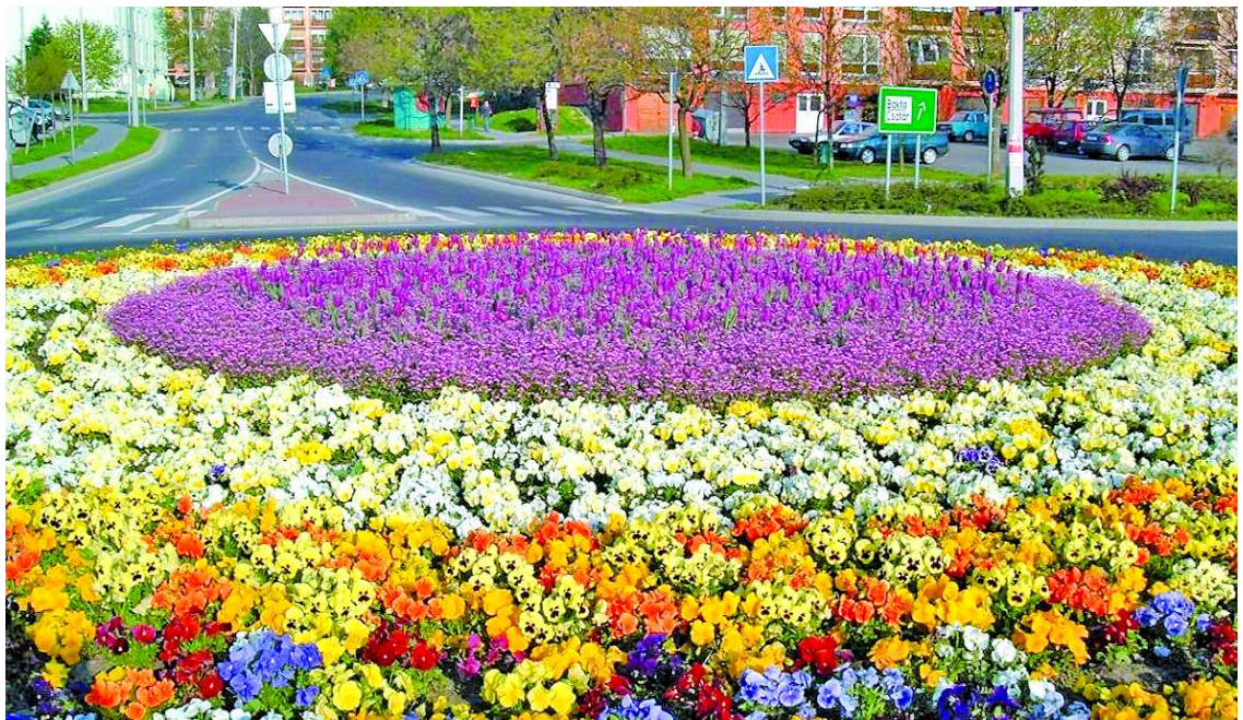
Színpompás virágágy tavaly nyáron a déli körforgalomban

Idén is tartanak kedvezményes vásárt a lakosságnak