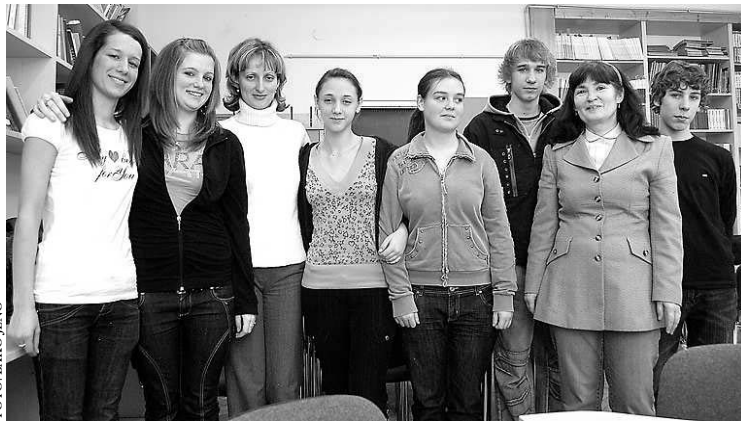
Az I. Béla Gimnázium Barcelonában járt csapata

A szekszárdi team tagjainak – hasonlóan a „Környezetvédelem, valamint az egészséges életmód” projekt témáiban dolgozó további nyolc ország diákjainak – az előadásukat nem anyanyelvükön, hanem angolul kellett megtartani. Mellette a filmet, illetve a diákat is maguk készítették – tudtam meg a tanároktól, s azt is, hogy a pályázatban egy lengyel kolleganőjük vállalta a koordinátori feladatot.