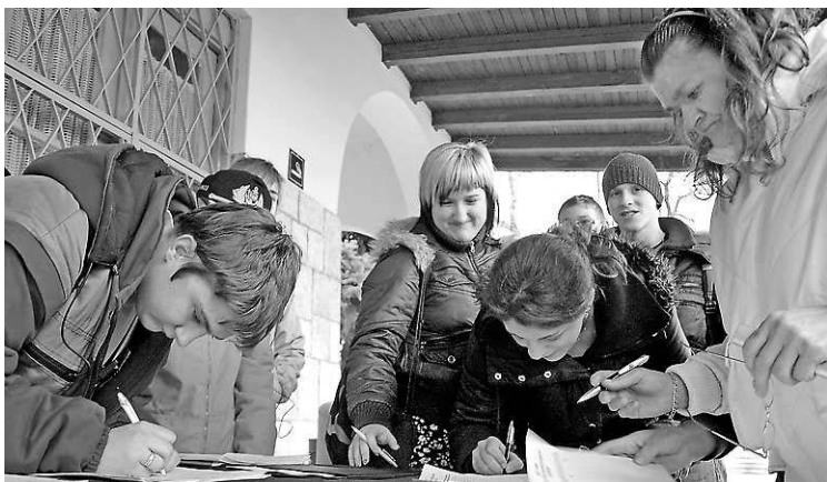
A pályaudvaron fiatalok is aláírták az ívet

Az összegyűlt aláírásokat a közlekedési miniszternek címzett levélhez fogják csatolni a képviselők. Megoldás legkorábban a tavaszi menetrend életbelépésével várható.