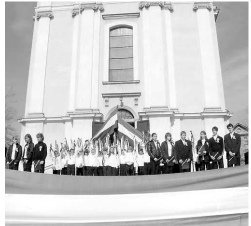
A koszorúkat kérjük közvetlenül a Béla király térre szállítani az ünnepség előtt.

Kérjük azon intézmények és szervezetek képviselőit, akik a március 15-i ünnepségen az 1848-as emlékműnél (Béla király tér) koszorút szeretnének elhelyezni, koszorúzási szándékukat március 13-án 12.00 óráig szíveskedjenek jelezni a Babits Mihály Művelődési Ház és Művészetek Háza Információs Szolgálatánál (Szent István tér 10., Tel.: 529-610).