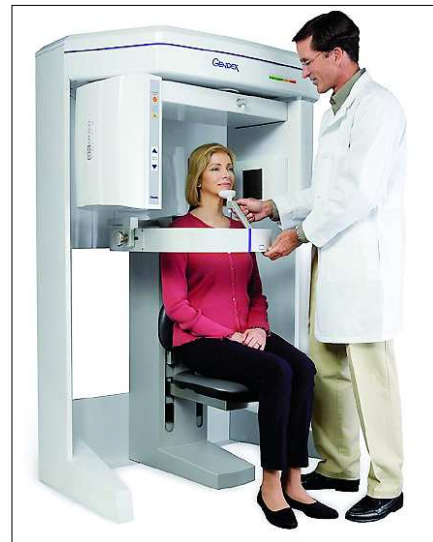
Márciustól üzemel a Halász klinikán a csúcsmínőségű GENDEX fogászati CT

Szekszárd, Munkácsy M. u. 43. Tel./fax: 74/510-885, 510-886 www.magan-fogklinika.hu