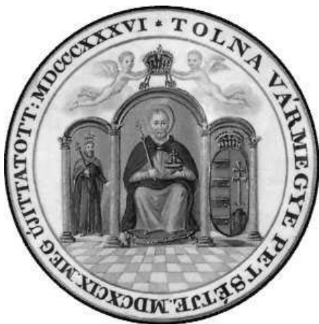
Tolna megye címere (1836)

Az egyházmegye védőszentje Szent Péter apostol, a hagyomány szerinti első pápa. Tolnának nincs külön oltalmazója, de legrégebb ismert címerünkben Szent István és Szent Imre látható, bár az utóbbi feje fölül – nem tudni, miért – az 1836-os magyar nyelvűvé való átfestéskor elmaradt a dicsfény.