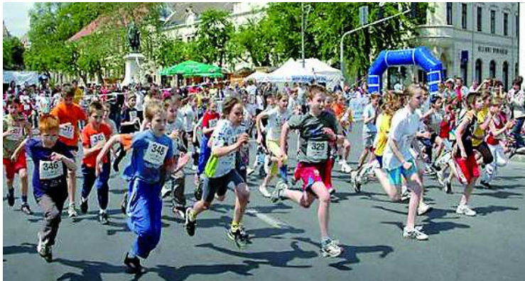
Idén is sok gyereket várnak a szervezők a futóversenyre

Az idei évben a Sportélmény Alapítvány a Tolna Megyei Fogyatékosok