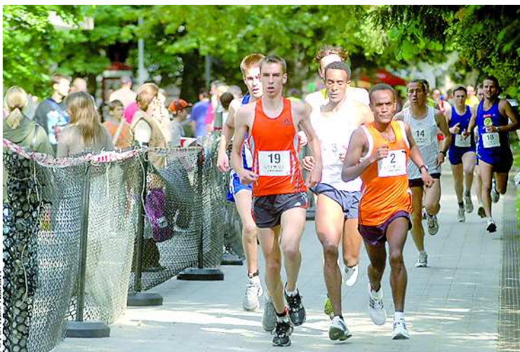
A nézők idén is testközelből követhetik a futóversenyt