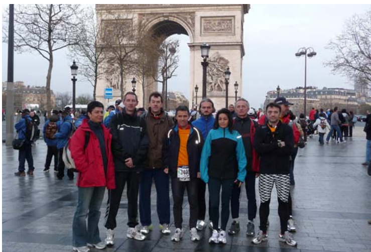
A Párizs-maraton szekszárdi futócsapata a Diadalív árnyékában

Másnap reggel háromnegyed hétkor indultunk a Champs-Élysées-re. A Diadalív túloldalán »cuccoltunk« le, majd elvegyültünk a hatalmas tömegben, amely hat sávban másfél kilométer hosszan betöltötte a nevezetes sugárutat. Harminchétezer ember. Egy Szekszárdnyi ember az aszfalton, s legalább kétszer annyi körös-körül, mégis minden fegyelmzett rendben. Ötvenméterenkénti utcai zenekarok hangkavalkádját, ráadásként Vangelis »Tűzsekere«.