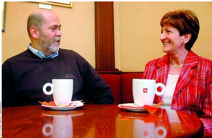
A vezetők tudják: a könyvtár feladata az olvasásra nevelés

– Manapság a televízió és a számítógépes játékok csábítják el a gyerekeket a könyv mellől. Március végén Internet Fiesta hetet tartottunk, ahol az internet értelmes használatára igyekeztünk ráirányítani a gyerekek figyelmét. Honlapokat ajánlottunk, feladatokat kaptak. A jól használt internetezés nem feltétlenül gyengíti az olvasási hajlandóságot, sőt a kettő erősíti egymást.