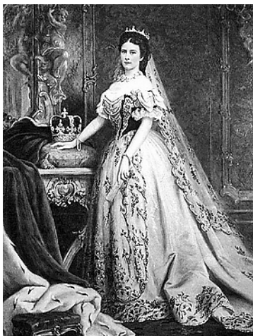
Székely: Erzsébet királyné

A XVIII. század végén, a XIX. század elején hangsúlyozza először néhány festő, hogy a műalkotás illúzió. Erre hívja fel a figyelmet David 1793-ban festett Marat halála című képén a holttest, a kompozícióhoz illeszkedő, természetellenes elhelyezkedése. Később Manet közbotrányt okozó, híres Reggeli a szabadban című képén a műtermet két fiatal festővel és egy aktmodellel egy parkba helyezte. Mindezen újítások mellett a XIX. század művészei szerettek előképek alapján dolgozni. A klasszicista festményeken megjelenő mitológiai té-