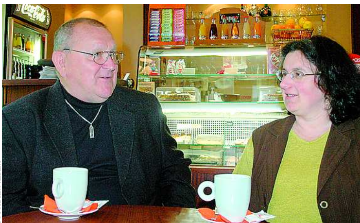
A múlt értékeinek felkutatása, megőrzése a hivatásuk

– A Babits ház, a kiállítás, az évforduló minden szabadidőmet elvitte, de jó csapatban dolgozhattam. Szabadidő? Akkor is a szakma, kiállítások látogatása. Véletlen, hogy a múzeum lett a hivatásom, az életem, bár gimnazistaként két nyáron „lapátoltam” egy régész-táborban a Nagyharsányi hegy alatt, egy római kori villa feltárásánál. Lehet, hogy még sincsenek véletlenek?