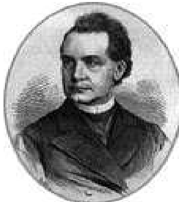
... és a hetedik, Fraknoi Vilmos - kinevezése idején

Az őt követő Blasy József pozsonyi plébános, aki 1813. február 25-én született, csupán 1879. március 30-tól