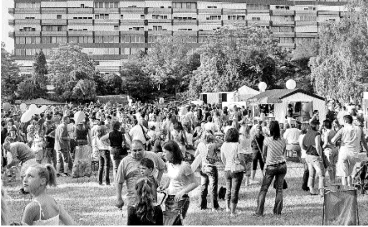
Idén is több százan jöttek el a Prométheusz Parkba