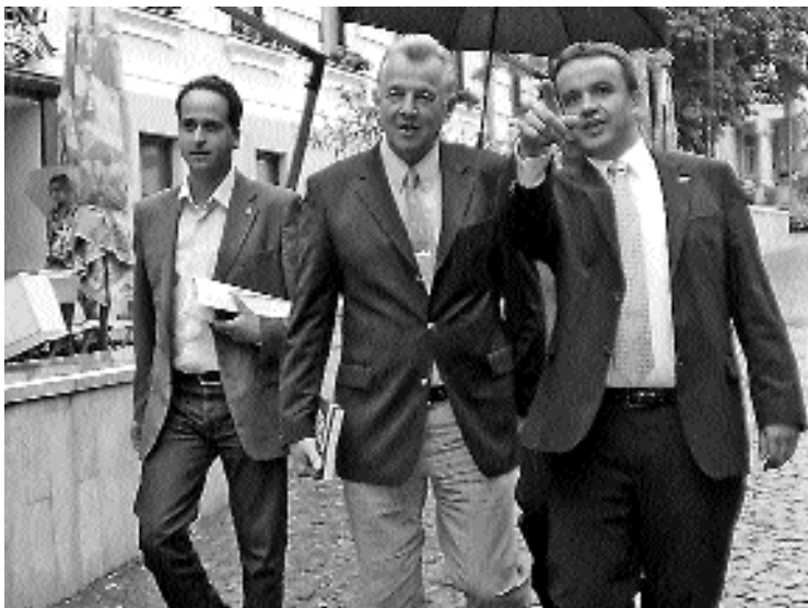
Schmitt Pál (középen) Horváth István társaságában a sétálóutcán

Schmitt Pál elmondta: öt évvel ezelőtt – a hozzáadott értékek tekintetében – az elsőként voltunk a belépő országok között. Ma a mutatók – az euró céldátuma, az államadósság, a költségvetési hiány, a forint instabilitása, a külföldi tőke bizalomvesztése, a munkanélküliség növekedése – alapján szinte minden területen a sereghajtók közé tartozunk. „Külföldi képviselő-társaim gyakran meg is kérdezik tőlem: Magyarország valóban csak ennyire képes?” Schmitt Pál szerint a lemaradás oka a kormányzásban keresendő. „Lassan olyan új célokat kell kitűznünk magunk elé, mint hogy érjük utol Szlovákiát” – mondta a Fidesz-KDNP EP-listavezetője, utalva arra, hogy északi szomszédaink már euróval fizetnek, uniós tagságuk első