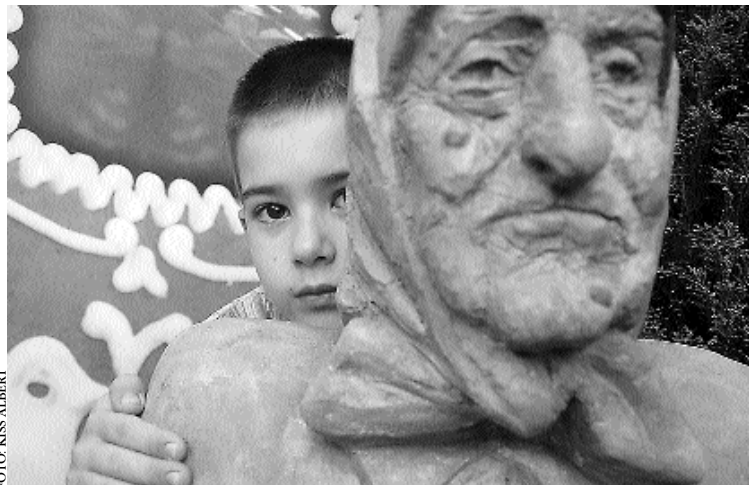
Ismerkedés a Jóságos boszorkánnyal