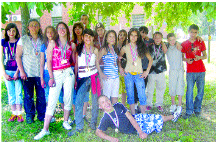
A szekszárdi csapat 28 éremet szerzett a dombóvári versenyen