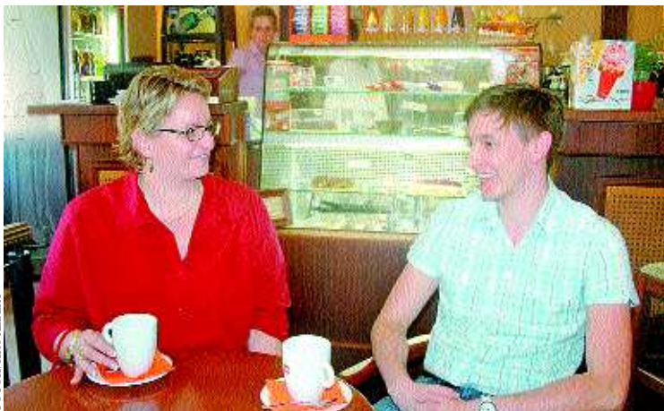
A nyelvtudás a tanár és a diák közös sikere

- Mindenképpen az angolt kell elsőként említenem, aztán a német, olasz, francia és spanyol nyelv. Jómagam az angol mellett franciát és spanyolt tanultam.