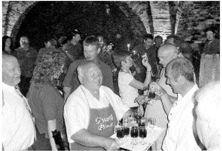
Nagy a sürgés-forgás a Gyalog Pincében