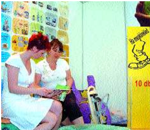
Nagy siker volt az Alisca Terra standja

A Házam a Váram szakkiállítás – a korábbi esztendők főként image-növelő bemutatkozásaiával szemben –