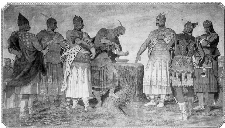
Vérszerződés. Falkép a kecskeméti városháza tanácstermében

Székely első megvalósult falkép-ciklusát – a maig legnagyobb politikai allegóriát Magyarországon – a Deák-ma-