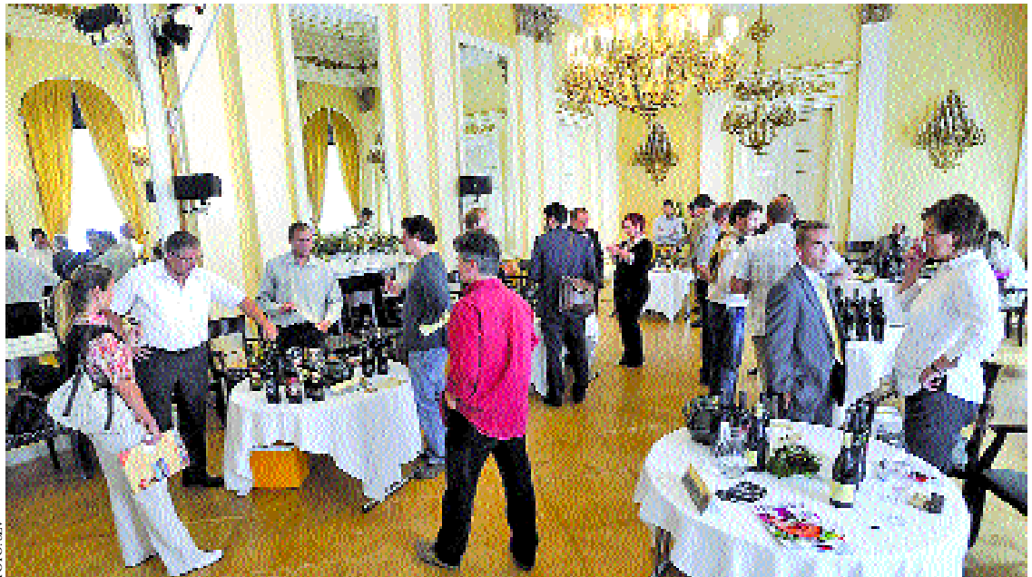
A Károlyi Palota másodszer adott otthont a szekszárdi borok exkluzív bemutatójának

Új pincészetek is letették névjegyüket a Károlyi Palotában