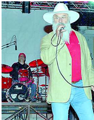
Szombaton az Apostol együttes adott nagysikerű koncertet