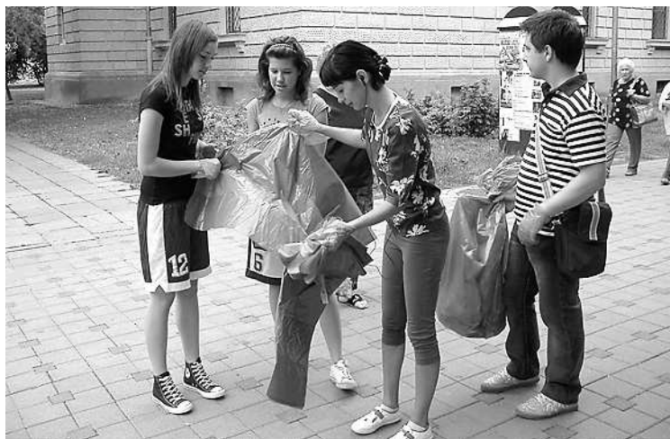
Fiatal önkéntesek a fasorban gyűjtöttek szemetet