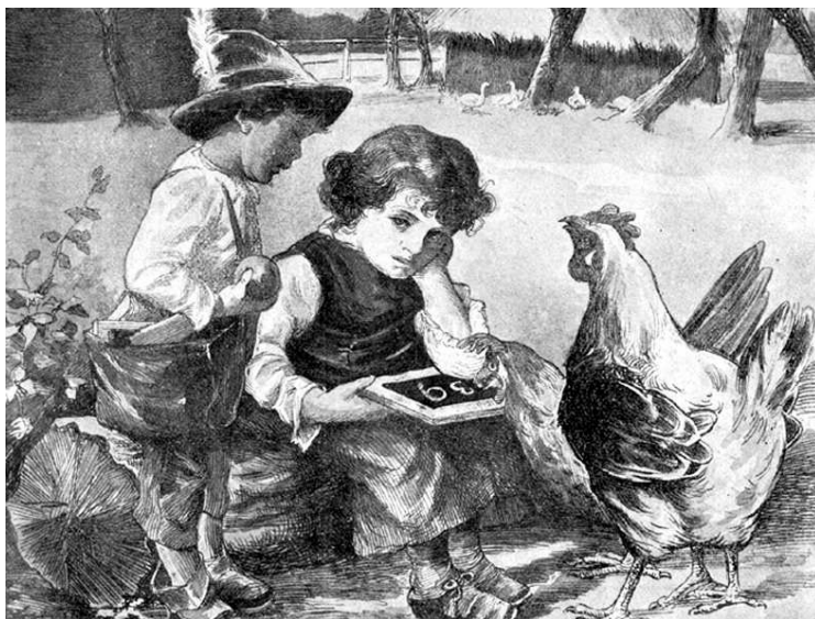
Múlik a nyár...

(Az Én Ujságom gyermeklap rajza 1905-ből)