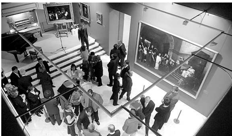
A jubileumi évben Munkácsy- és Székely-kiállítást is vendégül látott