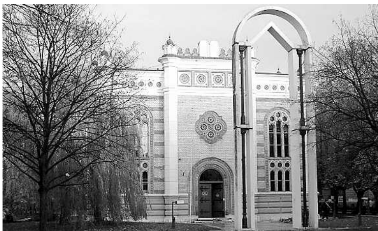
Az egykori Zsinagóga épülete ma a kultúra, a művészetek otthona