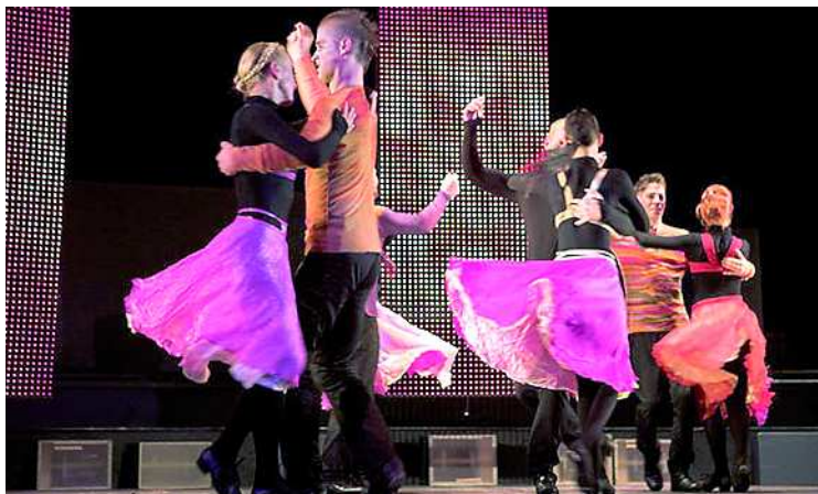
Látványos tánc-showt ígér a Presidance Company előadása

A magyar zenei és prózai irodalom egyaránt sokat foglalkozik a legendás királyunk – államalapító Szent István királyunk figurájával. Az István, a király című rockoperán kívül csodás zenei és prózai darabok születtek e témakört feldolgozva. Így például a Kiatkozottak (rockopera), a Gizella (rockopera), az Attila, az Isten ostora (rockopera), az Árpád népe (rockopera), valamint a Honfoglalás című film, az István, a király prózai remekmű és az