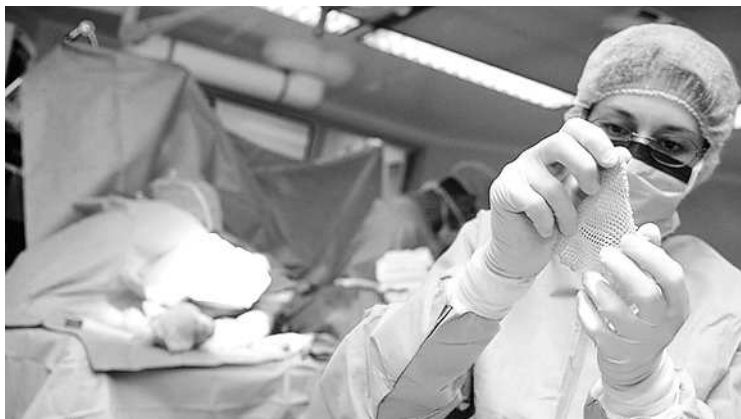
Világszínvonalúak a hazai transzplantációs műtétek is